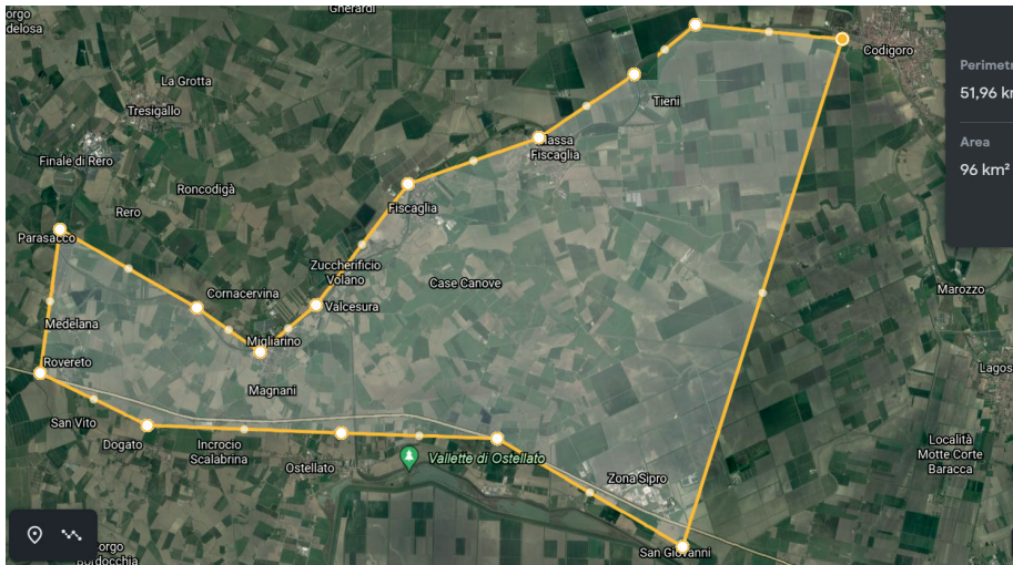
Fig. 4: Estensione approssimativa della massa Fiscalia .