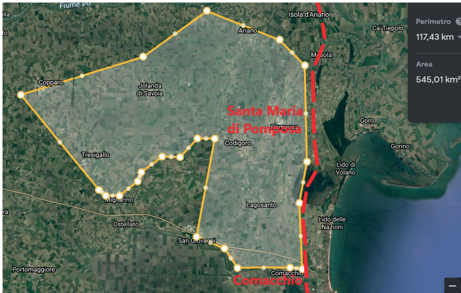
Fig. 2: Estensione approssimativa della massa di Lagosanto (a tratteggi la linea di costa in età medievale).