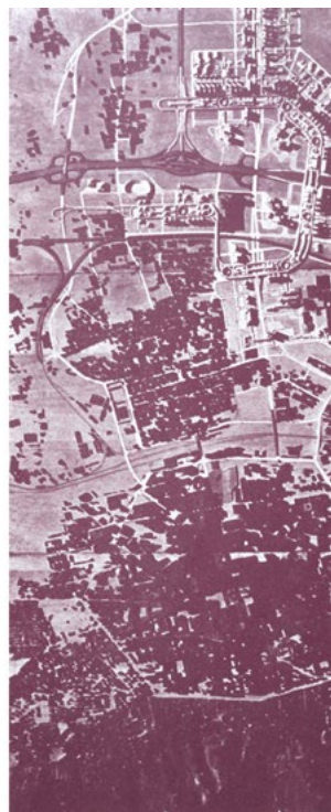
4: Copertina del primo numero di «Parametro» (maggio-giugno 1970). Fotografia aerea del plastico del centro storico in rapporto al nuovo centro direzionale secondo il primo masterplan di Kenzo Tange (pagina 49 della rivista).