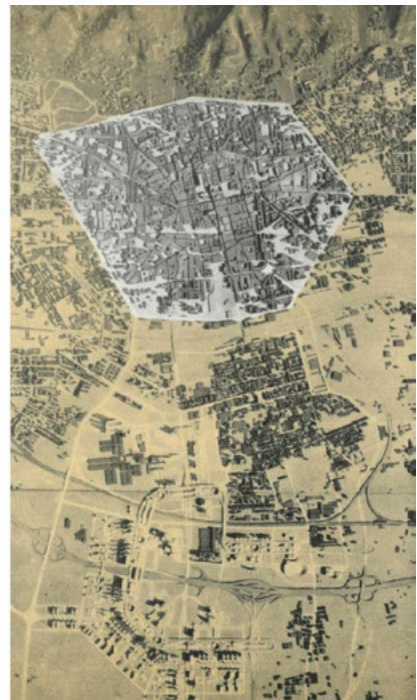
1: Copertina del catalogo della mostra Bologna Centro Storico tenutasi a Palazzo D'Accursio, 1970. Fotografia aerea del plastico della città ruotata rispetto alla convenzione del nord verso l'alto e indicante il centro storico con una campitura bianca (pagina 8 del catalogo).