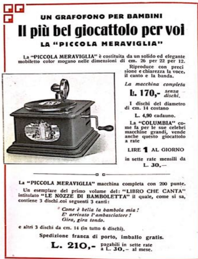
fig. 3 - Prima pubblicità del "Piccola Meraviglia" (novembre 1923)

“Bebè racconta la guerra”. Propaganda fascista e dischi per bambini (1920-1930)