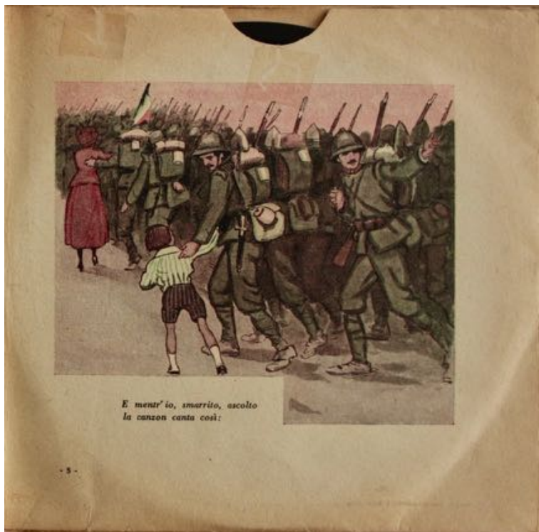
fig. 5 - Bebè racconta la guerra – Prendi il fucile

“Bebè racconta la guerra”. Propaganda fascista e dischi per bambini (1920-1930)