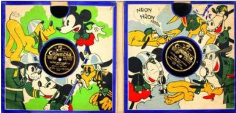
fig. 8 - Albo a colori dei dischi di Topolino

Così, sulle note di una marcia intonata da Crivelli («Su muoviamo con ardore / il nemico a sterminare. / E il vessillo tricolore / dovrà sempre trionfare!»), Topolino va in battaglia. Tra i fischi dell'artiglieria pesante, con un gesto eroico darà la carica e sconfiggerà da solo cinquanta mori, tenendo fede alla promessa fatta al suo arrivo in Italia al fanciullo balilla, che non potrà che guardarlo (anzi, ascoltarlo) ammirato.