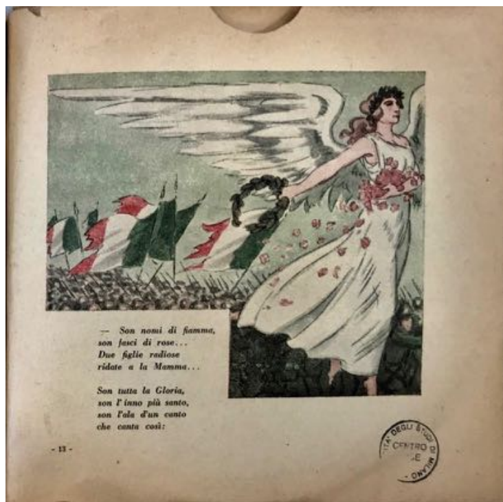
fig. 7 - Bebè racconta la guerra – Giovinezza

“Bebè racconta la guerra”. Propaganda fascista e dischi per bambini (1920-1930)