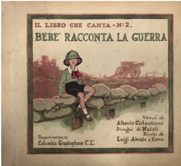
fig. 4 - La copertina di Bebè racconta la guerra

Come lascia intendere il titolo, il secondo “Libro che canta” contiene un racconto in prima persona dell’esperienza della Prima Guerra Mondiale, affidato alla “voce” di un bambino ad uso e consumo di altri bambini (prevalentemente maschi). Nella prima parte, «in un’alba di maggio» il padre di Bebè è in procinto di partire «con un segno tricolore / sul cappel da soldatino», per andare a riscattare «un lido nostro e caro ove lontani / stan dei fratelli avvinti a una catena» (COLANTUONI 1923b: 3-4). La tristezza del bambino, la sua paura dinanzi all’incertezza del ritorno, sono leniti da un canto improvviso, nelle cui parole «c’è il tremar di una speranza / c’è qualcosa che si spezza / - un po’ pianto un po’ carezza - / c’è il pensier di un caro volto» (COLANTUONI 1923b: 4).