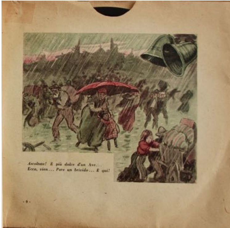
fig. 6 - Bebè racconta la guerra – La canzone del Grappa

Alla fine, però, l'Italia riesce a trionfare e il viso «segnato dal pianto» si apre nel «guizzo d'un riso»: Trento e Trieste «son nomi di fiamma, / son fasci di rose... / Due figlie radiose / ridate a la Mamma». Un futuro luminoso attende Bebè e la Patria, per i quali si dispiega «l'inno più santo»: «Giovinezza, giovinezza / primavera di bellezza!» (COLANTUONI 1923b: 12-13) 24 .