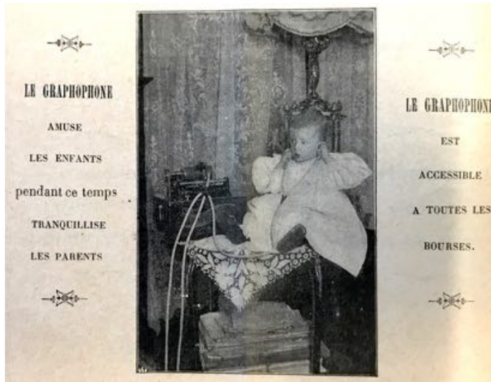
fig. 1 - Pubblicità delle auditions enfantines della Columbia francese (1899)