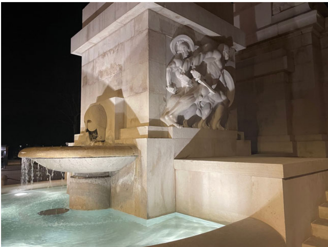
Fig. 5. Forlì, Monumento ai Caduti, dettaglio del basamento e delle vasche in funzione dopo il recente restauro

Dopo lunghe riflessioni, alla presenza dei funzionari della Soprintendenza, si è inoltre deciso di rimuovere la lapide apposta nel 1965, dedicata “A TUTTI I CADUTI PER LA PATRIA” che copriva la scritta originaria “AI CADUTI DELLA GRANDE GUERRA - AI MARTIRI DELLA RIVOLUZIONE FASCISTA - ANNO X”. Il testo “Ai martiri della rivoluzione fascista” e “anno X” furono abrasi in data imprecisata così, la Soprintendenza ha concesso di non ricollocare la lastra posticcia che è stata posata all'interno della Cappella Votiva, restaurando quel che rimane della scritta originaria.