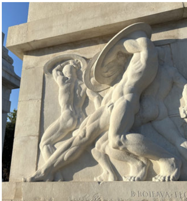
Fig. 6. Forlì, Monumento ai Caduti, dettaglio delle sculture del basamento realizzate da Bernardino Boifava dopo il recente restauro