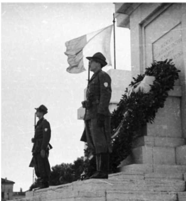
Fig. 3. Forlì, Monumento ai Caduti, iscrizione originaria dedicata "Ai Caduti della Grande Guerra e ai Martiri della Rivoluzione Fascista"