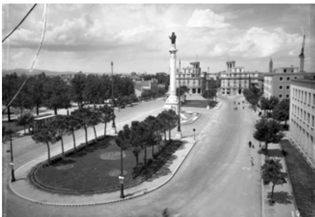
Fig. 1. Forlì, Piazzale della Vittoria con al centro il Monumento ai Caduti, 1950