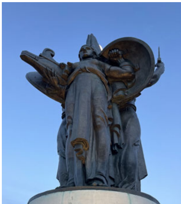
Fig. 7. Forlì, Monumento ai Caduti, dettaglio delle Vittorie Alate bronzee, dopo il recente restauro

Il secondo dopoguerra rappresenta il periodo di messa in discussione dei principi alla base del restauro e, in particolare, è dagli anni Sessanta in avanti che il tema della reintegrazione della lacuna, grazie a Cesare Brandi, diviene centrale nel dibattito più erudito. È inoltre proprio in questi anni che l'apporto dei laboratori e delle scienze applicate ai beni culturali si affermano con maggior forza. Tuttavia, nei contesti più periferici, tale attenzione si radica con più difficoltà, smorzata dalla necessità di combinare risorse esigue e mancanza di manodopera specializzata, rendendo il cantiere di restauro non molto diverso da un cantiere di edilizia comune. Più che lo studio, l'analisi e la comprensione dell'esistente, è la fiducia nella tecnica maggiormente impiegata a determinare i dettagli esecutivi.