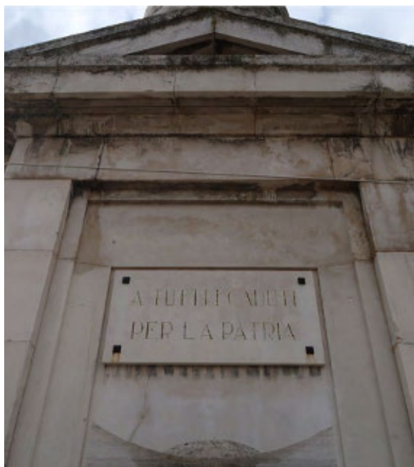
Fig. 4. Forlì, Monumento ai Caduti, lapide apposta nel 1965 dedicata "A tutti i caduti per la patria" e oggi collocata all'interno della cappella votiva

elementi lapidei originali. Allo stesso modo, le lastre della pavimentazione collocate ai piedi del basamento, sul lato rivolto verso i giardini pubblici e caratterizzate da un disegno a triangoli, furono sostituite con altre lastre dissimili per materiale e forma. La rottura degli elementi, avvenuta probabilmente durante un'ispezione del sistema idraulico che alimentava le vasche, fu dunque risolta attraverso una sostituzione che si avvaleva del materiale disponibile, facendo sì che l'integrazione della lacuna alterasse l'unitarietà percettiva del monumento stesso. Anche la pavimentazione interna della cella subì lo stesso trattamento, in questo caso l'elemento centrale fu però sostituito con una gettata in cemento. Negli anni '65-'70 invece, fu demolita una vistosa porzione della vasca, per rifare lo scarico delle acque, aggiungendo un nuovo pozzetto di raccordo nell'ovale esterno e procedendo ad integrare il fondo della vasca con materiale bituminoso.