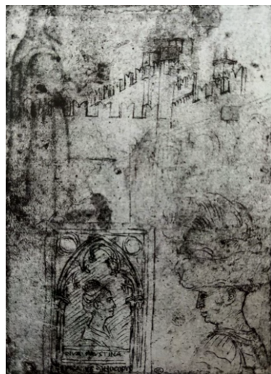
1 | Pisanello, Struttura architettonica in scorcio, ritratti di profilo verso sinistra di Gianfrancesco Gonzaga e Niccolò III Este, ritratto di Faustina maior di profilo verso destra, disegno a inchiostro bruno, tracce di carboncino, Paris, Musée du Louvre, département de Arts graphiques, RF 519r, ca. 1430-1435.

Il concetto stesso di naturalismo, e/o di realismo, viene a costituire spesso, ancora ai nostri giorni e non solo nelle sedi di divulgazione, una sorta di dato valoriale assoluto – nel Medioevo non c'è, nel Rinascimento sì, compare già nel Tardogotico pur se in forma rapsodica (c'è nei singoli elementi, non nella visione generale), e quant'altro, assieme a ulteriori formule topiche più o meno sensate. Gli assunti di fondo – espliciti o impliciti – sono due. Una scala ascendente, magari soffusa e sottotraccia ma pur spesso presente, di tipo evolutivo vasariano rispetto a un supposto 'progresso'; e l'idea che le forme convenzionali ordinate e razionali siano entità di maggiore vicinanza al reale perché confezionano di quest'ultimo una versione standardizzata e più comprensibile (almeno ai competenti), affidabile e replicabile. Ciò corrisponde a una sorta di versione laica – modellata sulla combinazione ragione/regola e non più sulle istanze spirituali