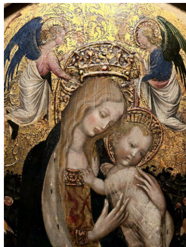
3 | Pisanello, Madonna della quaglia , tempera e oro su tavola, Verona, Museo di Castelvecchio, 1420 circa.

I tempi del filosofo olandese sono gli stessi in cui opera Amico Aspertini, pittore eccentrico e grottesco per definizione, che nei suoi due riquadri del ciclo di affreschi dell'oratorio di Santa Cecilia a Bologna, e in altri per cui è stata proposta un suo eventuale coinvolgimento da definire, recupera per alcuni dettagli l'uso dell'oro applicato in foglia su spessa base di gesso e colla: un dato letto giustamente spesso come neo (o post) medievale, che nelle tavole di Pisanello, tra le quali figurava nell'esposizione mantovana la Madonna della quaglia di Castelvecchio [Fig. 3], trova forse la sua glorificazione (la scelta materiale aspertiniana potrebbe anche servire a chiarire certi aspetti di cronologia e attribuzione della serie felsinea, molto discussi, che qui ovviamente non ha senso affrontare, e palesa comunque – come alcune opzioni iconografiche del ciclo – una scelta davvero interessante di continuità con ideali old fashioned ; sulla tavola a Verona bastino Pisanello 1996b, scheda 35, 78-80, Cordellier, e Pisanello 2022, scheda I, 98-102,