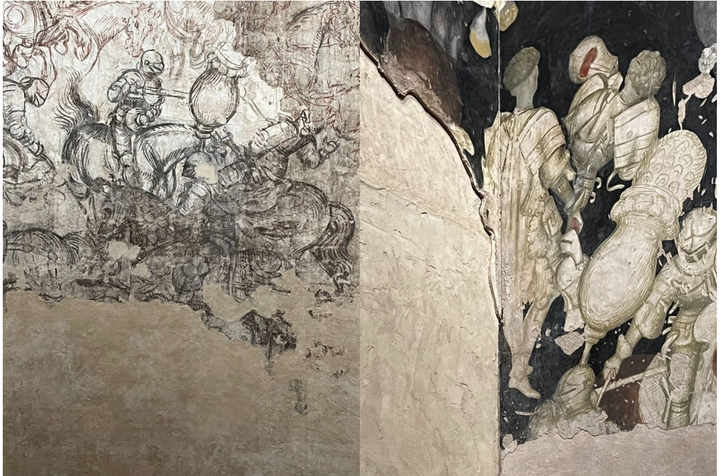
2 | Pisanello, Torneo al castello di re Brangoire (particolari), sinopia e pittura murale (non completata), Mantova, Palazzo Ducale, 1430-33.

rispetto a questi temi, dalla parte specularmente opposta dell'edificio, nell'area del Castello di San Giorgio) – si sarebbero però palesate una scala di valori differenti, e soprattutto