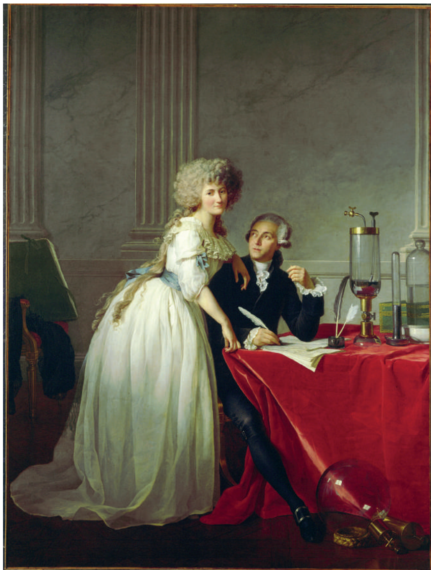
Fig. 1b - Antoine-Laurent and Marie-Anne Pierrette Paulze Lavoisier ( Lavoisier et sa femme ), di Jacques-Louis David. 1788. Olio su tela, 259.7 x 194.8 cm. Metropolitan Museum of Art, New York.

ma soluzione, David aveva anche pensato alla rappresentazione di un grosso strumento associato a un recipiente di vetro globulare 1 i cui contorni però non sono chiaramente visibili dalle immagini pubblicate nei due studi citati (Fig. 2a e 2b).