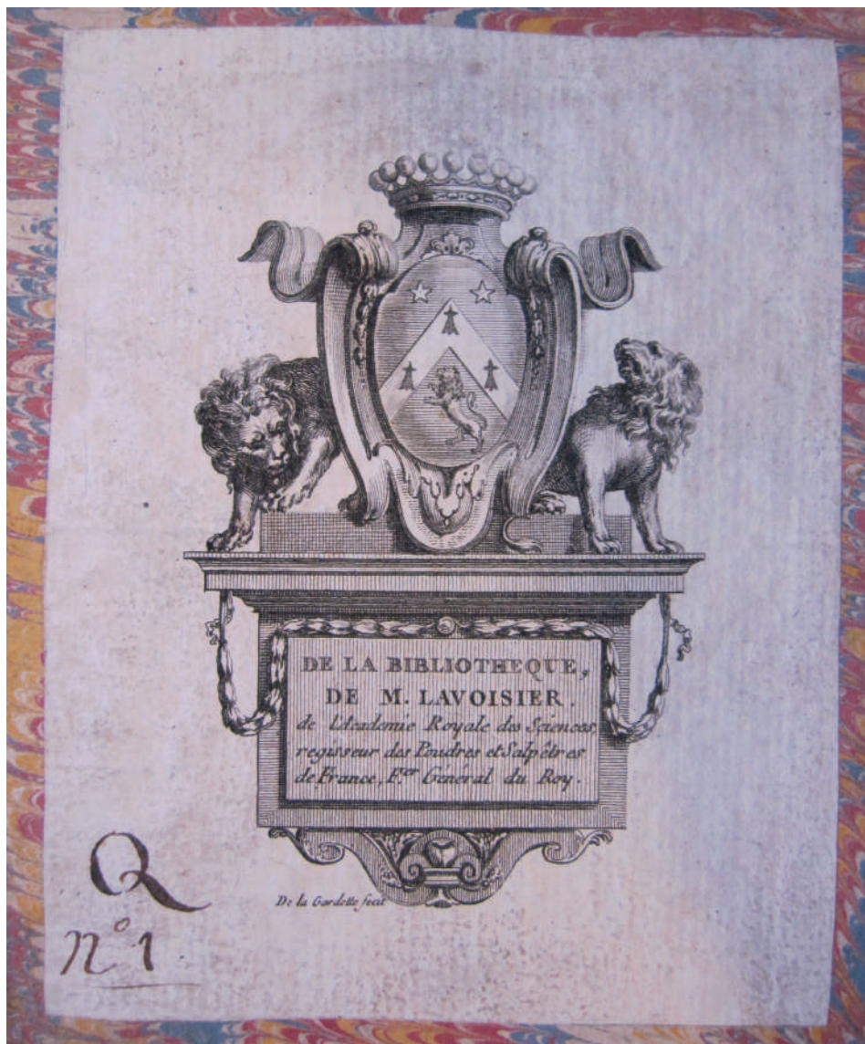
Fig. 5 - Ex libris di Lavoisier. Bibliothéque de l'Institut Paris.

fino ai primi mesi del 1794, pensava non sarebbe stato difficile, documenti alla mano, smontare gli argomenti dell'accusa.