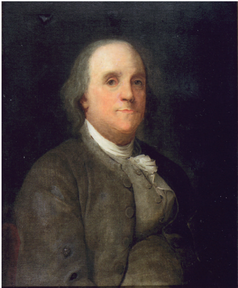
Fig. 6 - Ritratto di Madame Lavoisier di Benjamin Franklin (1787). Collezione degli eredi di Benjamin Franklin.

Poco dopo, nel consesso lavoisieriano si accese una discussione animata sull'immagine da incidere come frontespizio della traduzione francese dell' Essay on Phlogiston [Lavoisier, 1993, p. 135; Beretta, 2001, p. 44-45], opera della