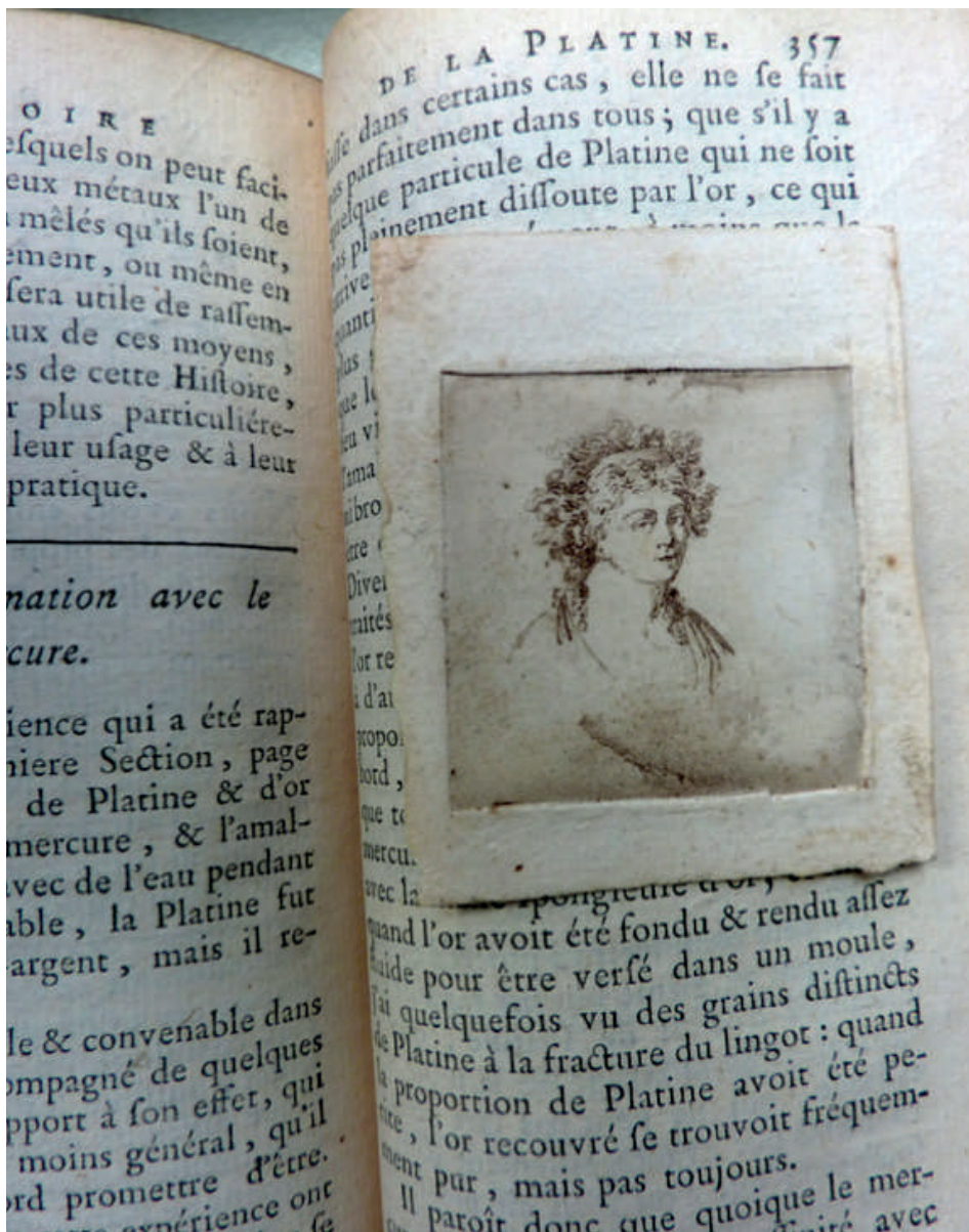
Fig. 7 - Autoritratto inciso di Madame Lavoisier.

lo aveva collocato in bella mostra nel suo appartamento al Louvre. Mi pare dunque plausibile che David si fosse ispirato nella prima versione al celebre ritratto di uno scienziato ammirato da Lavoisier e testimone delle sue nozze.