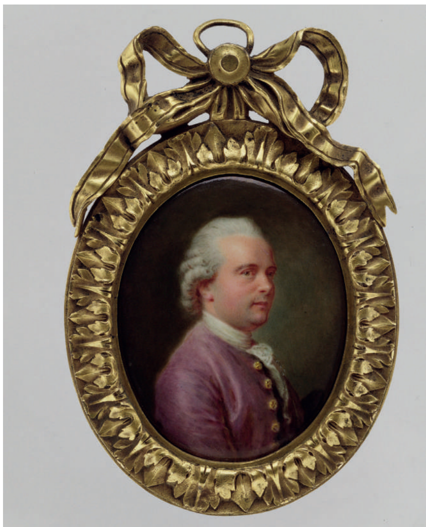
Fig. 4 - Miniatura di Pierre Pasquier del matematico Charles Bossut. 62 x 50 mm. Metropolitan Museum of Art, New York.

su cui raramente espresse un giudizio esplicito. A questo riguardo mi pare significativo che nel 1773 il pittore Pierre Pasquier presentava al Salon parigino una miniatura di Lavoisier, oggi perduta, e una del matematico Charles Bossut (Fig. 4), entrambi qualificati come membri dell'Académie Royale des Sciences [ Explication , 1773, p. 27-28], segno che, fin dall'inizio, Lavoisier riuscì a dare di sé principalmente l'immagine di un membro autorevole della comunità scientifica e a lasciare in secondo piano, se non addirittura nascosto, il suo ruolo di spicco nella Ferme e nella finanza parigina.