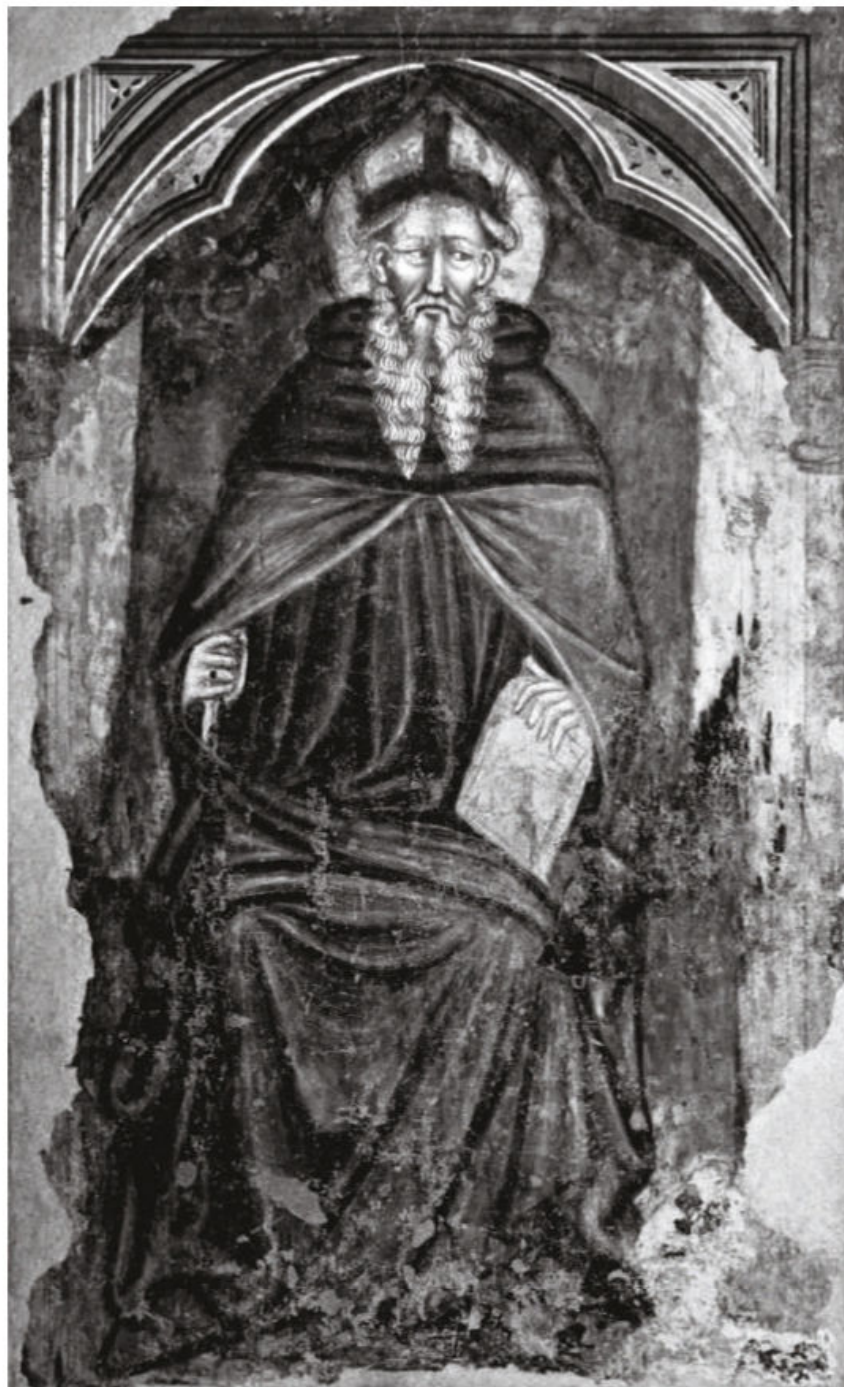
Fig. 5. Pittore bolognese del XIV secolo, Sant'Antonio abate . Bologna, Museo di Santo Stefano.