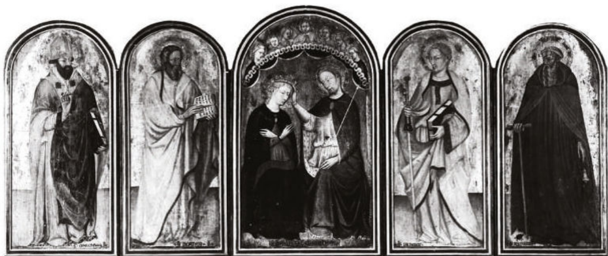
Fig. 4. Giovanni di Bartolomeo Scanelli, Incoronazione della Vergine e i santi Giovanni Evangelista, Marco, Giacomo Maggiore, Antonio abate . Bologna, Museo di Santo Stefano.