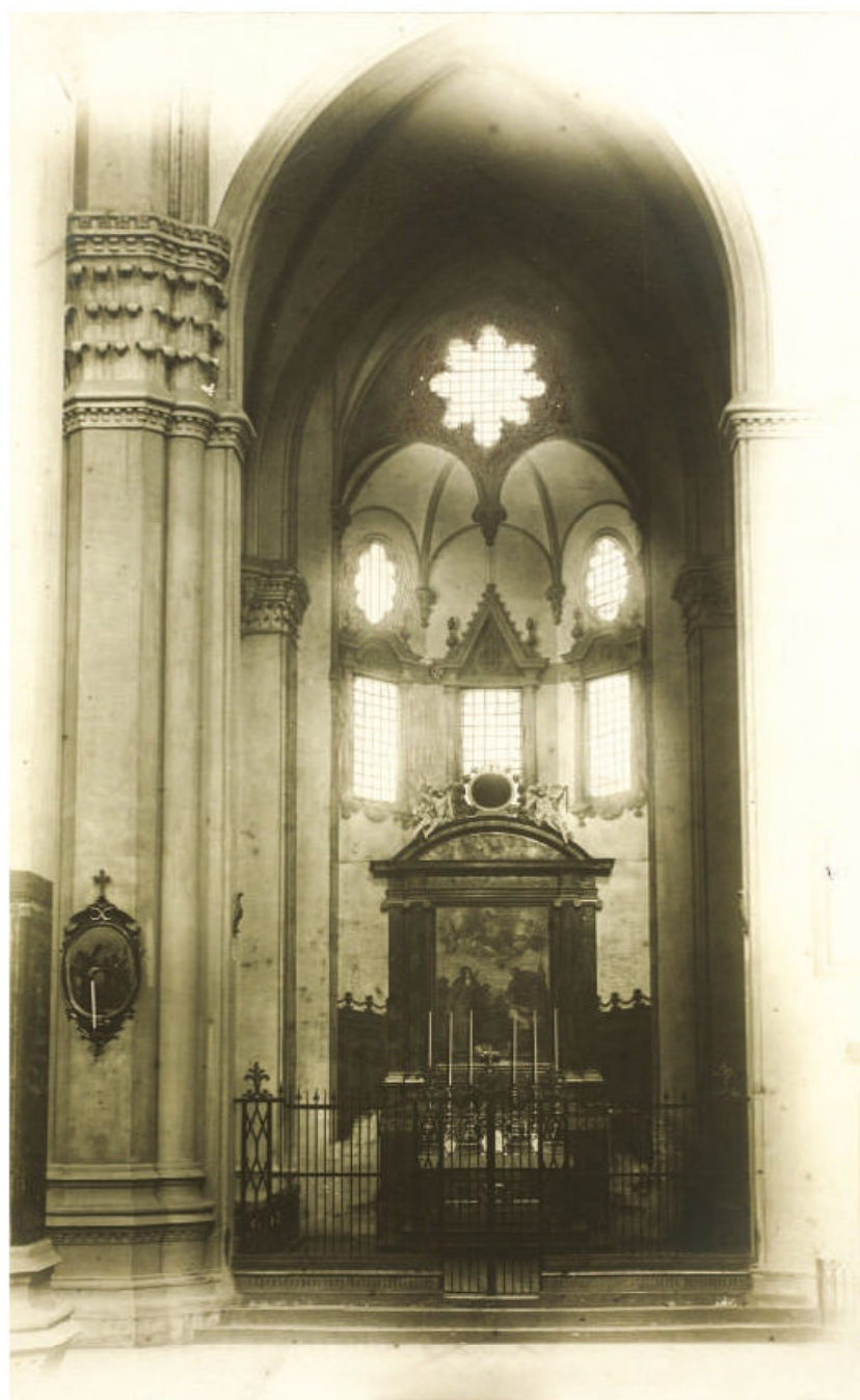
Fig. 6. Bologna, San Petronio, cappella di Santa Brigida prima dei restauri Cavazza della fine del XIX secolo, veduta dalla navata.