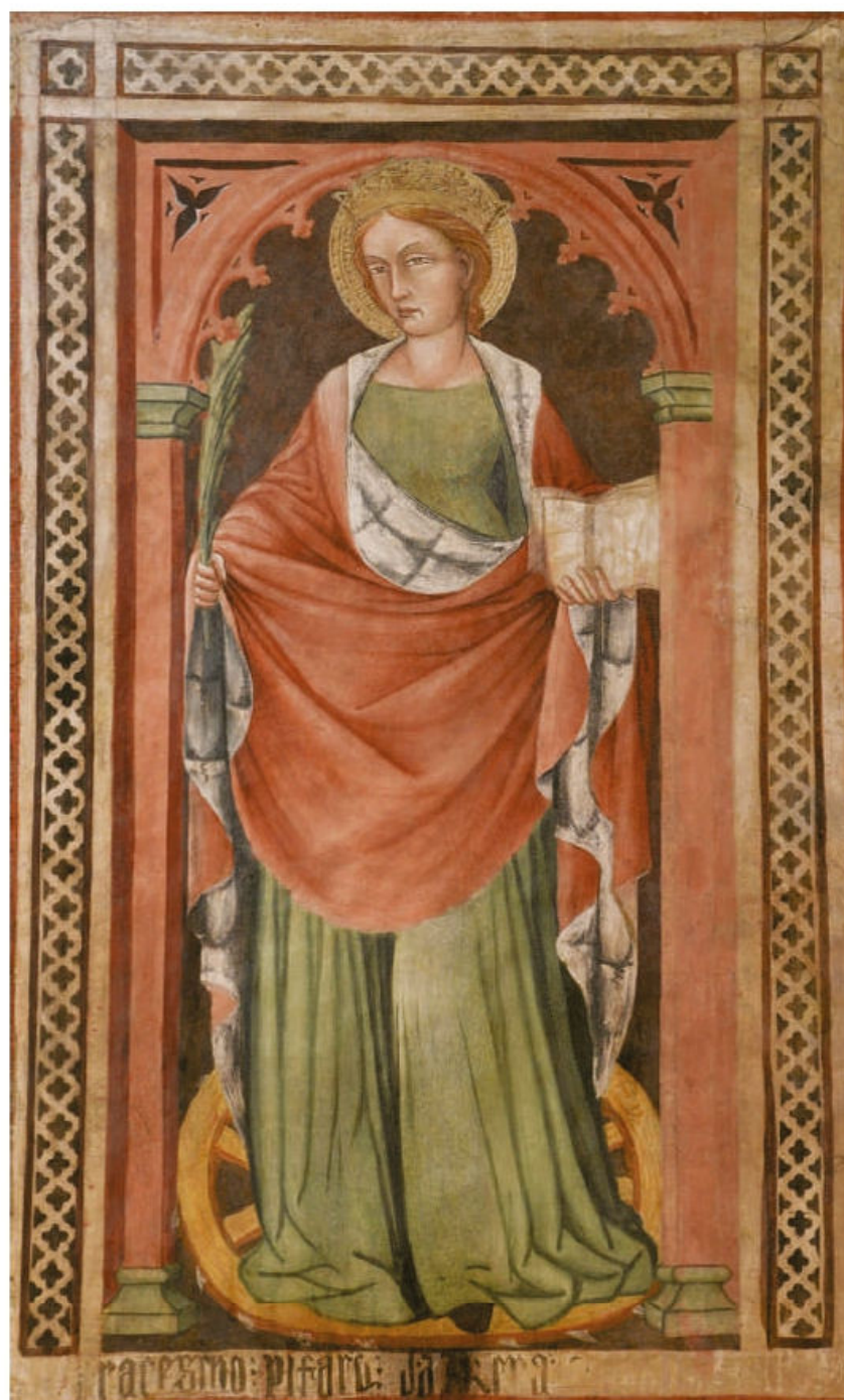
Fig. 2. Giovanni di Bartolomeo Scanelli, Santa Caterina d'Alessandria . Bologna, San Petronio, cappella di Santa Brigida.