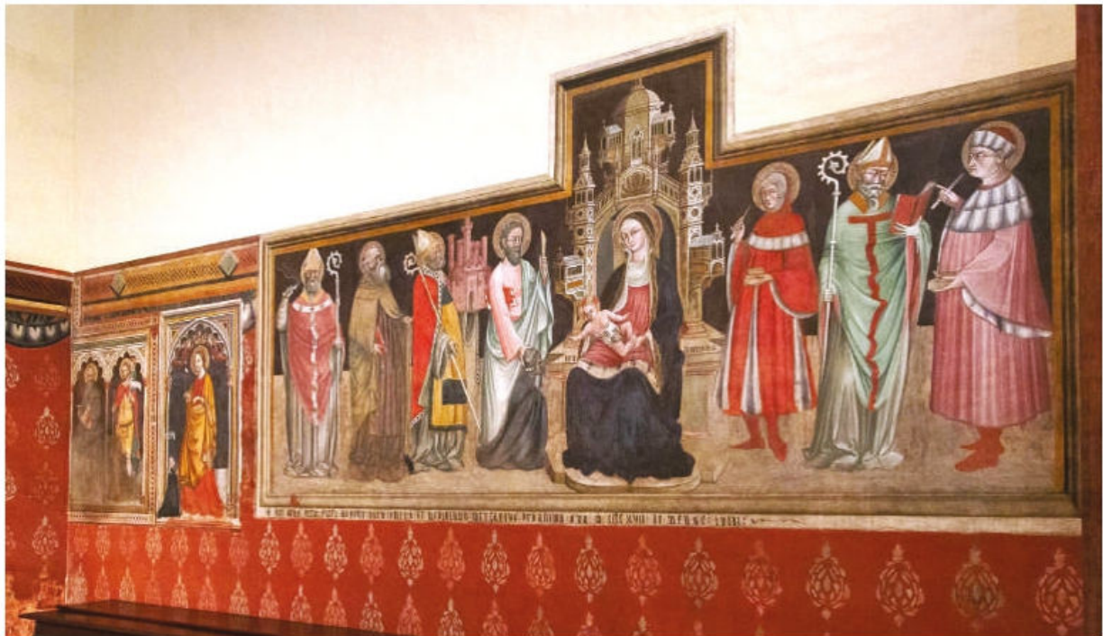
Fig. 3. Bologna, San Petronio, cappella di Santa Brigida, affreschi della parete di destra.