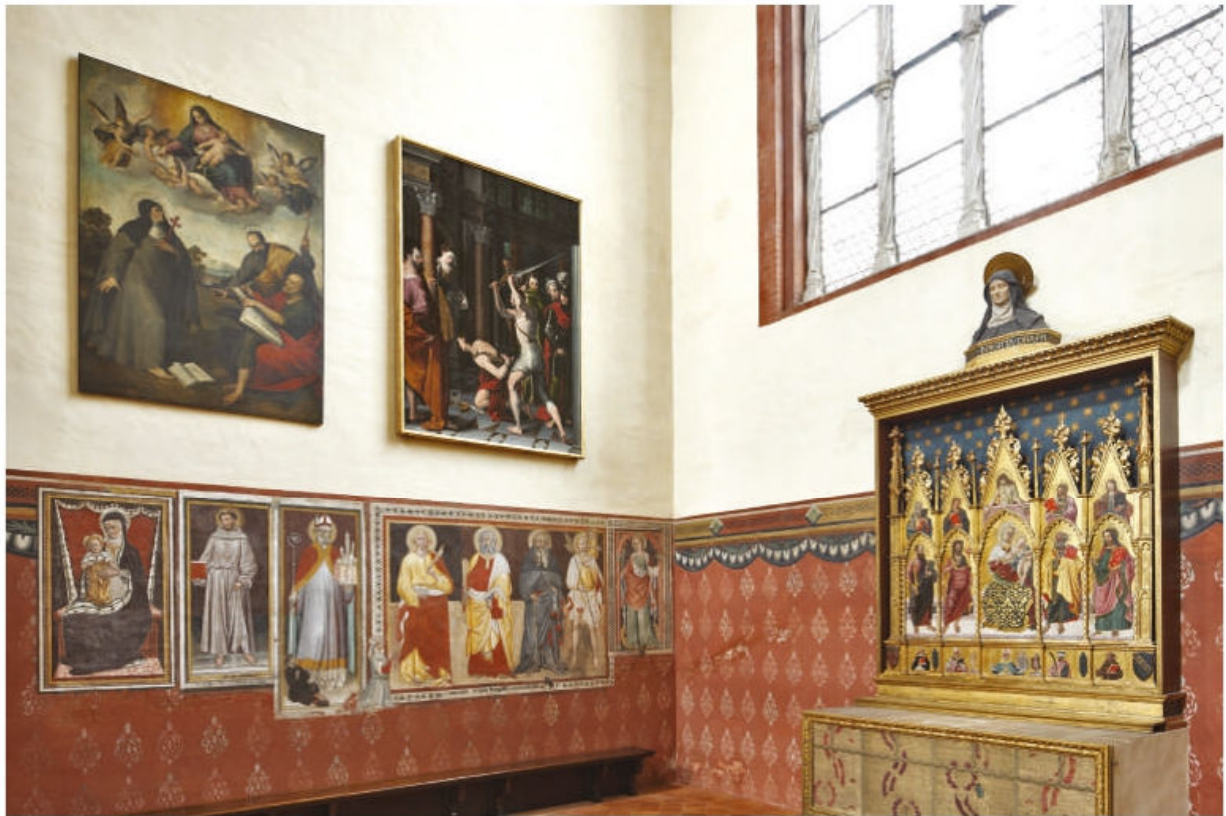
Fig. 1. Bologna, San Petronio, cappella di Santa Brigida, veduta dell'interno, parete di fondo e parete sinistra.