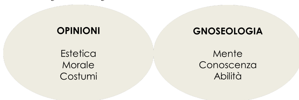
fig. 1. Domini dell'assuefazione.

novembre l'indipendenza che sembrava tenere separati i due filoni di ragionamento viene a cadere, facendo prevalere le necessità del relativismo su quelle della religione cristiana. 10 In altre parole, si tratta del momento in cui viene formalizzato in maniera sempre più netta il relativismo leopardiano e con esso l'impossibilità di presupporre una divinità o un'idea precedente alle cose. Tutto questo accade anche grazie al ruolo decisivo dei pensieri sull'assuefazione, che portano al loro interno continue conferme delle teorie relativistiche. Tali conferme vengono reperite da Leopardi attraverso l'analisi di casi attinenti ad ambiti d'osservazione diversi, accomunati però proprio dalla presenza dell'assuefazione. 11 Cercando di sintetizzare in due grandi insiemi i domini a cui Leopardi fa riferimento per descriverne gli effetti, propongo di distinguere quello relativo alla formazione delle opinioni e quello gnoseologico o, si potrebbe anche dire, cognitivo (cfr. fig. 1).