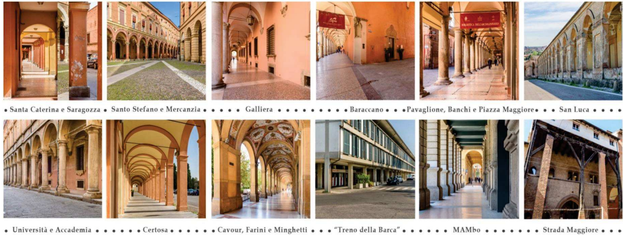
Fig. 2 I Portici di Bologna: i 12 tratti del sito seriale