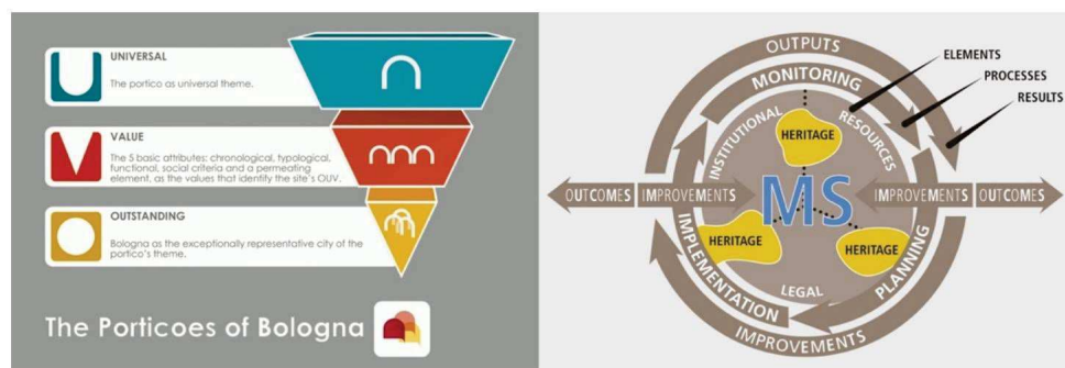
Fig. 3 a) I Portici di Bologna: Outstanding Universal Value; b) Heritage Management System: concept of the World Heritage Centre [© Comune di Bologna; UNESCO et al. , 2013, p. 114]