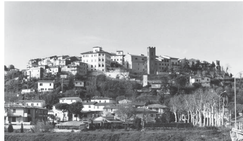
S. Maria a Monte (Pisa)

Il nucleo medievale di S. Maria a Monte aveva assunto la caratteristica struttura ad anelli concentrici, visibile tuttora, entro la prima metà del secolo XIV (Redi 1998 e fig. 1). Oggi in provincia di Pisa, S. Maria fu sottoposta alla giurisdizione del vescovo di Lucca fino al 1327, quando