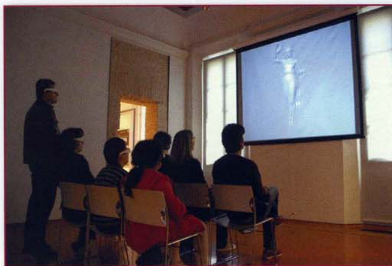
Figura 2 - Teatro Virtuale installato presso i Musei San Domenico in occasione della mostra "Canova. L'ideale classico tra scultura e pittura". L'immagine sullo schermo appare sdoppiata in quanto sono contemporaneamente visibili le due immagini proiettate dell' Ebe .

La sala può contenere circa quindici persone sedute e ciascun utente, prelevando gli occhiali all'ingresso, è autonomo nella fruizione del filmato 3D come in un'installazione video tradizionale.