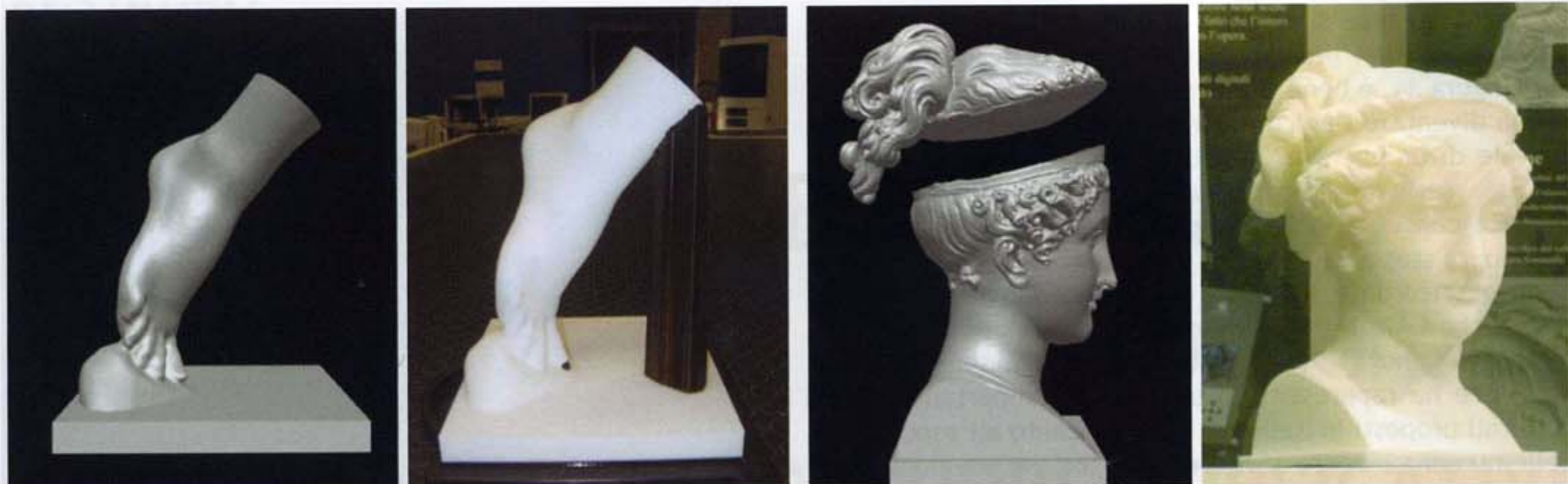
Figura 3 - A sinistra: modello digitale del piede destro e modello fisico prima dell'operazione di lavaggio (è visibile il materiale scuro di supporto depositato durante il processo di stampa). A destra: suddivisione del modello digitale della testa (seguendo l'andamento della fascetta che cinge i capelli) e modello fisico esposto presso i Musei San Domenico.

Nel caso di reperti di elevato valore, la copia realizzata può essere utilizzata per la progettazione dell'imballaggio più idoneo per il trasporto dell'opera nelle condizioni di massima sicurezza. Infine - nel campo del restauro - le copie possono essere utilizzate per testare e validare un intervento conservativo prima di intervenire direttamente sull'opera, oppure possono essere realizzate le parti mancanti o gravemente danneggiate di una scultura.