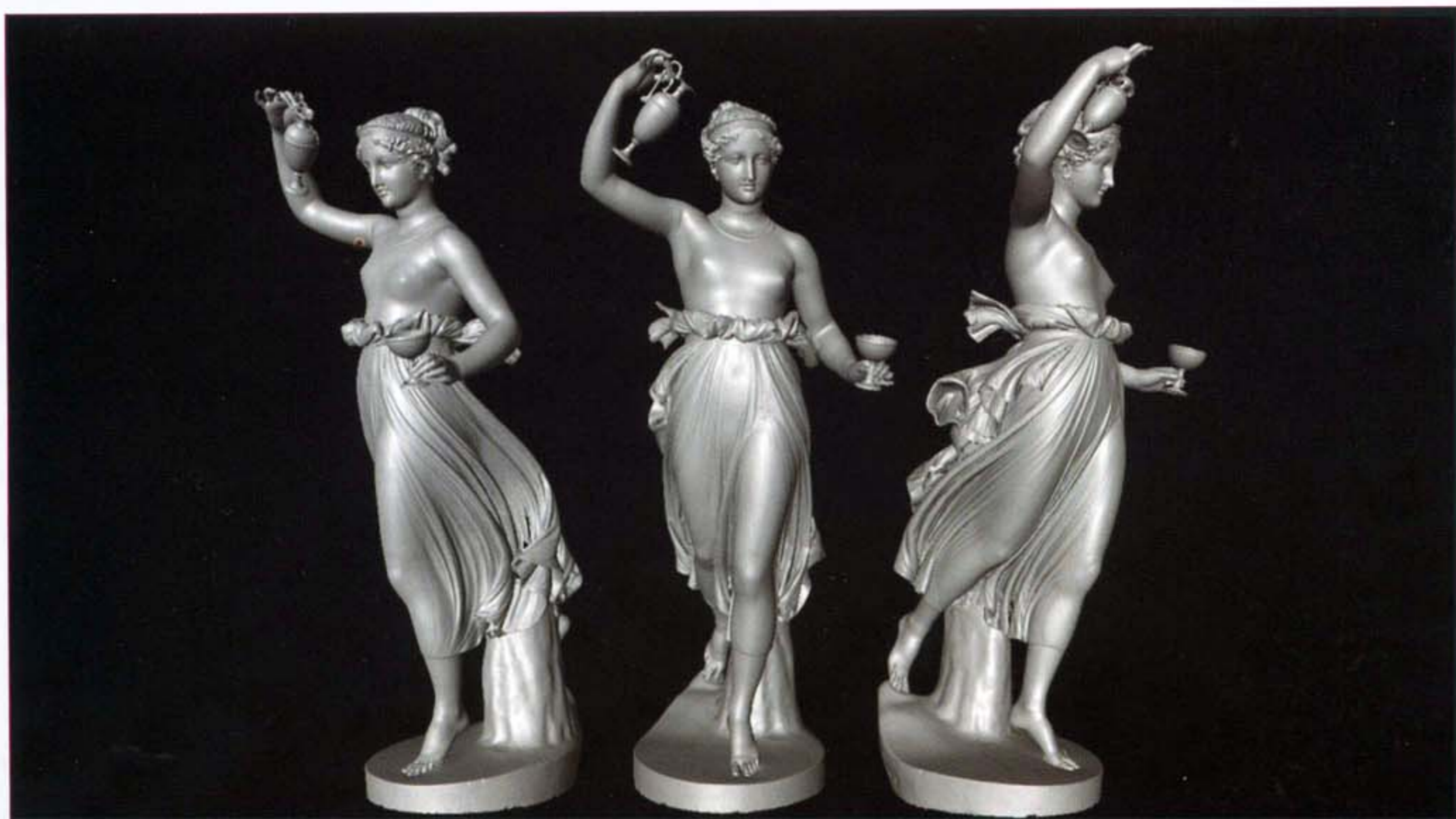
Figura 1 - Modello digitale 3D dell'Ebe di Canova da tre punti di vista.

Nella prima parte dell'articolo - pubblicata sul Numero zero di Archeomatica - ci siamo occupati della fase di rilievo, mentre ora verranno affrontati gli sviluppi applicativi.