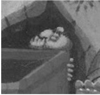
3 | Nerio, dettaglio della Fig. 2.

A mia conoscenza nessun commento, neppure da parte di chi ha analizzato esemplarmente “the letter as a stage set”, ha evidenziato a sufficienza una presenza curiosa, che si affianca alle singolarità di certi soggetti e alle ‘abbreviazioni visive’ di alcuni personaggi che ritroviamo nel corpus del miniatore: dietro il sepolcro aperto, contro il fondo nero del buio della grotta si distingue pur nelle minimali dimensioni una figurina umana, che si