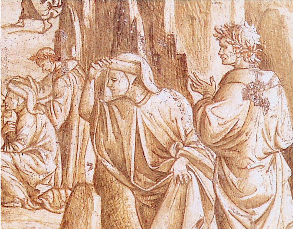
Fig. 9 - Luca Signorelli, L'arrivo dell'angelo nocchiero , Orvieto, duomo, Cappella di San Brizio, zoccolatura, 1502-1504