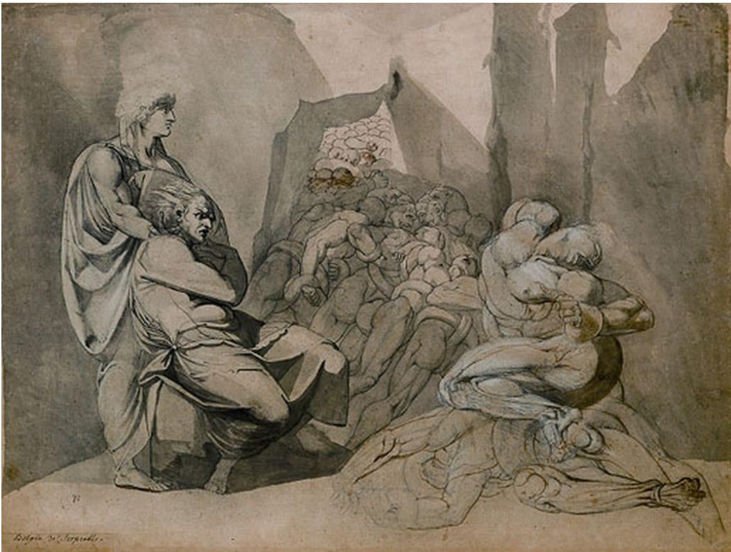
Fig. 12 – Johann Heinrich Füssli, La punizione dei ladri , 1772.