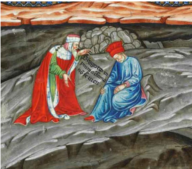
Fig. 5 – Imola, Biblioteca Comunale, ms. 32, f. 19r, secolo XV.