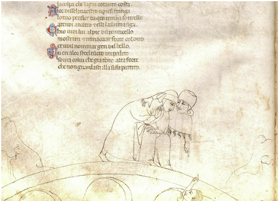
Fig. 2 – Napoli, Biblioteca Nazionale, ms. XIII C. 4, f. 24v, secolo XIV.