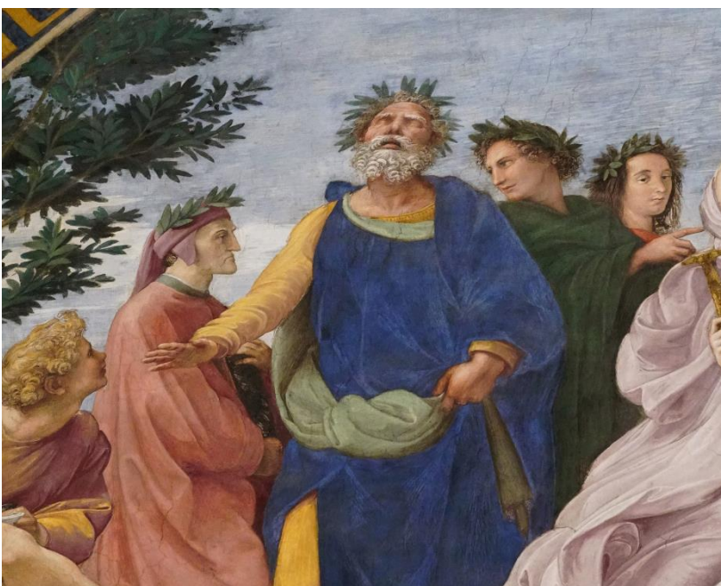
Fig. 8 – Raffaello, Il Parnaso , Musei Vaticani, Stanza della Segnatura , 1508-1511