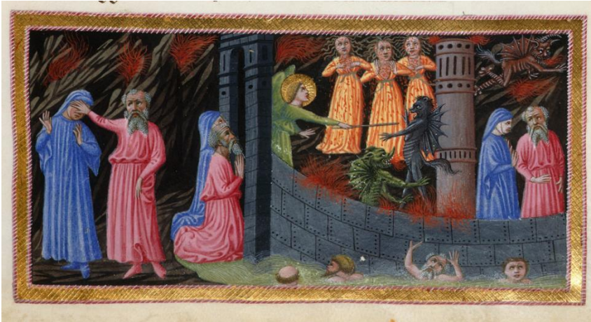
Fig. 6 – Londra, British Library, ms. Yates Thompson 36 , f. 16r.