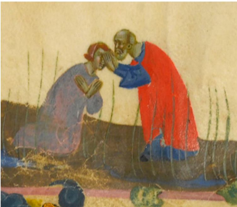
Fig. 3 - Milano, Biblioteca dell'Archivio Storico e Trivulziana, ms. Trivulziano 1080, f. 36r, 1337