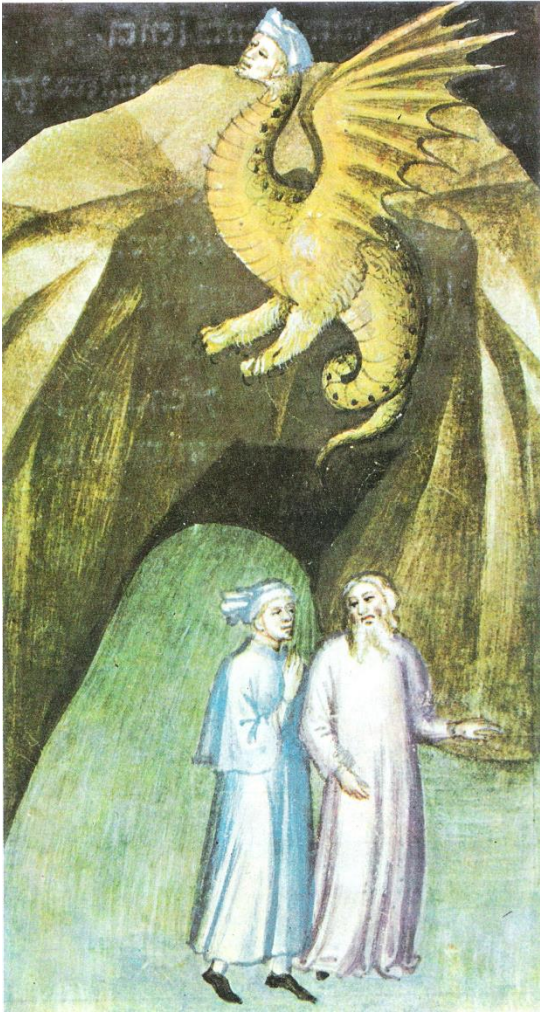
Fig. 4 – Città del Vaticano, Biblioteca Apostolica Vaticana, ms. Vaticano latino 4776 , f. 60r, fine XIV-inizio XV secolo