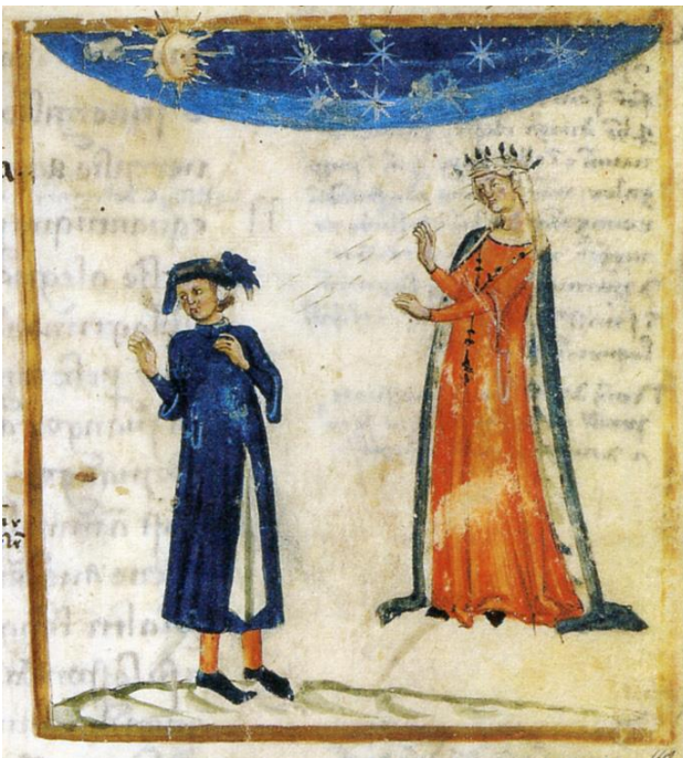
Fig. 1 – Napoli, Biblioteca Oratoriana dei Girolamini di Napoli, ms. CF 2 16 ( Filippino ), f. 155r, secolo XIV.

Nonostante la viva attenzione degli artisti, fra XIX e XX secolo, per gli episodi cruciali, particolarmente commoventi e drammatici della Commedia , non ci è dato di reperire, neppure in questa fase di intensa valorizzazione degli aspetti propriamente sentimentali del poema, quell’immagine che più delle altre risponde ora al vissuto di chi scrive, quella del doloroso, inevitabile, abbandono del padre dolcissimo all’altezza del canto XXX del Purgatorio , di cui in realtà anche nel Trecento rimanevano solo labili tracce. Manca la rappresentazione, per me invece ancora viva e pungente, di quel vuoto improvviso, di quel voltarsi indietro, senza più trovare chi oltre che padre è stato anche maestro: immagine di un addio che non consente parole, che non lascia a chi resta lo spazio del saluto e il tempo per aggiungere, spiegare, capire.