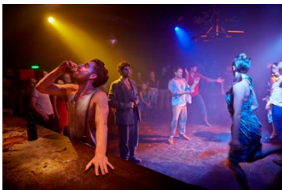
Fig. 4 - Punchdrunk's The Drowned Man , 2013, London.

Durante lo spettacolo gli attori/performers ripetono le loro esibizioni tre volte, in tutto lo spazio, prima di condurre il pubblico verso il gran finale. Per lo spettatore, dunque, non c'è tempo da perdere: deve guadagnarsi il proprio spettacolo. Entra in gioco, a questo punto, la funzione istruzionale contenuta nelle indicazioni ricevute all'inizio della performance, capaci di guidare l'esperienza e fornire alcune “strategie” di partecipazione. Wozniak, ne individua chiaramente due, offerte soprattutto dai tips 2. e 3. La prima, «strategia del pedinamento» ( the Tail ), consiste nel seguire un personaggio in azione negli spazi performativi nel tenta-