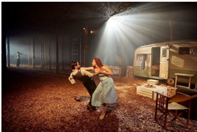
Fig. 1 - Punchdrunk’s The Drowned Man , 2013; London.

La partecipazione del pubblico, in modalità diverse ed eterogenee, è una caratteristica estetica e strutturale integrale di questo tipo di pratiche teatrali, motivata spesso dal desiderio degli artisti e delle compagnie di riformulare la relazione attore-spettatore e di incentivare un coinvolgimento del pubblico apparentemente più attivo 2 , in grado di conferirgli, cioè, una qualche forma di agentività nel contribuire creativamente, a volte persino nella co-creazione della stessa performance. Per favorire tale fruizione co-partecipativa, in questo tipo di spettacoli si ricorre spesso a installazioni (Fig. 1) o ambientazioni ampie ( extensive environments ) in cui il pubblico si muove e può interagire, secondo differenti gradi di partecipazione, con gli attori.