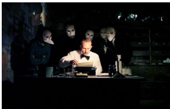
Fig. 2 - Punchdrunk's The Drowned Man , 2013, London.

Ma, prima ancora di capire “come”, è necessario comprendere “dove” muoversi, poiché non esiste un percorso predefinito e ognuno deve decidere da solo il proprio (come raccomanda, tra l'altro, il primo dei tips ). Muovendosi, però, all'interno di un ambiente esteso, con una superficie pari a circa due campi da calcio, perché The Drowned Man può ospitare fino a 600 spettatori per spettacolo e un cast di 40 artisti. I Temple Pictures offrono, infatti, vari scenari all'interno dell'e-