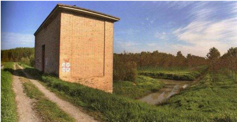
Figure 2. Échantillon du paysage de la bonification près de Novellara (p. 131).