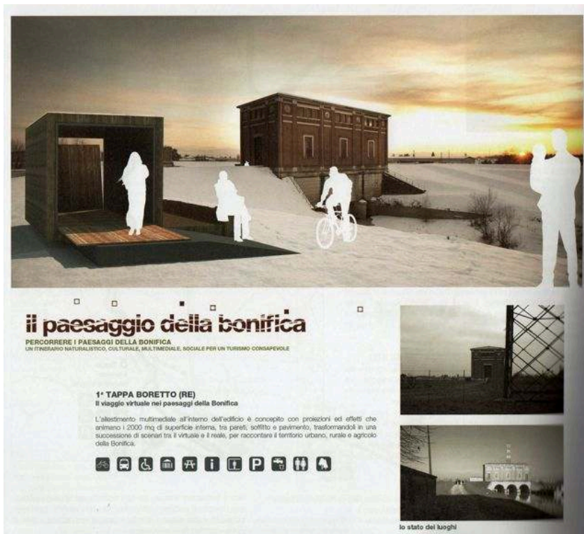
Figure 3. Simulation d'un itinéraire et son équipement (p. 176)