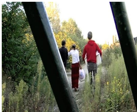
Fig. 4 – Appunti dalla città invisibile. Roma Bologna. A cura di Antonio Genovese (4).

A questi si aggiungono i video per la comunicazione dei risultati scientifici, che possono essere brevi spot caratterizzati da uno stile evocativo e aventi lo scopo di catturare l'attenzione sull'argomento, o video più lunghi che introducano all'argomento di ricerca, ne presentino la complessità e le sfumature, gli obiettivi raggiunti e le domande rimaste aperte.