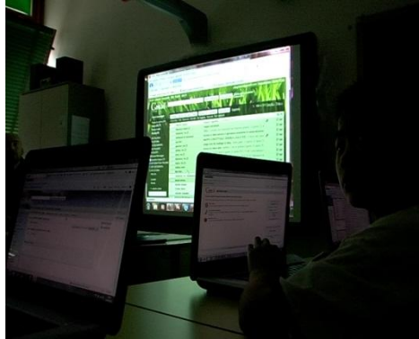
Fig. 6 – CI@ssi 2.0. Scuola e nuove tecnologie in Emilia Romagna (6).

anche arricchendole con spunti e suggestioni personali. Documentare con una telecamera significa prediligere il linguaggio audiovisivo per raccontare una storia e scegliere uno stile narrativo che influenzi la ricerca delle inquadrature, delle immagini, dei commenti sonori.