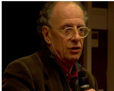
Fig. 3 – Gherardo Colombo, magistrato fino al 2007, fa una lezione su Costituzione e diritti (3).

I video prodotti da MELA utili al lifelong learning sono interviste, narrazioni di storie, documentari, estratti di convegni, lezioni.