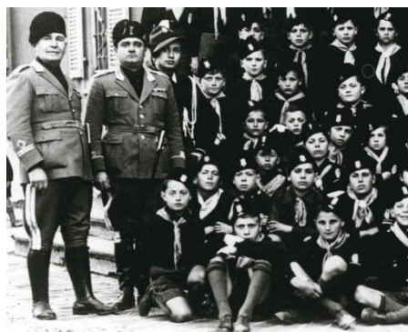
Fig. 2 – La scuola elementare durante il fascismo. Tratto da una ricerca dedicata alla memoria dell'infanzia e della scuola attraverso le testimonianze orali di allievi delle scuole bolognesi. A cura di Mirella D'Ascenzo, Università di Bologna (2).

Non esiste un unico modello per la comunicazione scientifica. Così come esistono vari stili espressivi, per il saggio o per la comunicazione a un convegno, per la rivista specializzata o per il quotidiano, esistono media differenti a servizio della divulgazione, dal libro a tutte le forme di produzione audiovisiva.