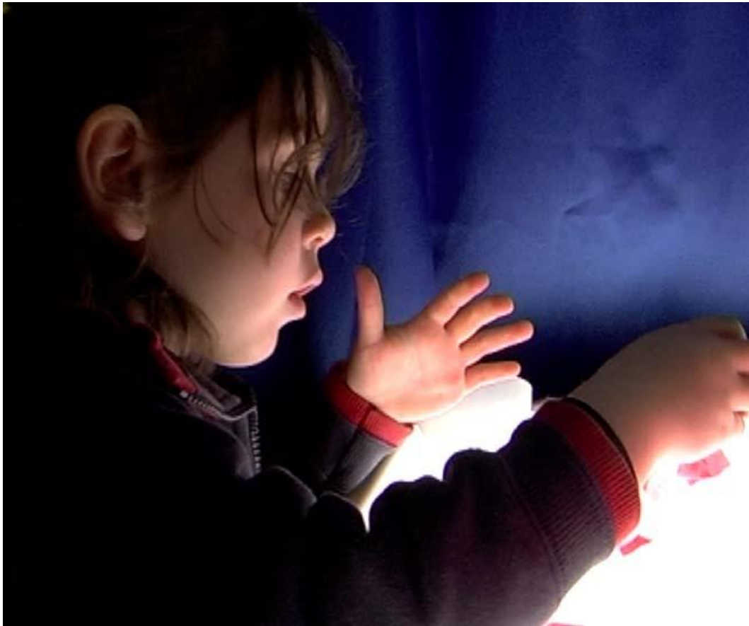
Fig. 5 – aRtelier. Educazione estetica per la prima infanzia. Servizio Educativo Territoriale (S.E.T.) del Quartiere San Vitale, Comune di Bologna (5).