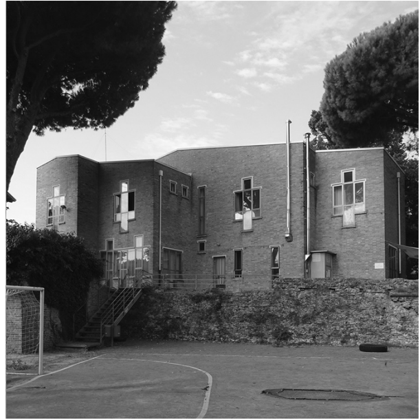
Fig. 6 Rimini, 'La Betulla' di Giancarlo De Carlo.