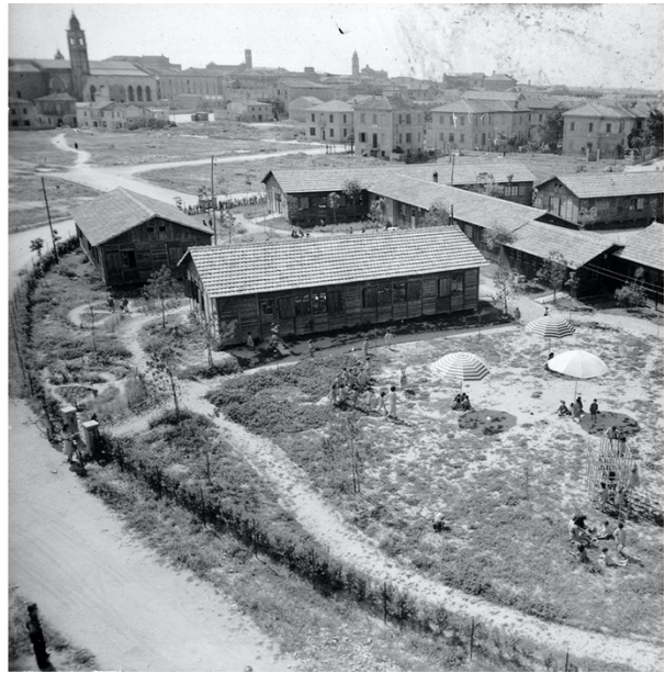
Fig. 4 Vista del CEIS nell'immediato dopoguerra. Sullo sfondo di una Rimini appena ricostruita, il Tempio Malatestiano. Si noti il disegno del giardino.