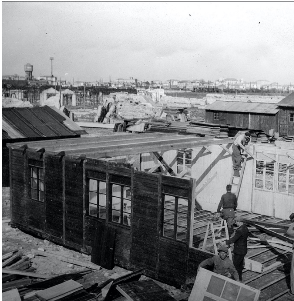
Fig. 3 Il montaggio delle baracche, (foto D. Camera, 1946), © R-AfBG, Fondo CEIS, Camera, racc. I, 3.