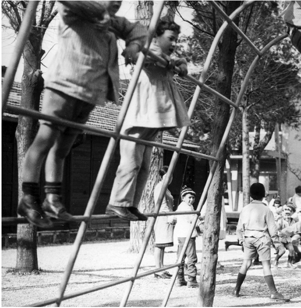
Fig. 5 I bambini giocano con le attrezzature ludiche in tubolare di ferro tipiche dei playground ideati da Aldo van Eyck.