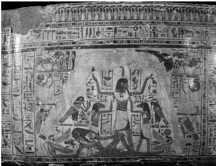
Il dio dell'aria Shu separa il corpo del dio del cielo Nut da quello della terra Geb. Dettaglio del sarcofago di Nespawershepi, capo degli scribi del tempio di Amon, 1000 a.C. circa.