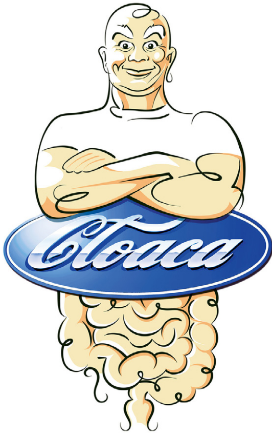
7. Logo di Cloaca New&Improved, 2001 [ https://wimdelvoye.be/work/cloaca/cloaca-new-improved-1/ ].

di Bourke, fino al Disagio della Civiltà (Freud 1905, 496; Freud 1913, 187-188; Freud 1929, 236 n. 1). In questo senso, sia il mito di Medusa sia Cloaca sono una dimostrazione perfetta di cosa significhi trasformare, in una sequenza positivo-negativo-positivo, l'abietto in simbolico.