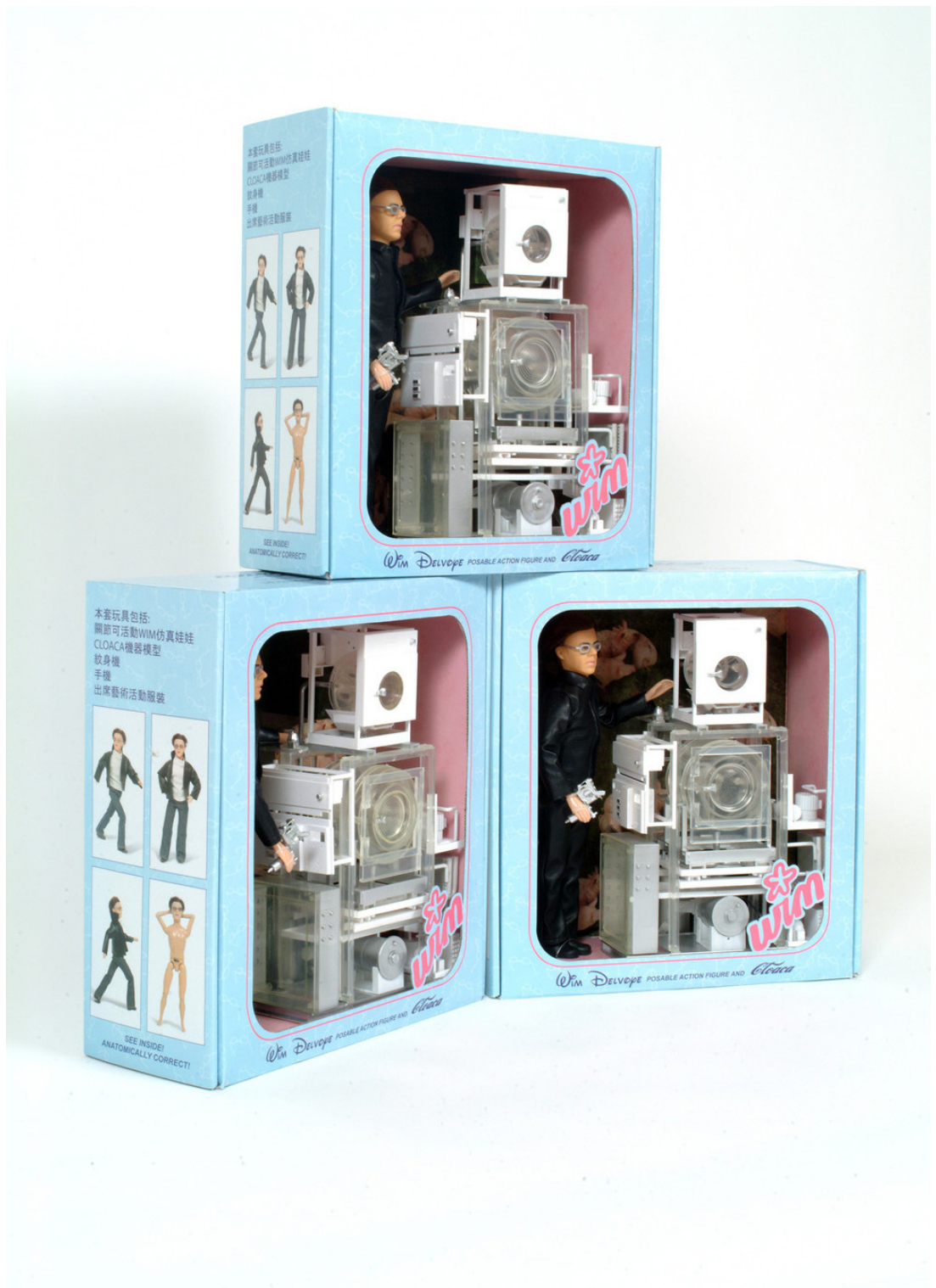
6. Wim Delvoye Action Doll #1, 37 x 34.5 x 14 cm [https://wimdelvoye.be/work/merchandise/].