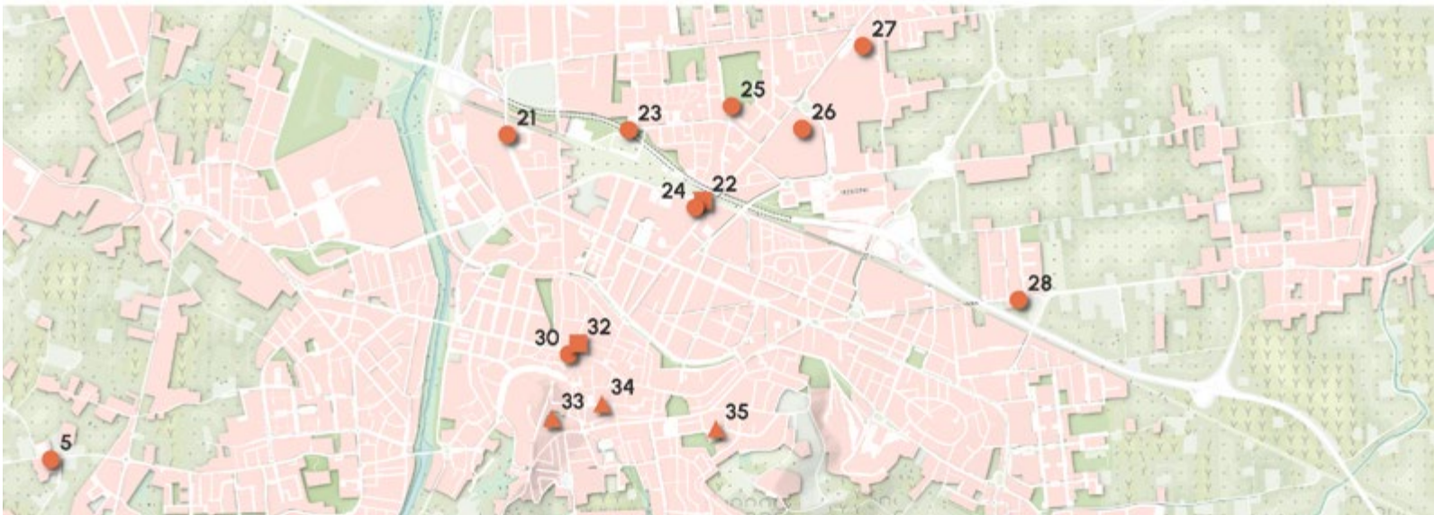
Territorio di Cesena, localizzazione dei rinvenimenti Umbri. Territory of Cesena, location of Umbrian findings.