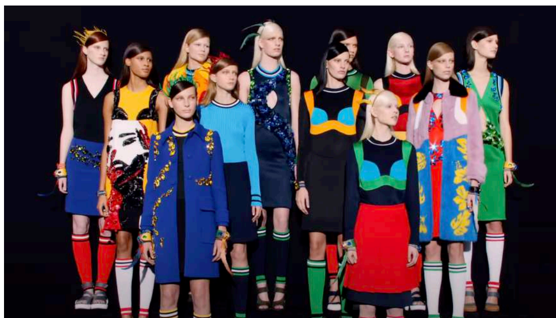
Figura 1: Steven Meisel per Prada, primavera-estate 2014

attraverso l'uso del video; il mezzo si rivela particolarmente efficace nel completare la visione creativa dei tanti designer che, giocoforza o per scelta compiaciuta, se ne avvalgono con spinta sempre maggiore, a partire dal caso emblematico di Alessandro Michele per Gucci, con la preziosa regia di Gus Van Sant per il noto Gucci Fest . Nello stesso frangente di tempo, Moschino, guidato da Jeremy Scott, scende in campo con geniali sfilate virtuali fatte di modelle-marionette o di oculate teatranti, preceduto nel 2008 dalla passerella in stile Lego di Jean-Charles De Castelbajac. Di diversa natura i video di Burberry, molto ben aderenti alla creatività taglia e cucì di Riccardo Tisci.