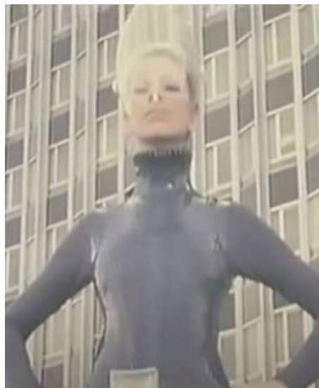
Figura 3: Pierre Cardin, 1970