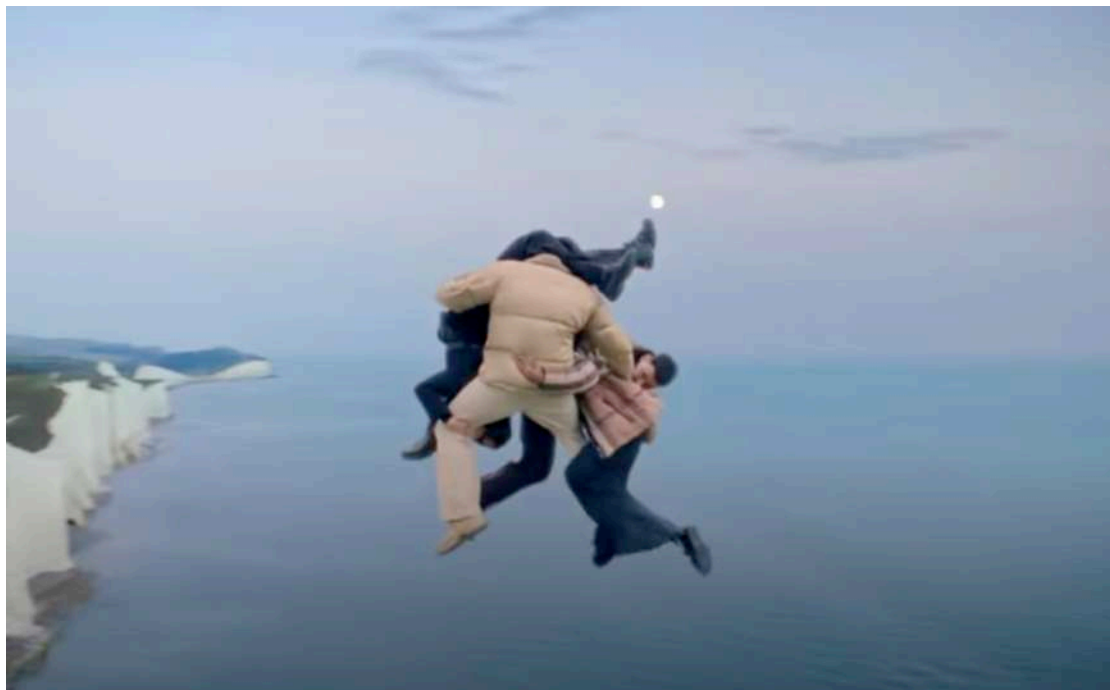
Figura 13: Riccardo Tisci/Megaforce per Burberry, Burberry Open Spaces, 2021