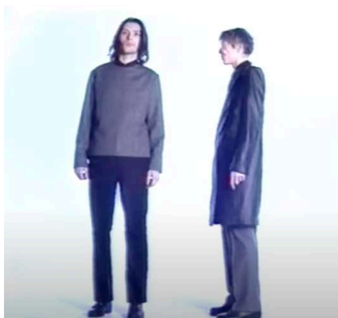
Figura 4: Raf Simons, autunno-inverno 1995-96