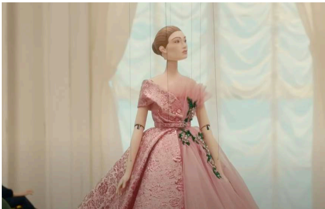
Figura 11: Moschino, No Strings Attached , primavera-estate 2021