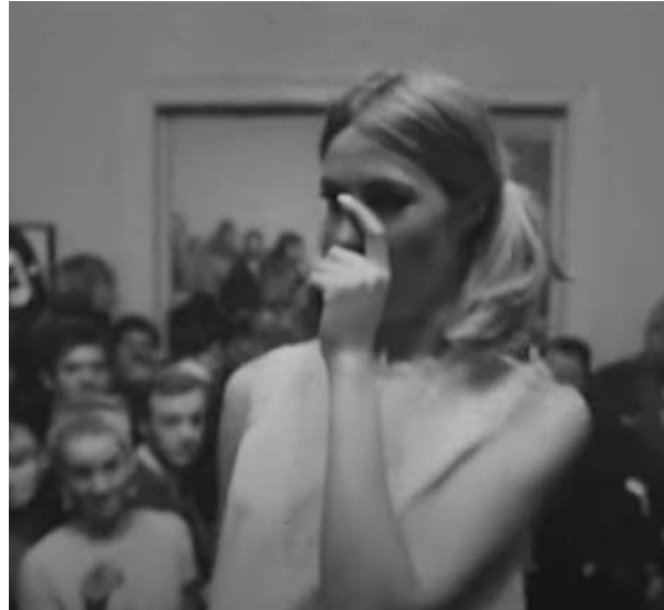
Figura 2: Mary Quant, 1967