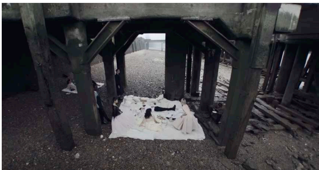
Figura 9: Jonathan Glazer per Alexander McQueen, First Light , primavera-estate 2021