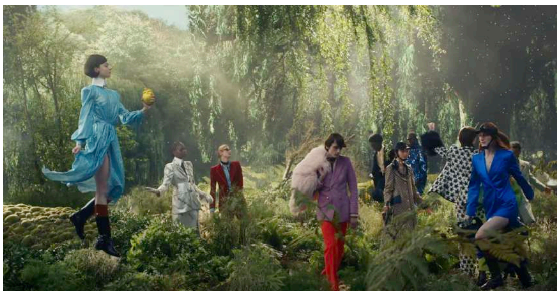
Figura 8: Floria Sigismondi per Gucci, Aria , 2021

Stavolta non c’è dubbio, perfino le riprese hanno dovuto sottostare ai tempi del lockdown, intanto però capi nuovi e capi di altre collezioni non sfilano in una semplice passerella, vestono personaggi ‘altri’