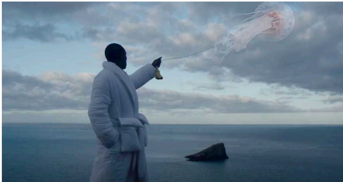
Figura 12: Caleb Femi per Louis Vuitton, autunno-inverno 2021-22