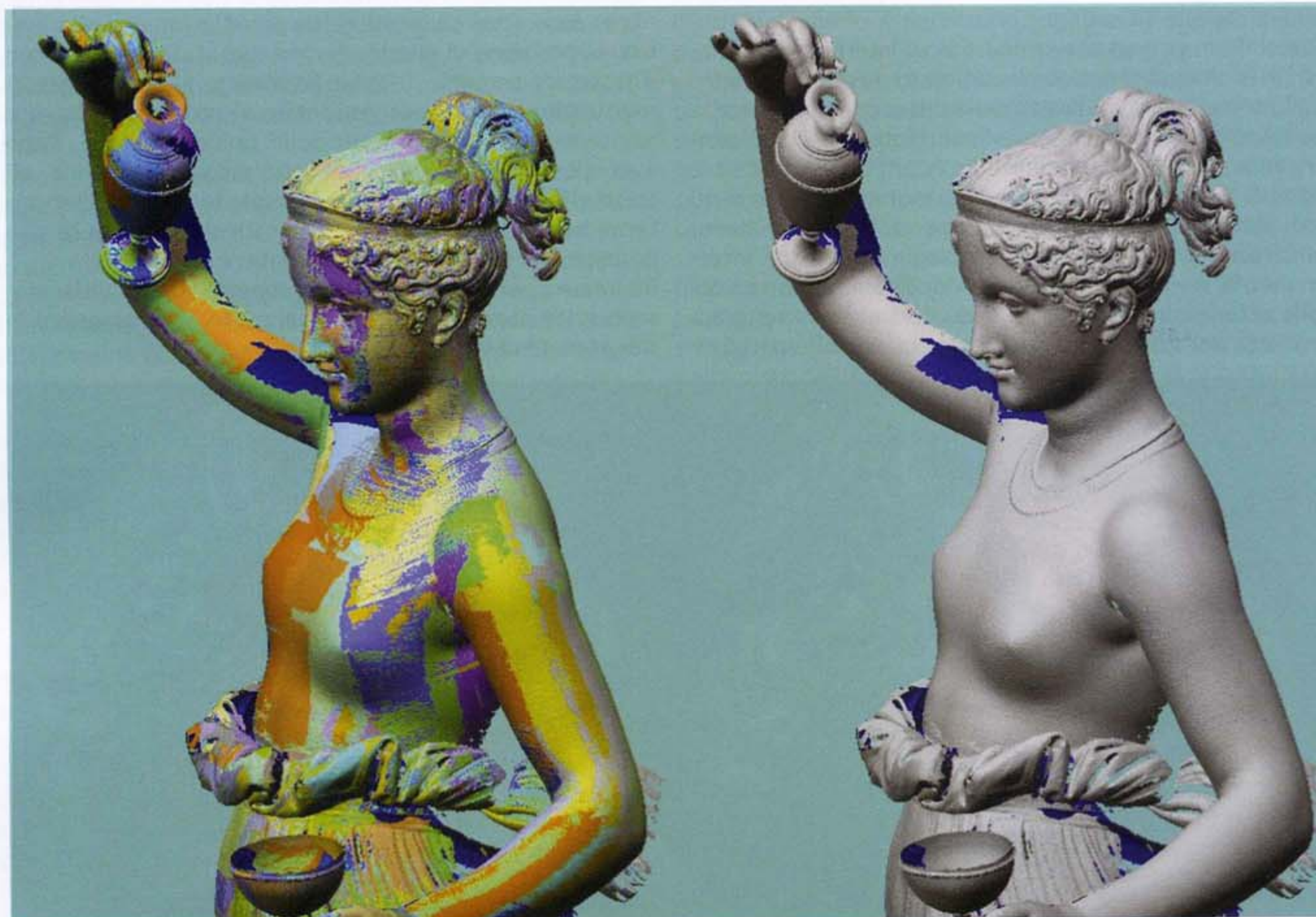
Figura 5 - A sinistra: insieme delle scansioni registrate (visualizzate in colori diversi) ottenute tramite il T-Scan. A destra: modello digitale 3D dell'Ebe ottenuto dalla fusione delle precedenti scansioni.

La mesh a facce triangolari è stata poi ottenuta attraverso un processo di triangolazione che converte le nuvole di punti acquisiti dallo scanner in una superficie continua e ne produce una rappresentazione visualmente più intuitiva. Consi-