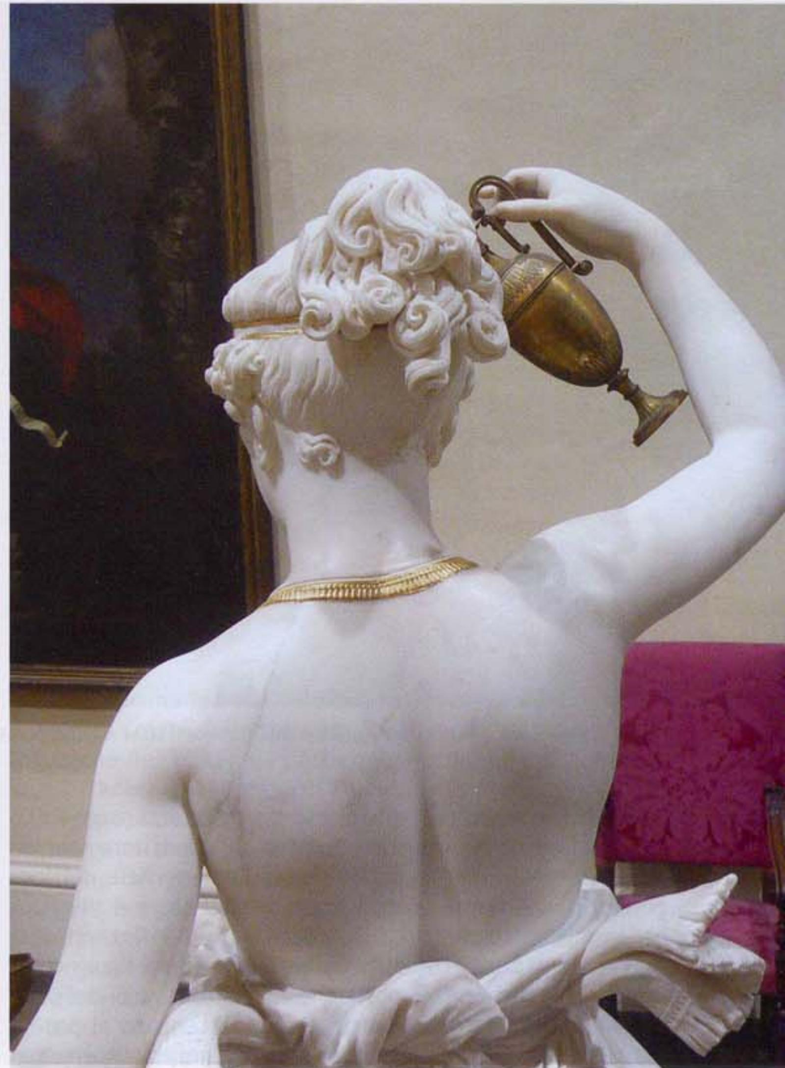
Figura 1 - Ebe forlivese di Canova nella sede della Pinacoteca Civica di Forlì prima del trasferimento nei Musei San Domenico.

per la contessa Veronica Guarini di Forlì, è stata trasferita nel gennaio 2009 ai Musei San Domenico dalla Pinacoteca Civica di Forlì) e la Stele funeraria in memoria di Domenico Manzoni (1817-1818), che non è stato possibile portare in mostra dalla sua originaria collocazione all'interno della Chiesa della Trinità a Forlì.