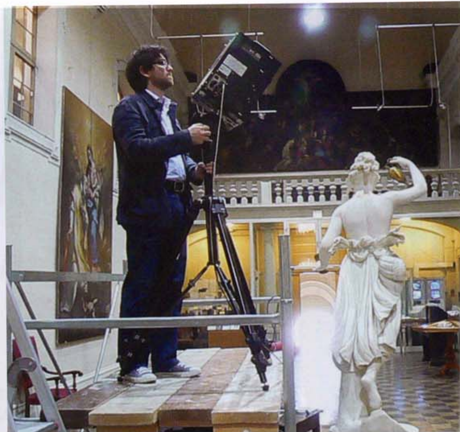
Figura 2. Scansione 3D della testa della statua tramite il laser scanner Konica Minolta Vivid 9i.

li che si muovono dall'alto verso il basso. Il sensore CCD, posto ad una distanza nota rispetto all'emettitore, acquisisce il segnale di ritorno riflesso dalla superficie dell'oggetto. Essendo nota la distanza tra emettitore e ricevitore, la misura degli angoli di emissione e di riflessione del raggio laser permette di ottenere, attraverso il principio della triangolazione, la posizione spaziale (x, y, z) dei punti sulla superficie dell'oggetto che appartengono al profilo di luce prodotto. L'insieme dei profili generati, ottenuti al termine della scansione, restituisce una "nuvola di punti" molto densa, con una risoluzione dell'ordine dei decimi di millimetro, necessaria per la realizzazione del modello tridimensionale.