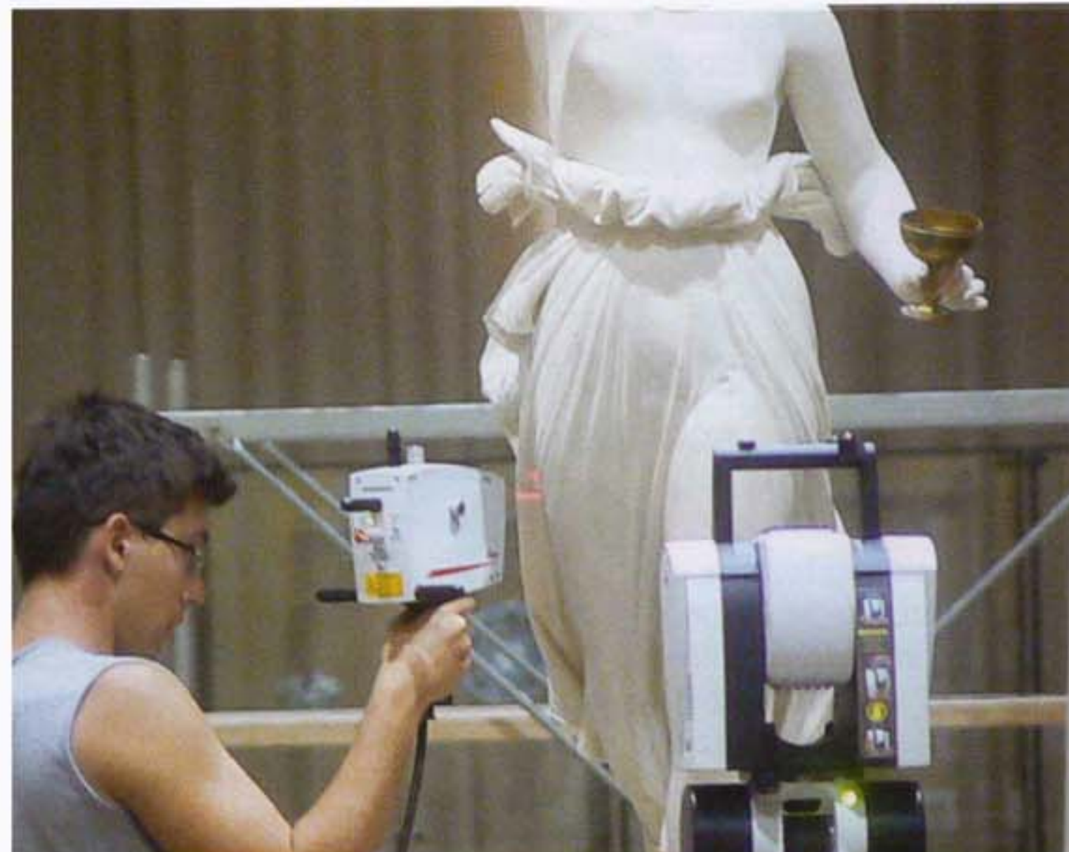
Figura 4 - Scansione 3D della statua tramite il T-Scan del sistema di misura integrato.