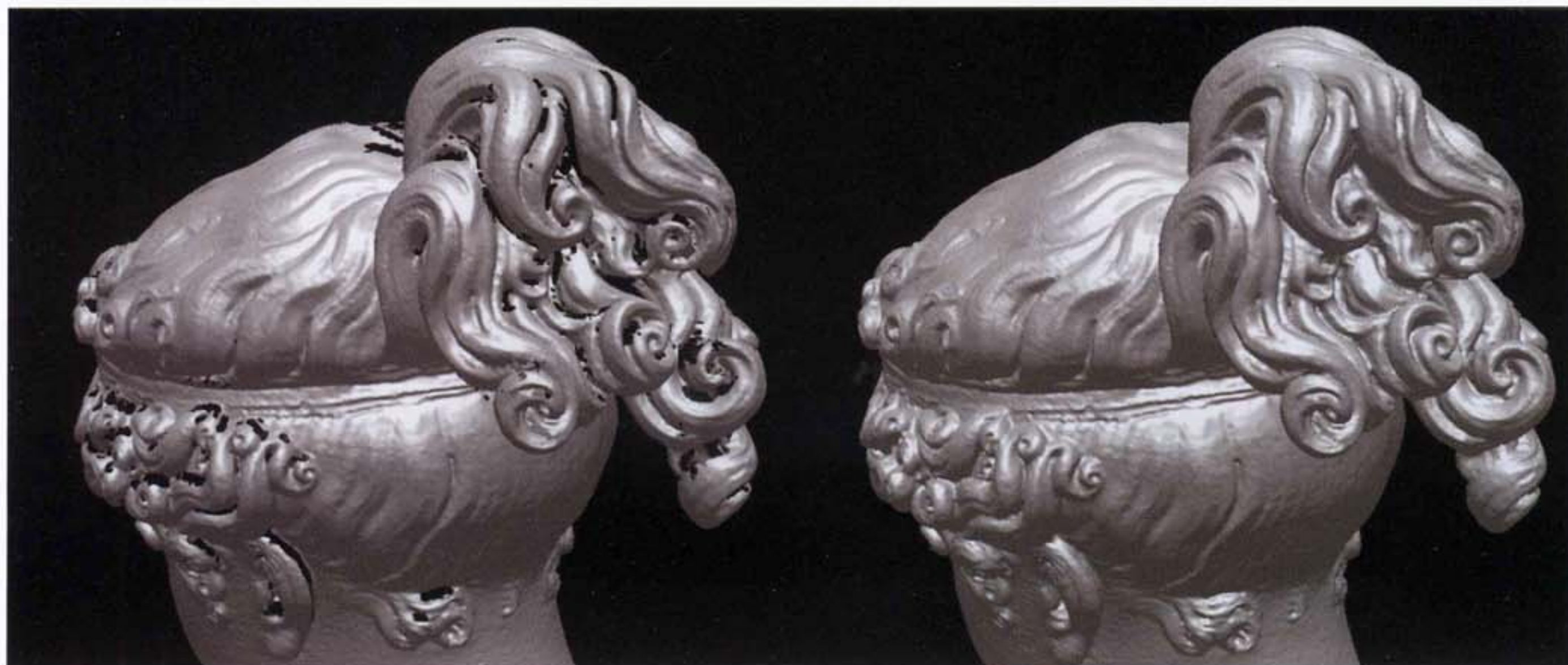
Figura 3 - Confronto tra il modello tridimensionale della testa dell'Ebe prima e dopo la fase di chiusura dei fori.

In totale, per completare la campagna di acquisizione, sono state complessivamente realizzate 1290 scansioni in tre giornate di lavoro.