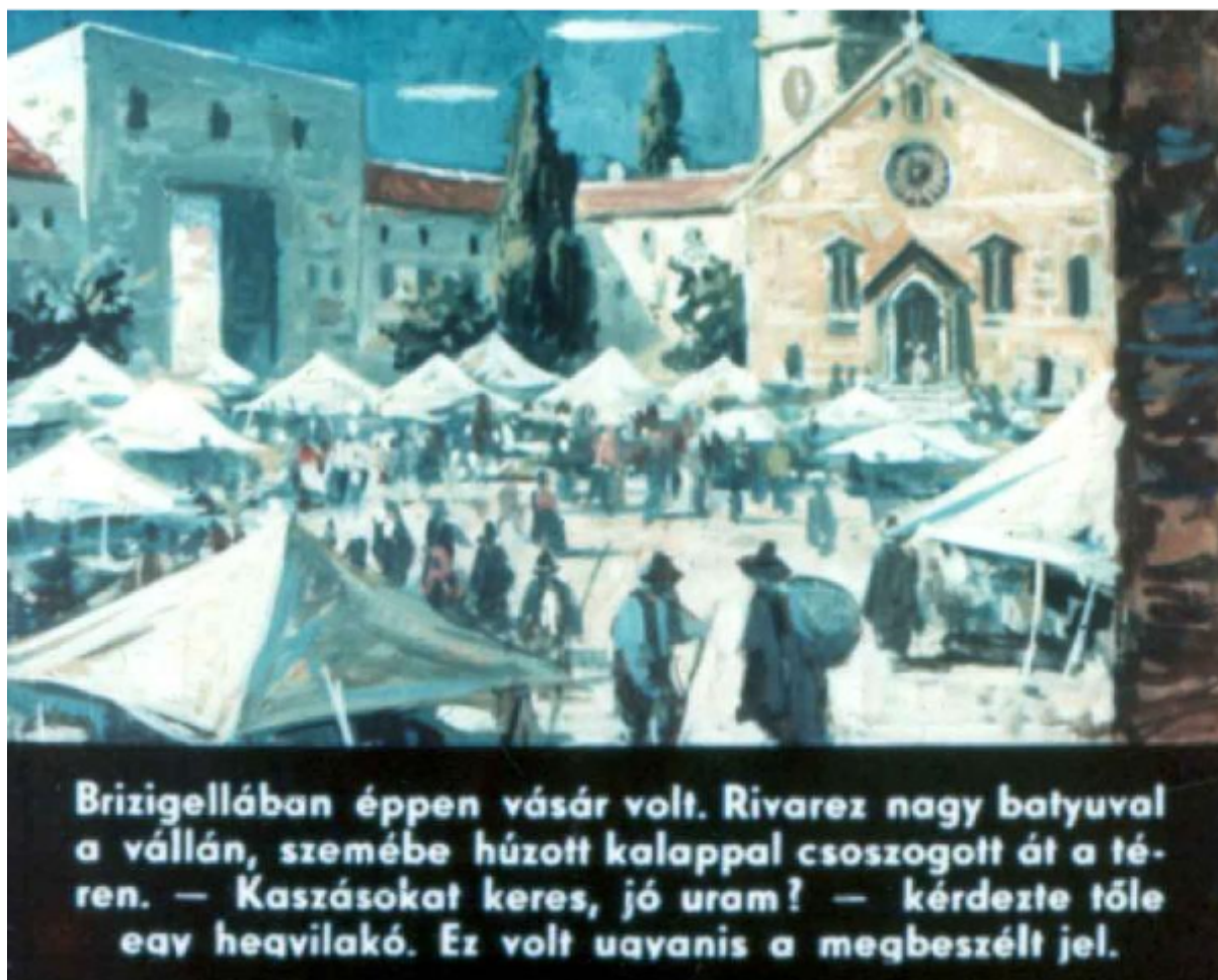
Fig. 3 – La piazza del mercato di Brisighella in una filmina commentata ungherese (“diofilm”) del romanzo, datata 1959