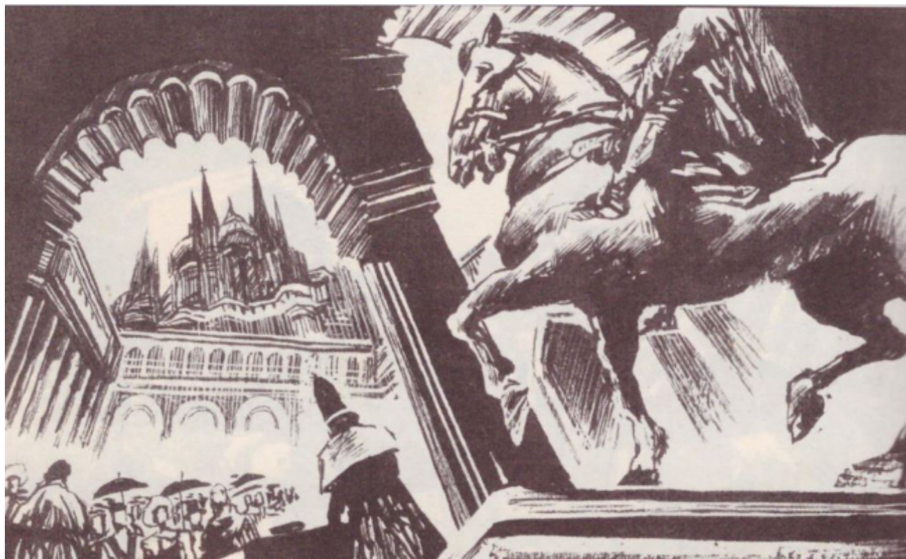
Fig. 4 – La chiesa di Brisighella in un romanzo grafico cinese tratto da The Gadfly edito nel 2001