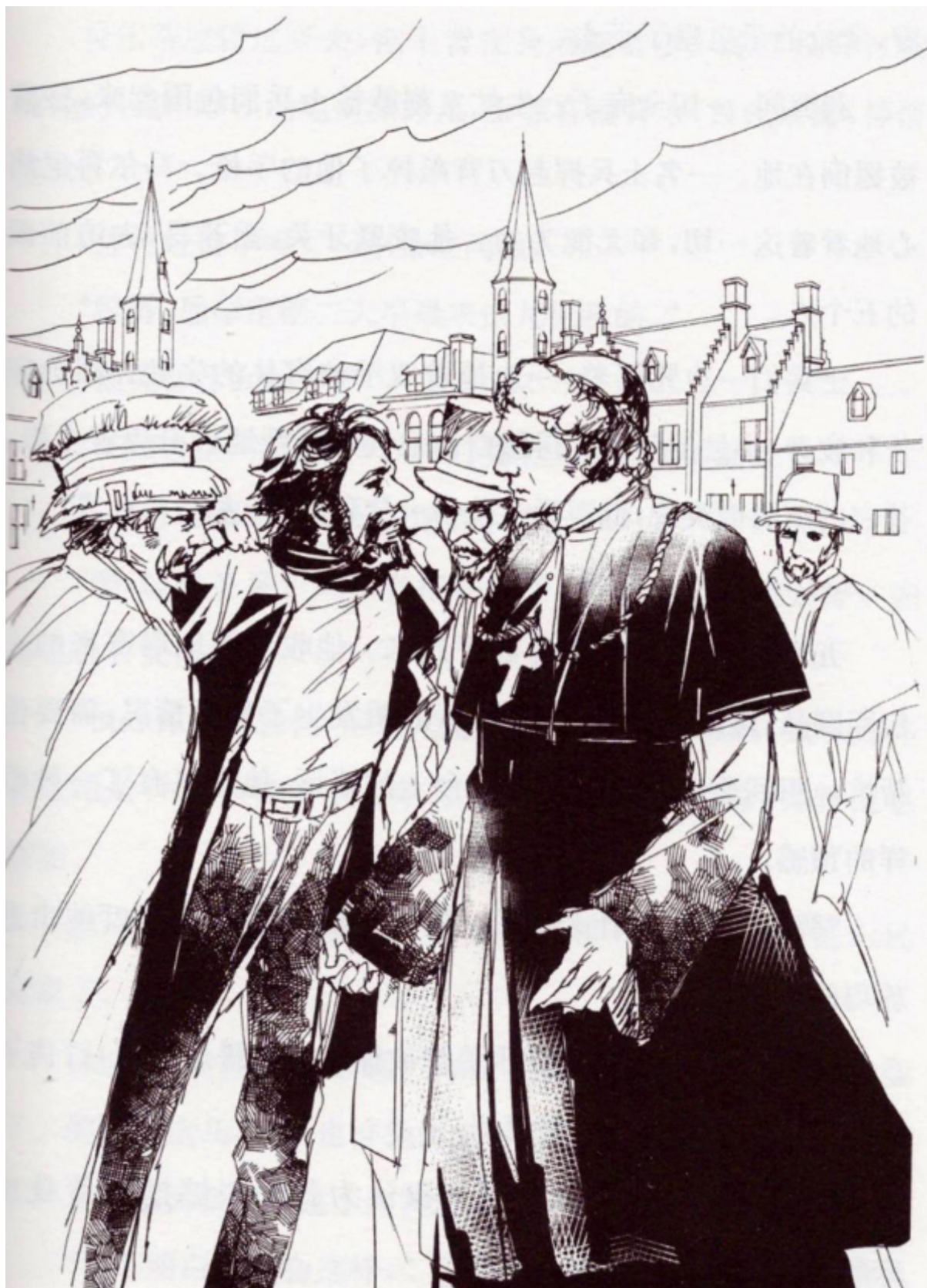
Fig. 5 – Illustrazione relativa all’arresto del Tafano nella piazza di Brisighella, tratta da una recentissima edizione cinese di The Gadfly (2013)

L’ambientazione della trama dell’opera, e specialmente la Romagna (regione meno nota della Toscana al di fuori dell’Italia), è cioè oggi consapevolmente resa in Cina in modo anti-veristico: un mero “fondale romantico” per un intreccio amoroso.