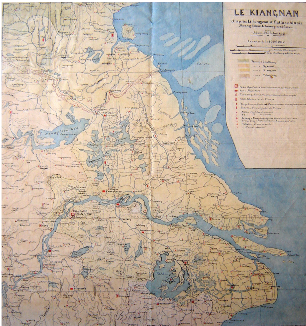
Fig. 1 : Carte manuscrite de Léon Metchnikoff, BGE, Département des Cartes et Plans, tiroir « Extrême Orient »

34 Du point de vue méthodologique, le principe de l'empathie est exprimé très clairement dans les lettres que Reclus adresse à Paul Pelet, écrivain, saint-simonien, politologue et ensuite cartographe et collaborateur d'Hachette (Singaravélou, 2011, p. 241). Reclus entretient avec