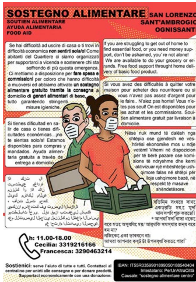
Figura 1. L'avvio della campagna del sostegno alimentare a Firenze, è comunicato anche tramite volantini: per facilitare la riuscita del messaggio, il foglio volante riporta un testo tradotto in sette idiomi.

Una molteplicità di pratiche di mutualismo, autogestite dalle realtà di base, viene loro in aiuto: sostegno alimentare gratuito, ‘spese solidali’ e ‘spese per migranti’, mensa popolare femminista ecc. I punti di raccolta e consegna sono presenti in tutti i quartieri; una carta autoprodotta ne restituisce la dislocazione. 12 Il sostegno alimentare ha ampio riscontro: 565 nuclei familiari coinvolti; 1.159 pacchi consegnati. La raccolta fondi raggiunge i 10.000 euro. 13