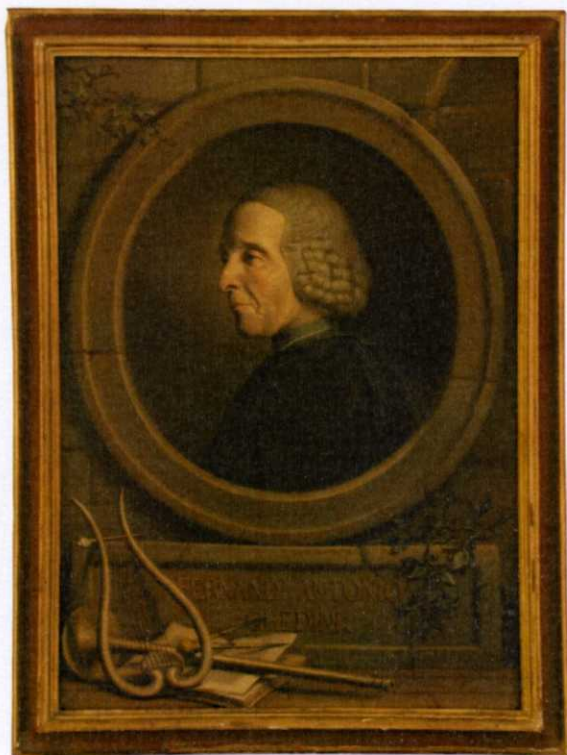
Fig. 6, Jacopo Alessandro Calvi, Ritratto di Ferdinando Antonio Ghedini , Bologna, Museo di Palazzo Poggi – Sistema Museale di Ateneo Alma Mater Studiorum – Università di Bologna.

Entrambe le indicazioni possono tuttavia rivelarsi molto promettenti nel favorire uno sviluppo della riflessione. Il nome di Calvi, che fu allievo e destinatario prescelto da Giampietro Zanotti per i suoi Avvertimenti , potrebbe apparire non inopportuno come autore di questo ritratto, pensato per la sede accademica, da cui Eustachio avrebbe a lungo diffuso il proprio magistero. Attorniato dagli strumenti da lavoro, lo scienziato è colto al tavolino, vicino ai libri, al compasso, ad una sfera armillare; il gesto della mano aperta in atto docente riprende la retorica ormai consolidata per la tipologia ritrattistica dello studioso. Un repertorio appropriato fa dunque da corredo al personaggio, che rispetto all'effigie certamente ascrivibile a Calvi (fig. 2) pare presentarsi con un volto dall'espressione più energica; restano identici invece l'esecuzione controllata, l'assenza di virtuosismi pittorici, il modo di utilizzare la luce, funzionale alla definizione della fisionomia, avendo cura di documentare, come ricorda Giovanni Fantuzzi, l'«indole virtuosa» di Eustachio, «sempre modesto, uniforme nel suo carattere di prudenza, e di onestà», «affabile, e manieroso», tale da meritare la «più intima amicizia di sommi personaggi» 27 .