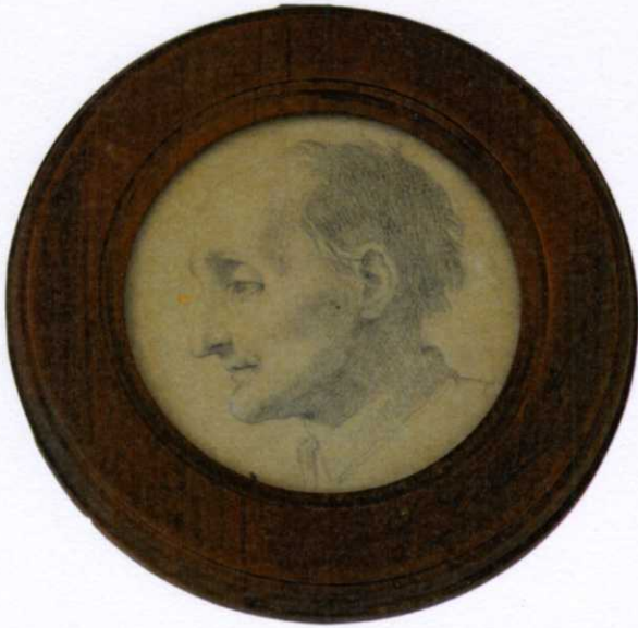
Fig. 4, Jacopo Alessandro Calvi, Ritratto di Eustachio Zanotti , collezione privata.