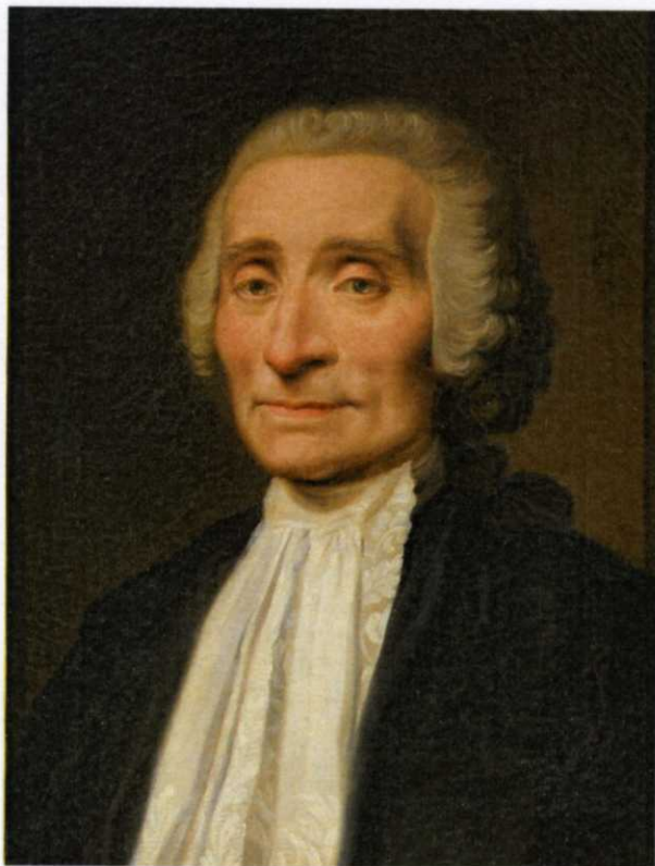
Fig. 2, Jacopo Alessandro Calvi, Ritratto di Eustachio Zanotti , collezione privata.