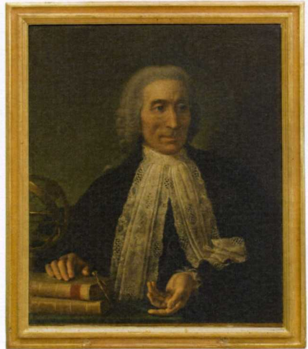
Fig. 5 Jacopo Alessandro Calvi (attr.), Ritratto di Eustachio Zanotti , Bologna, Museo di Palazzo Poggi – Sistema Museale di Ateneo Alma Mater Studiorum – Università di Bologna.

tempie, le guance svuotate, gli occhi infossati nelle orbite. Connotati che si ritrovano in un altro piccolo ritratto di profilo a matita, sinora inedito, che appartiene alla medesima collezione privata ove si conservano i ritratti di familiari e amici del pittore, condividendone dunque la provenienza dall'eredità di Calvi (fig. 4) 23 . Tolta la parrucca, l'anziano Eustachio è visto con analoga naturalezza e sincerità, alla pacatezza della stesura del colore è preferita la regolarità e la sistematicità dei segni a matita, che ora restituiscono, insieme alle forme ossute del viso, la rara lanugine dei capelli e l'aspetto dimesso del quotidiano. Non dunque un ritratto celebrativo, ma davvero soltanto un ricordo privato, che il pittore avverte la necessità di fissare nella memoria. In modo simile, anche il dipinto a olio si dimostra ragionato nella meticolosità delle linee e nella fermezza dell'illuminazione, mossa solo dal raggio di luce che attraversa le iridi dell'astronomo, come se fossero un cristallo (fig. 2).