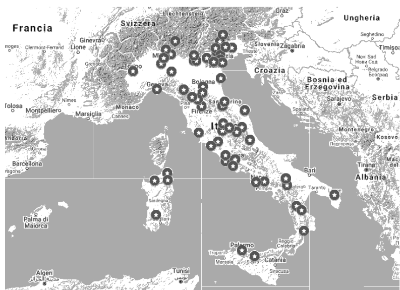
Figura 2. Mappa dei soggetti non rispondenti al questionario

Come mostra la Figura 1, le sedi delle organizzazioni che hanno risposto al questionario sono collocate soprattutto nel Nord Italia (Emilia Romagna, Liguria, Lombardia, Piemonte, Trentino Alto Adige e Veneto) (60.6%), il 16.2% tra Marche e Toscana; il 15.2% tra Abruzzo, Calabria, Campania, Lazio e Puglia e, in misura minore, nelle isole (Sicilia e Sardegna) (8.1%).