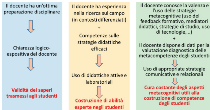
Figura 2. – Rappresentazione di indicatori significativi per la promozione di competenze negli studenti, elaborati dal Gruppo di ricerca.