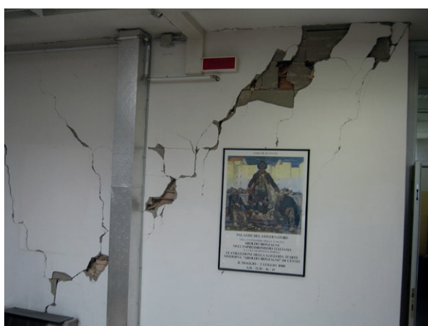
Fig. 3, a destra Galleria d'Arte Moderna "Aroldo Bonzagni", Cento (Fe), dopo il terremoto del maggio del 2012

Dichiarato inagibile immediatamente dopo il sisma, il palazzo e, di conseguenza, la stessa GAM, furono chiusi al pubblico e le opere ivi conservate vennero spostate in un magazzino sicuro posto al di fuori dal centro storico.