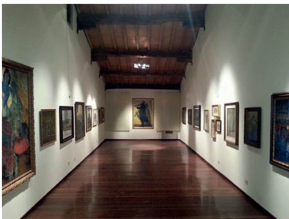
Fig. 6, Galleria d'Arte Moderna "Aroldo Bonzagni", Cento (Fe), Le Guerre di Aroldo Bonzagni, sez. Le maschere della città

Queste, dunque, furono le premesse teoriche portate avanti dal comitato scientifico, ma come realizzarle sul piano pratico? Come organizzare il percorso espositivo delle tre sezioni e quali spazi assegnare a ciascuna di esse? Come esporre il materiale relativo? Insomma, con quale 'veste' bisognava