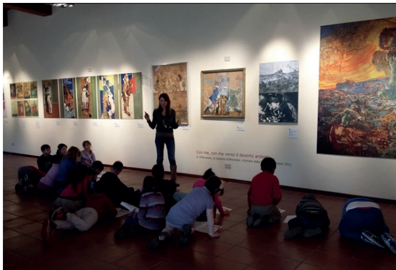
Fig. 9, Laboratorio didattico , Galleria d'Arte Moderna "Aroldo Bonzagni" in occasione della mostra Le Guerre di Aroldo Bonzagni , dicembre 2015-febbraio 2016, Cento (Fe)

confezionare questa mostra? Innanzitutto, si cercò di sfruttare gli spazi restaurati cercando di conciliare le esigenze di un'esposizione temporanea con la possibilità di un sano 'riciclo' nell'immediato futuro, in previsione del nuovo allestimento della collezione permanente. Pertanto, si partì da un lato dotando le varie sale di un nuovo sistema di attaccaglie più funzionale in grado di soddisfare varie esigenze e, dall'altro, rinnovando il comparto vetrine, che fu reso il più possibile 'flessibile' e, parimenti, in grado di funzionare come sistema di divisione interna delle sale in maniera discreta. Sulla stessa linea d'azione, infine, fu pensata anche la ricollocazione dell'importante monumento funebre dedicato all'artista centese realizzato da Adolfo Wildt nel 1919 grazie alla sottoscrizione pubblica promossa da Arturo Toscanini ( fig. 8 ) 12 .