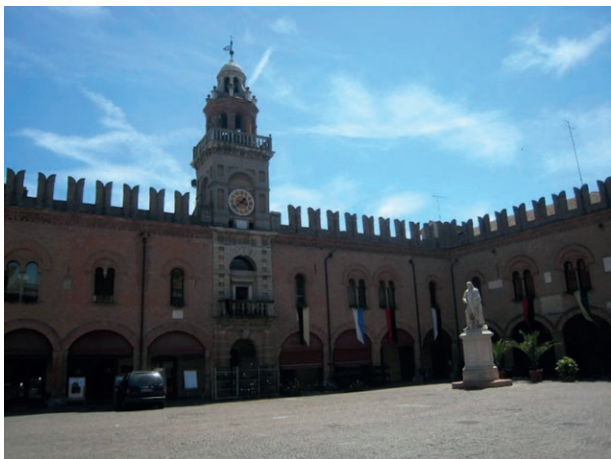
Fig. 1, in alto a sinistra Palazzo del Governatore, Piazza del Guercino Cento (Fe), prima del terremoto