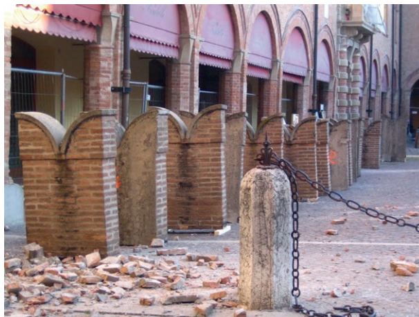
Fig. 2, in alto a destra Palazzo del Governatore, Piazza del Guercino Cento (Fe), dopo il terremoto del maggio del 2012