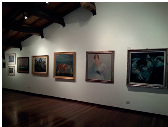
Fig. 7, Galleria d'Arte Moderna "Aroldo Bonzagni", Cento (Fe), Le Guerre di Aroldo Bonzagni, sez. Le maschere della città