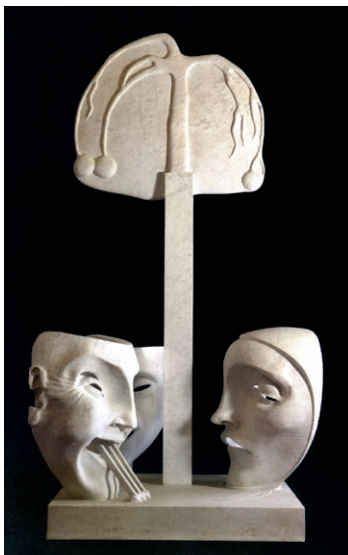
Fig. 8, Adolfo Wildt, Monumento funebre dedicato ad Aroldo Bonzagni , 1919, Galleria d'Arte Moderna "Aroldo Bonzagni", Cento (Fe)