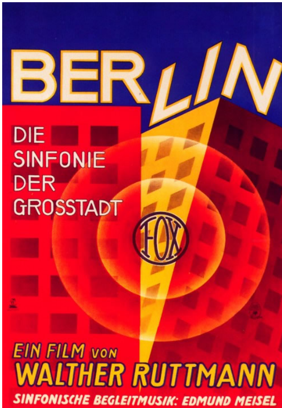
Manifesto del film Berlin Symphonie einer Großstadt , di Walter Ruttmann (1927)

Tra i tanti film che hanno oggetto Berlino negli anni Venti, due si elevano sugli altri lasciando un segno indelebile sull'immagine della città: Berlin Symphonie einer Großstadt (1927), di Walter Ruttmann, e Menschen am Sonntag (1930), di un collettivo formato da giovanissimi registi che avrebbero avuto una gloriosa carriera a Hollywood: i fratelli Kurt e Robert Siodmak, Fred Zinneman, Edgar Ulmer, Billy Wilder. In questi film non vi sono attori professionisti, le immagini sono prese direttamente dalla città e i frammenti della vita urbana vengono poi montati dai registi costruttori-montatori: la vita quotidiana di Berlino è il cuore della rappresentazione.