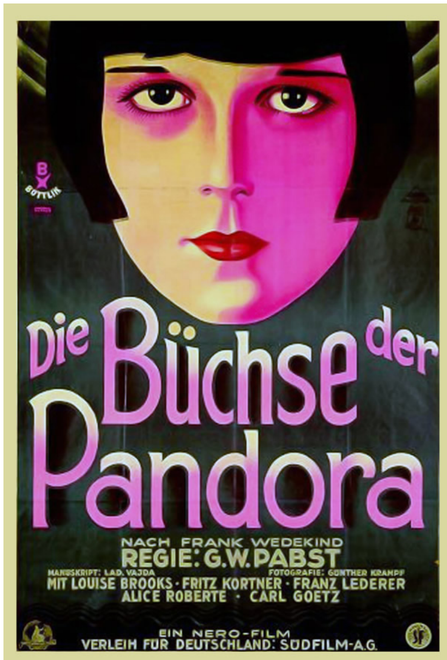
Wilhelm Pabst, Die Büchse von Pandora (1929)

L'ossessione per i minacciosi fantasmi della femminilità che agitano l'immaginario weimariano permette di qualificare l'assassinio della donna come una sorta di difesa, risarcimento, riscatto. La trasposizione filmica di Wedekind nel film di Pabst è emblematica: Louise Brooks, Lulù, cade nelle mani di Jack the Ripper che la uccide, ma dietro di lei ha lasciato una sequela di vittime maschili: mariti, amanti, ammiratori tutti soggiogati dalla sua forza di seduzione che li conduce in un abisso. All'indomani della fine di un terribile conflitto, le nuove, emancipate figure femminili costituiscono una minaccia per l'identità maschile messa già a dura prova dalla sconfitta. Il carnefice poteva così presentarsi paradossalmente come vittima e la sua violenza come riparatrice, con un significativo parallelismo con la rielaborazione dell'esperienza di guerra che il nazismo avrebbe abilmente inscenato e strumentalizzato: il soldato tedesco, tradito dai vertici politici e militari, dai civili imboscati e dalle cospirazioni dell'internazionalismo ebraico, viene infine ferito a morte dalle donne che escono dalla guerra con un rinnovato slancio di emancipazione che ne affranca la sessualità rendendola un'arma da poter usare contro gli uomini.