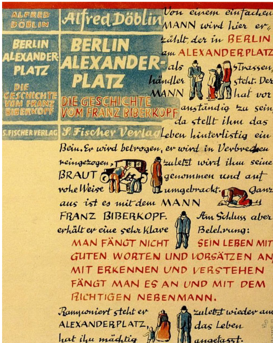
Copertina della prima edizione del libro Berlin Alexanderplatz di Alfred Döblin (1929)

Anche Berlin Alexanderplatz è costruito attraverso il montaggio, esso ci permette di indagare la trasformazione della città come manufatto modernista e il rapporto tra il cambiamento dell'ambiente urbano e la vita psichica degli individui che lo popolano. Così Benjamin ne tratteggiava la novità nella sua recensione: