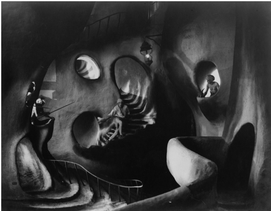
Paul Leni, Luci espressioniste , Berlin, 1924