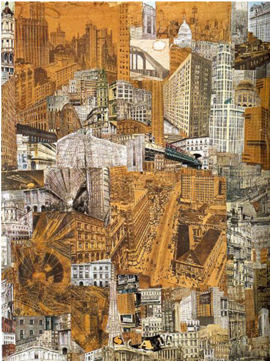
Paul Citroen, Metropolis , 1923, Collage, 76 x 59 cm, Prentenkabinet der Rijksuniversiteit, Leiden, the Netherlands. c 1997 Paul Citroen/ Licensed by VAGA, New York.

La tecnica del montaggio come strumento di decostruzione e ricostruzione degli elementi della realtà deve molto all'esperienza artistica del dadaismo, il principale movimento d'avanguardia nella Berlino del dopoguerra. Per i dadaisti il montaggio assumeva una funzione decostruttiva e nichilista, di sarcastica denuncia della bancarotta del mondo borghese Guglielmino, dei suoi simboli, valori e delle sue forme di rappresentazione. La realtà caleidoscopica e fuori controllo del dopoguerra esplodeva nel nonsense e nell'assenza di confini simbolici: il dadaismo aggrediva la città con la sovversione semiotica, sfidava le istituzioni dell'arte borghese, rinnegava ogni consolidata tradizione, ma soprattutto sbugiardava la fragilità della struttura di potere che presiedeva alle gerarchie del gusto e del giudizio artistico che formavano il capitale economico e simbolico dell'arte.