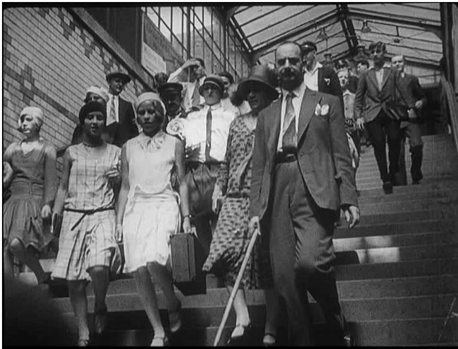
Scena di Menschen am Sonntag (1930), di Kurt e Robert Siodmak, Fred Zinneman, Edgar Ulmer, Billy Wilder