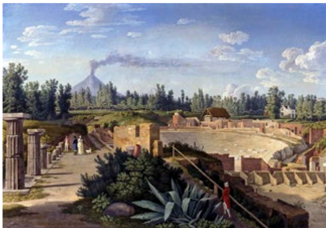
Fig. 1. Jakob Philip Hackert (1737-1807), Gli scavi di Pompei . As paisagens dos arredores de Nápoles no sul da península itálica, são modeladas pela natureza vulcânica e pela intensa obra antrópica. Entre Setecentos e Oitocentos esta região é meta privilegiada da viagem em Itália (Pozzuoli, Baia, o lago de Averno que na mitologia é identificado com a entrada do inferno, Pompéia e Herculano recém-descoberto, o Vesúvio em pleno paroxismo etc.).

A passagem do pitoresco à cientificidade, “do sentimento à análise”, acontece nas primeiras décadas do século XIX graças a Alexander von Humboldt, geógrafo alemão e viajante incansável, que reveste de rigor científico – tipicamente burguês – o conceito de paisagem até então âmbito exclusivo das disciplinas artísticas. A transição do estágio da “contem-