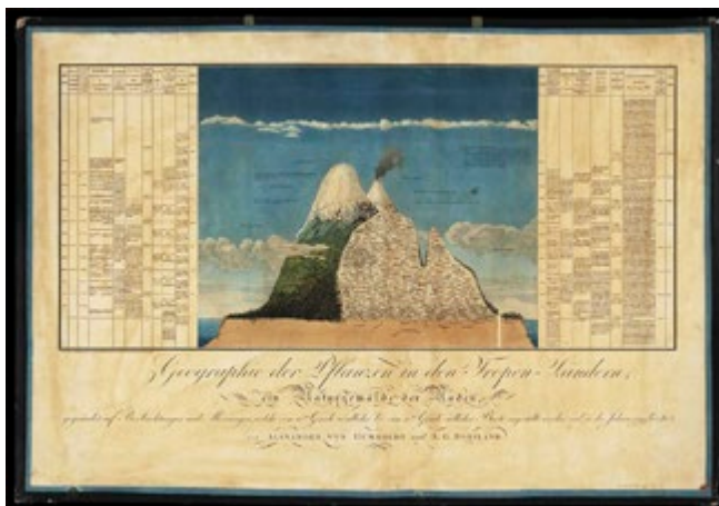
Fig. 2. Alexander von Humboldt, Geographie der Pflanzen in den Tropen-Ländern; ein Naturgemälde der Anden gegründet auf Beobachtungen und Messungen, welche vom 10.ten Grade nördlicher bis 10.ten Grade südlicher Breite angestellt worden sind, in den Jahren 1799 bis 1803, 1856 . As representações sinóticas de seção e de frente das montanhas são uma das invenções do geógrafo alemão. Em cada faixa de altitude são assinaladas as espécies vegetais correspondentes.

Paul Vidal de la Blache, historiador de “mentalidade geográfica” (CLAVAL 1993, 30), exerce sua investigação sobre o cruzamento das relações entre fatores humanos e fatores fisiográficos no interior de ambientes geográficos identitariamente definidos. “ L’histoire d’un peuple est inséparable de la contrée qu’il habite ”, se lê na introdução