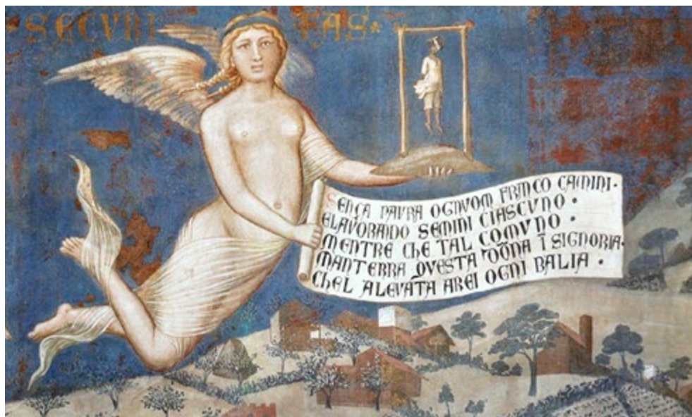
Fig. 8. Ambrogio Lorenzetti, Gli effetti del buon governo , afresco, Palácio público da cidade de Siena, século XIV. Nesta alegoria da boa governação, a cidade prospera dentro dos muros, circundada por seu território agrícola e floresta: o “contado” (do latim comitatus ). A Securitas domina a paisagem da “mezzadria” com a força na mão. Na cartela se lê: «cada qual, livre, caminhe sem medo! e trabalhando a terra, semeie! visto que esta comunidade mantém no governo essa mulher que retirou todo poder aos fora-da-lei».

Esse último elemento – o policultivação – apresenta, do ponto de vista da conservação, o maior grau de fragilidade, e merece por isso uma reflexão mais atenta. A dependência vital do colono da metade da colheita o obriga à produção mais variada no mínimo espaço; no mesmo campo o colono assegura assim para si, pelo menos os elementos da tríade alimentar mediterrânea – pão de trigo, azeite, vinho – conferindo variedade pictórica ao quadro; o trigo é semeado entre fileiras de vinhas enlaçadas à árvore segundo o antigo costume, e unidas a oliveiras (DESPLANQUES 1959). Culturas hortícolas, plantas têxteis, criação de animais de pequeno porte, bosques de carvalhos para o pasto suíno e para o aprovisionamento da lenha, enriquecendo a complexidade ambiental da “mezzadria”.