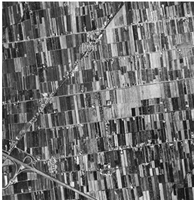
Fig. 3. A divisão em centúrias na área oriental da planície do rio Pó remonta ao século III-II antes de Cristo: trata-se da organização do território agrícola em quadrados de 710 metros de largura. Esta geometria determina ainda hoje a forma da implantação humana. A estrada em diagonal, de origem romana, liga a cidade ao porto marítimo que fica a cerca de 15 km de distância. Fotografia IGM GAI, 1954.

Já os estudos juvenis de Lucio Gambi haviam abordado o tema da individuação e da classificação de ‘tipos’ geográficos, manifestando precocemente l’esprit de géométrie que caracterizou toda sua produção. No livro dedicado à Casa rural na Romanha (GAMBI 1950) o jovem geógrafo demonstra ser um válido intérprete das localidades humanas, descritas segundo categorias não imunes à lição dos Tipos geográficos de Olinto Marinelli (1921).