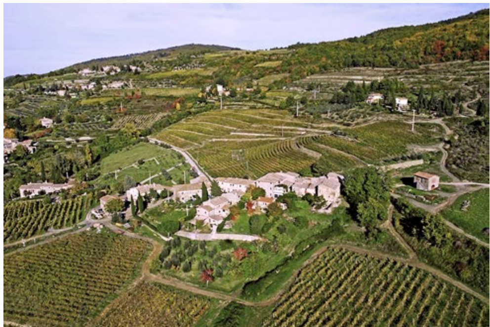
Fig. 9. O resultado do restauro paisagístico de socalcos para o cultivo da vinha a Làmole, Greve in Chianti (Florença).

A recuperação ambiental dos socalcos históricos na região do Chianti está delineada no manual Il Chianti fiorentino: un progetto per la tutela del paesaggio e é praticada no bairro de Làmole. Ambas as obras – o guia e a recuperação – são de autoria do urbanista Paolo Baldeschi; a recuperação da encosta em socalcos teve aliás importantes reflexos na qualidade dos vinhos que ali foram produzidos sancionando de fato a coincidência entre beleza da paisagem e gastronomia de qualidade (BALDESCHI 2000). À área do Chianti é dedicado o Guia para a recuperação da arquitetura rural entendida como elemento constitutivo das paisagens regionais (AGOSTINI 2011). Ambos os guias são virados para a recuperação do savoir-faire artesanal e para a divulgação do conhecimento como instrumento para a manutenção e para a reprodução evolutiva do património. Os mesmos constituem um modelo inovador de regulamentação construtiva e agronômico-territorial, passível de ser acolhido com vantagem pelos instrumentos urbanísticos (VANNETIELLO 2009, 122).