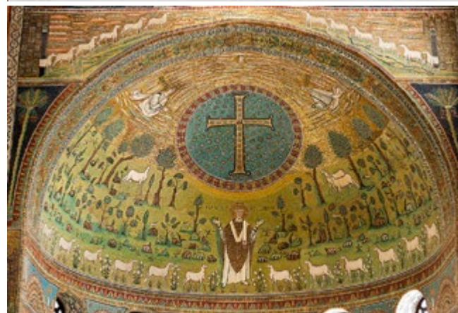
Fig. 5. O mosaico na absida da Basílica de Santo Apolinário em Classe, Ravena, século VI depois de Cristo: a paisagem alto-medieval do saltus , território largamente inculto e pantanoso, com prevalência do pastoreio em detrimento da atividade agrícola. O império romano de ocidente ruiu, e os efeitos se repercutem na gestão de território, as águas invadem as terras saneadas, as cidades recuam.