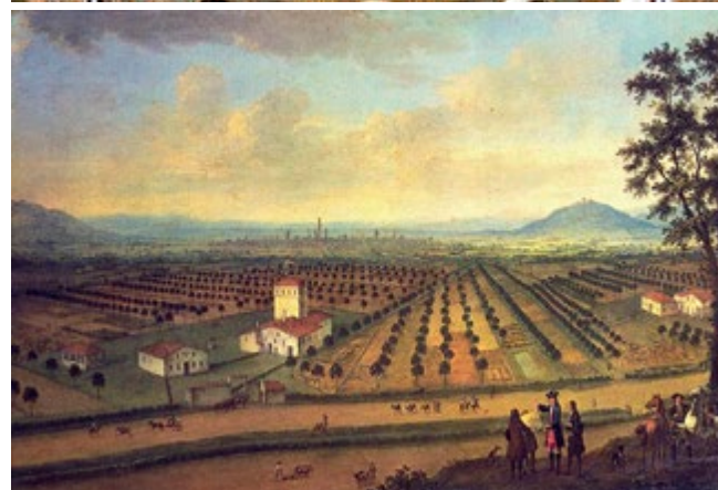
Fig. 6. Os arredores de Bolonha (XVII século). A “alberata” era a paisagem típica das grandes planícies italianas. Campos de cereais ritmados por fileiras de árvores (choupos, bordos, etc.) “casadas” à vinha. A vinha, planta trepadeira, não cresce em altura automaticamente: por isso a sabedoria camponesa colocou a seu lado a árvore, cujas folhas eram alimento para os animais de trabalho. Uma técnica antiga, hoje suplantada pela monocultura industrial.