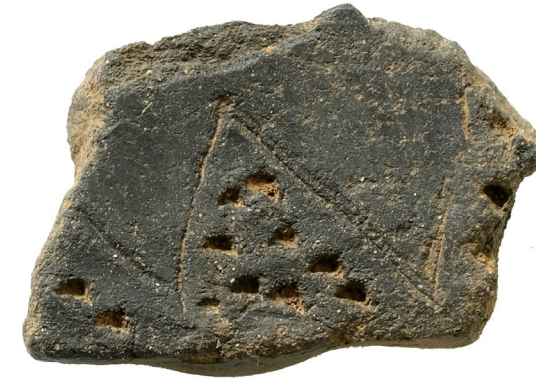
Fig. 3 - Grotta della Lea (Nardò, LE): frammento ad impasto dell'età del Bronzo decorato.

Grotta della Lea (Nardò, LE): decorated Bronze Age impasto pottery.