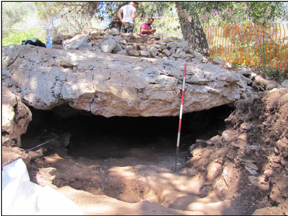
Fig. 1 -Grotta della Lea (Nardò, LE): ingresso ed area interessata dallo scavo archeologico del Luglio 2020.

Grotta della Lea (Nardò, LE): entrance to the cave and area excavated in July 2020.