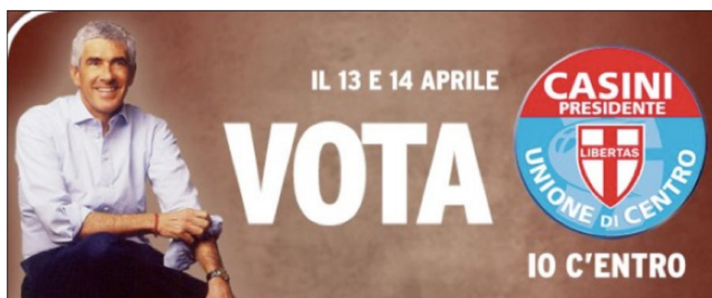
Fig. 4. Casini nel 2008.

In Italia cominciò Pier Ferdinando Casini nella campagna per le politiche del 2008. Lo slogan «Io c'entro» giocava sulla centralità della proposta di Casini, che stava fra la destra del Pdl e la sinistra del Pd. Ma un visual tutto focalizzato sul corpo del leader, e privo di altri contenuti oltre al simbolo del partito, faceva del candidato uno che mette al «centro» sé stesso e niente più (Fig. 4).