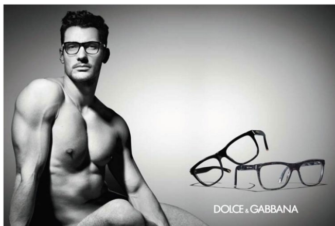
Fig. 2. D&G occhiali, 2011.

In pubblicità, questa organizzazione visiva – spesso ripresa anche negli spot – serve a esaltare un corpo bello, scolpito, perfetto, trasferendo la sua desiderabilità al marchio cui è associato. Ebbene, questo format è stato talmente usato e ripetuto, nella comunicazione commerciale degli ultimi vent'anni, da essere ormai un luogo comune visivo .