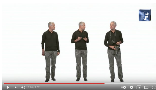
Fig.11. Formigoni in un video del 2011.

In Italia la ripetizione del format commerciale è stata più ossessiva che altrove. Un caso ai limiti della caricatura fu la campagna con cui nel 2011 Roberto Formigoni, allora presidente della Lombardia, presentò il suo sito Internet. In alcuni video online Formigoni, ritagliato su sfondo bianco, o camminava avanti e indietro fermandosi solo per guardare in camera e riscuotere applausi da un pubblico immaginario, o ballava indossando una grossa cuffia audio, o addirittura si moltiplicava per tre copie di sé, che dialogavano fra loro: un'autoreferenzialità triplicata, per cui fu messo alla berlina su Internet e in tv (Fig. 11) 1 .