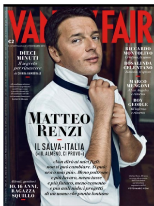
Fig. 12. Renzi su Vanity Fair , 2013.

Uno degli esempi più rappresentativi è il servizio fotografico con cui, nel novembre 2013, Vanity Fair accompagnò una lunga intervista a Renzi, che allora correva per la segreteria del Pd alle primarie del dicembre 2013: pose affettate, bianco e nero patinato, sguardo tenebroso (Fig. 12), tutto concorrevva a distrarre dal merito dell'intervista, confermando l'impressione di un leader che pensava più all'apparenza (il corpo) che ai contenuti (ciò che sapeva e poteva fare). L'accusa peraltro gli era già stata rivolta più volte, e Renzi avrebbe dovuto cercare di indebolirla, invece di avvalorarla.