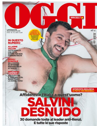
Fig. 13. Salvini su Oggi, 2014.

leader alla mano, uno che ha difetti fisici come tutti li abbiamo e non si vergogna di mostrarli, ma ci ride sopra (Fig. 13).