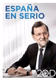
Fig. 8. Rajoy nel 2015.

Analogamente nelle campagne di Emmanuel Macron e Marine Le Pen, candidati alle presidenziali francesi del 2017: nel manifesto di Le Pen al primo turno (Fig. 9) e in quello di Macron al ballottaggio (Fig. 10) erano entrambi a mezzo busto su sfondi sfumati fra l'azzurro e il grigio.