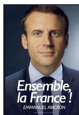
Fig. 10. Macron nel 2017, ballottaggio.

È pur vero che alcune di queste immagini riprendono soprattutto lo stile delle fototessere, ma ciò che tutte hanno in comune è il fatto di isolare il corpo del/la leader, ritraendolo inerme , mentre non fa altro che guardare in camera e non è accompagnato da niente né da nessuno, ma solo dalla headline .