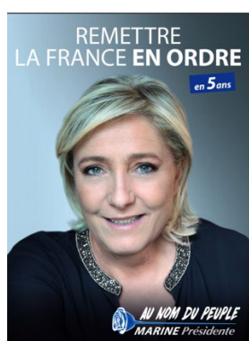
Fig. 9. Le Pen nel 2017, primo turno.

Analogamente nelle campagne di Emmanuel Macron e Marine Le Pen, candidati alle presidenziali francesi del 2017: nel manifesto di Le Pen al primo turno (Fig. 9) e in quello di Macron al ballottaggio (Fig. 10) erano entrambi a mezzo busto su sfondi sfumati fra l'azzurro e il grigio.