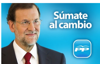
Fig. 7. Rajoy nel 2011.