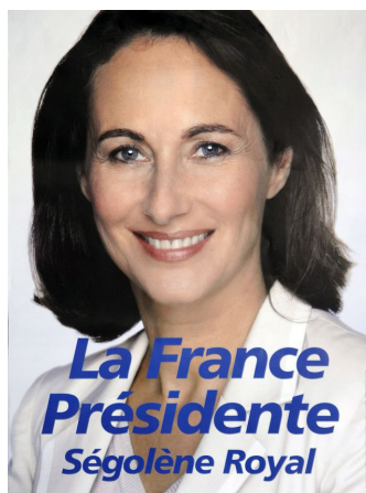
Fig. 6. Royal nel 2007.

Il format dei fashion brands si ritrova di continuo nella comunicazione politica degli ultimi vent'anni, non solo in Italia ma in tutta Europa, e in modo trasversale a partiti e coalizioni. Fu ad esempio usato nelle affissioni di Ségolène Royal, candidata del Partito socialista alla Presidenza della Repubblica francese nel 2007, col risultato che fra lei e una presentatrice di cosmetici non c'era grande differenza (Fig. 6):