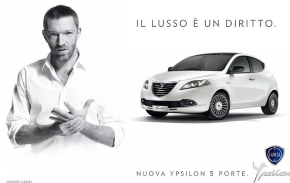
Fig. 3. Le affissioni della Nuova Ypsilon nel 2011.