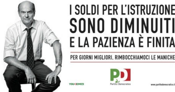
Fig. 5. Un 6x3 della campagna di Bersani, 2010-2011.

Il primo problema stava nei titoli ( headlines ) e nei sottotitoli che li completavano. Erano anzitutto frasi troppo lunghe per essere lette in un 6x3, che si guarda mentre ci si sposta in auto o su un altro mezzo. Inoltre balzavano all'occhio, perché di dimensioni maggiori, parole scelte quasi a caso: «E LA PAZIENZA È FINITA», «LE MANICHE», «SONO DIMINUITI», «È AUMENTATA». Poiché la fretta e/o la lontananza dalle affissioni impediscono a chi passa di leggere i testi più piccoli, specie se troppo lunghi, all'immagine di Bersani restavano associate solo le frasi più grandi: il risultato era che lo slogan sembrava diverso in ogni affissione e Bersani appariva, a seconda del caso, ora collegato al concetto di diminuzione («SONO DIMINUITI»), ora a quello di aumento («È AUMENTATA»), ora alla perdita della pazienza («E LA PAZIENZA È FINITA»), ora solo a «LE MANICHE». L'insensatezza di questi nessi provocava sconcerto o ilarità, e la figura del leader si svuotava di significato.