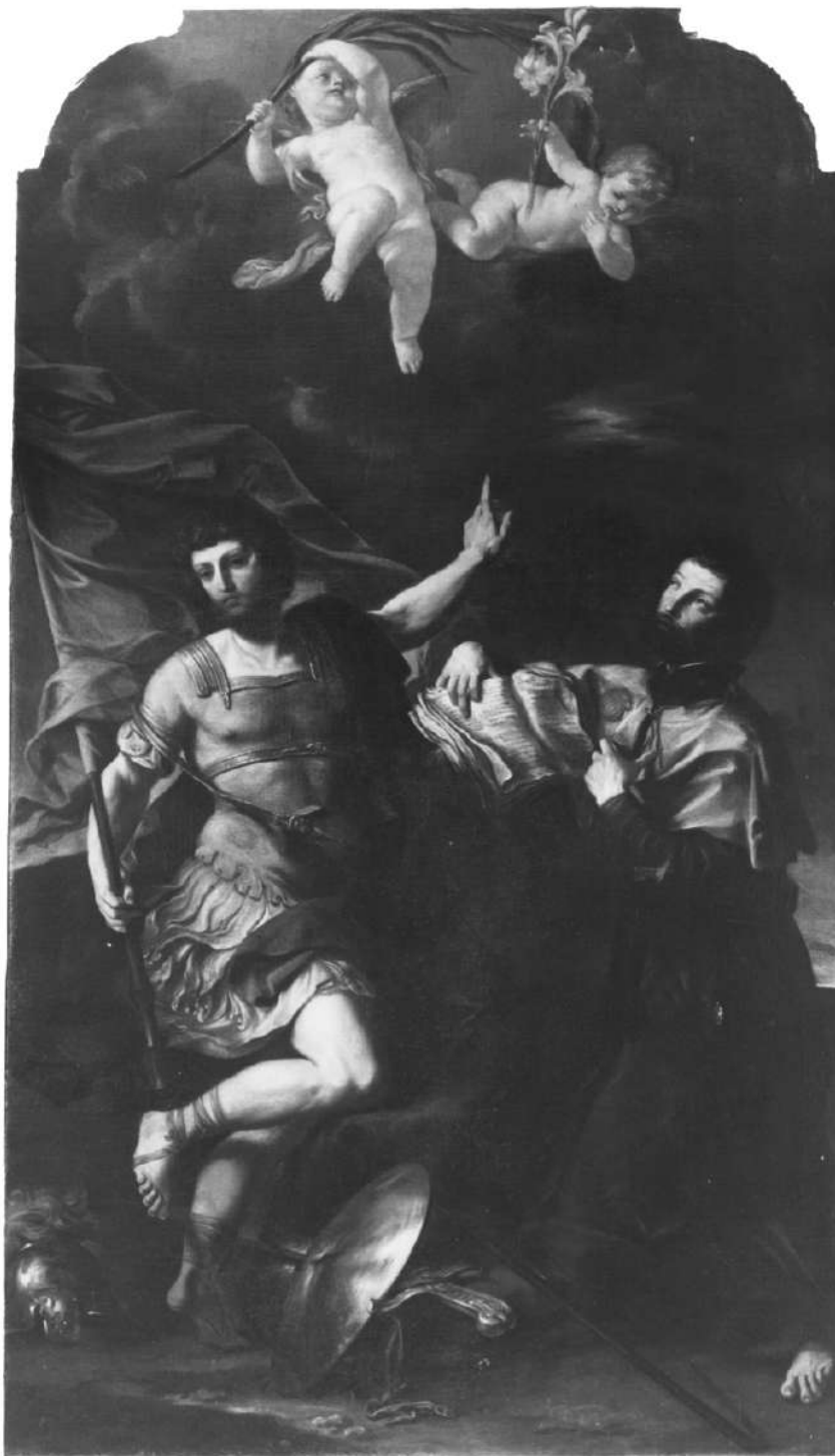
14. Felice Torelli: Santi Antonino martire e Francesco Saverio Piacenza, chiesa di Santa Maria della Pace