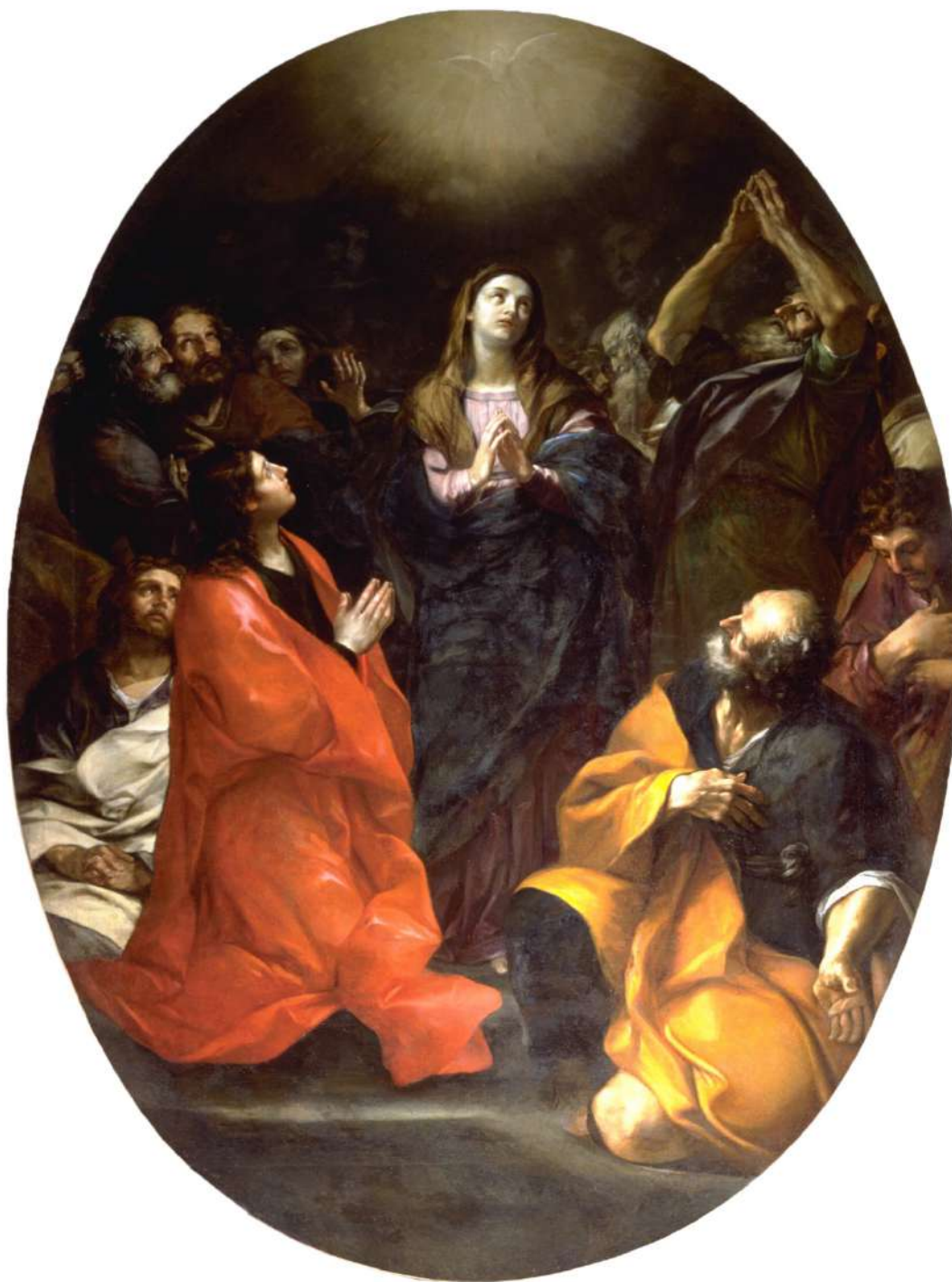
3. Felice Torelli: Pentecoste Cesena, monastero dello Spirito Santo (su concessione dell'Ufficio Beni Culturali della Diocesi di Cesena-Sarsina)