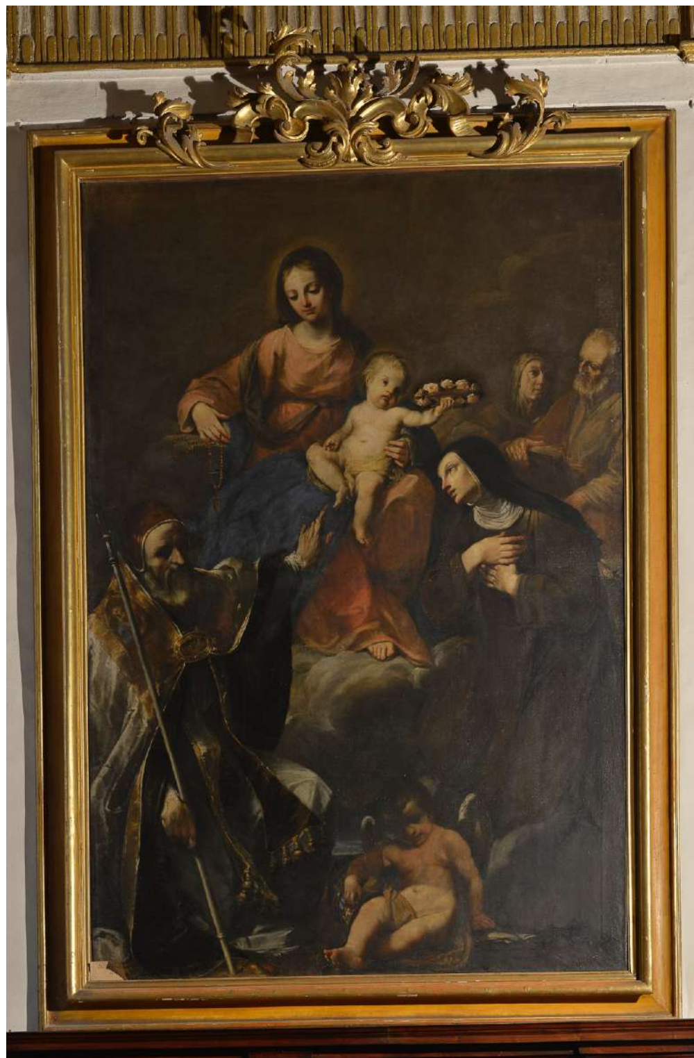
5. Felice Torelli: Madonna col Bambino e santi Pio V e una monaca francescana Bologna, chiesa di San Giovanni in Monte, sacrestia