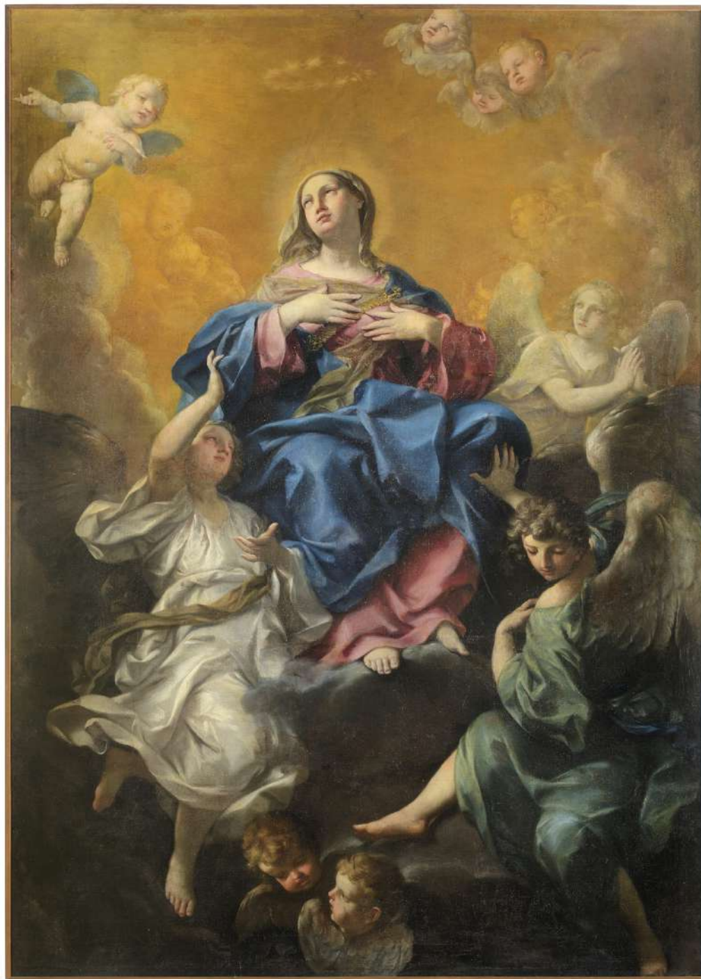
11. Felice Torelli: Vergine assunta e angeli Senigallia (Ancona), Pinacoteca Diocesana di Arte Sacra, Palazzo Mastai Ferretti (su concessione dell'Ufficio Beni Culturali della Diocesi di Senigallia)