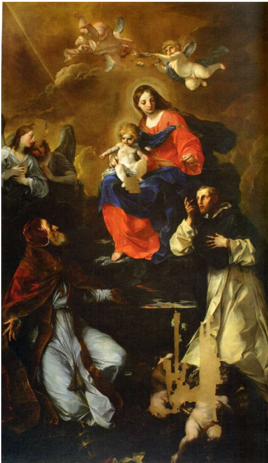
4. Felice Torelli: Madonna col Bambino e santi Pio V e Domenico Fano (Pesaro), Museo di San Domenico