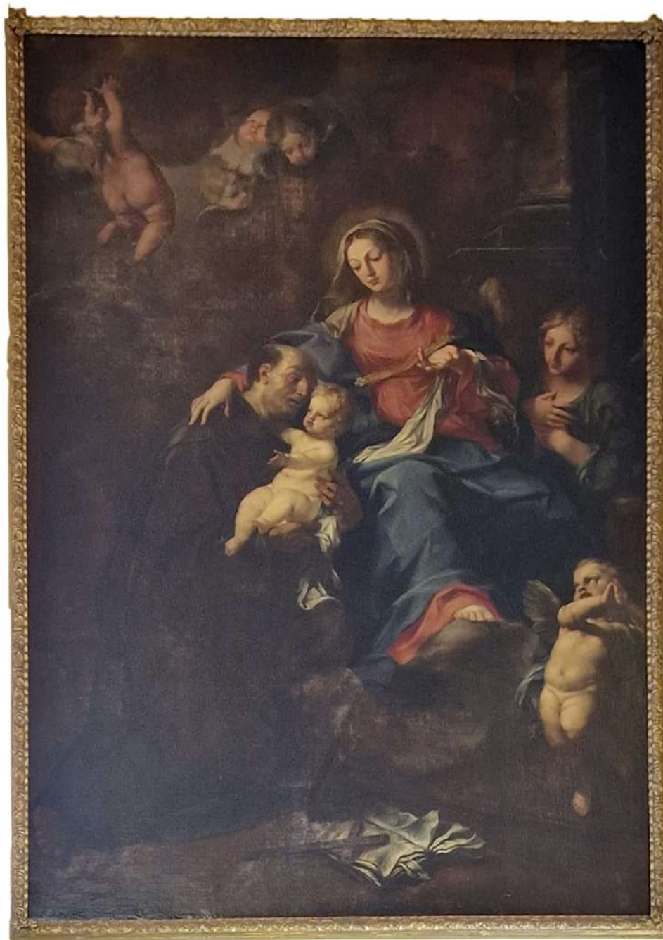
13. Felice Torelli: Madonna col Bambino e san Giovanni di Dio Crema (Cremona), chiesa dell'Ospedale Maggiore