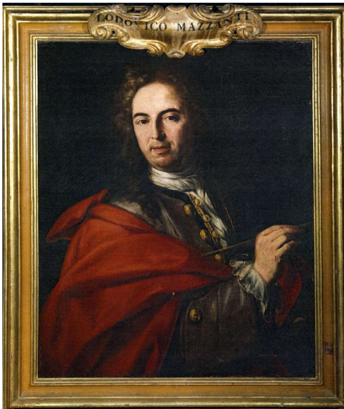
9. Felice Torelli: Autoritratto Firenze, Gallerie degli Uffizi (inv. 1856)