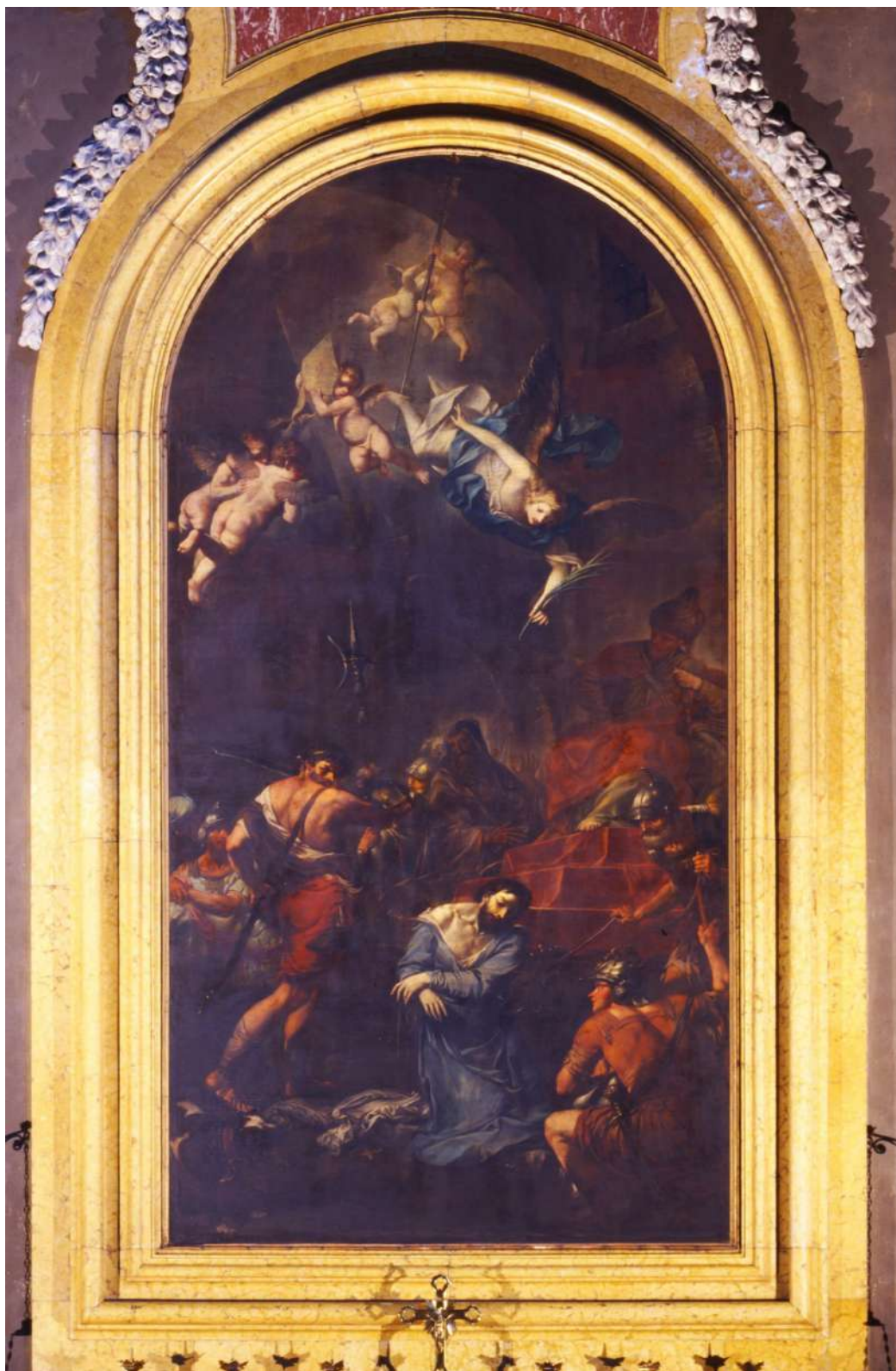
2. Felice Torelli, Martirio di San Maurelio Ferrara, basilica di San Giorgio Martire