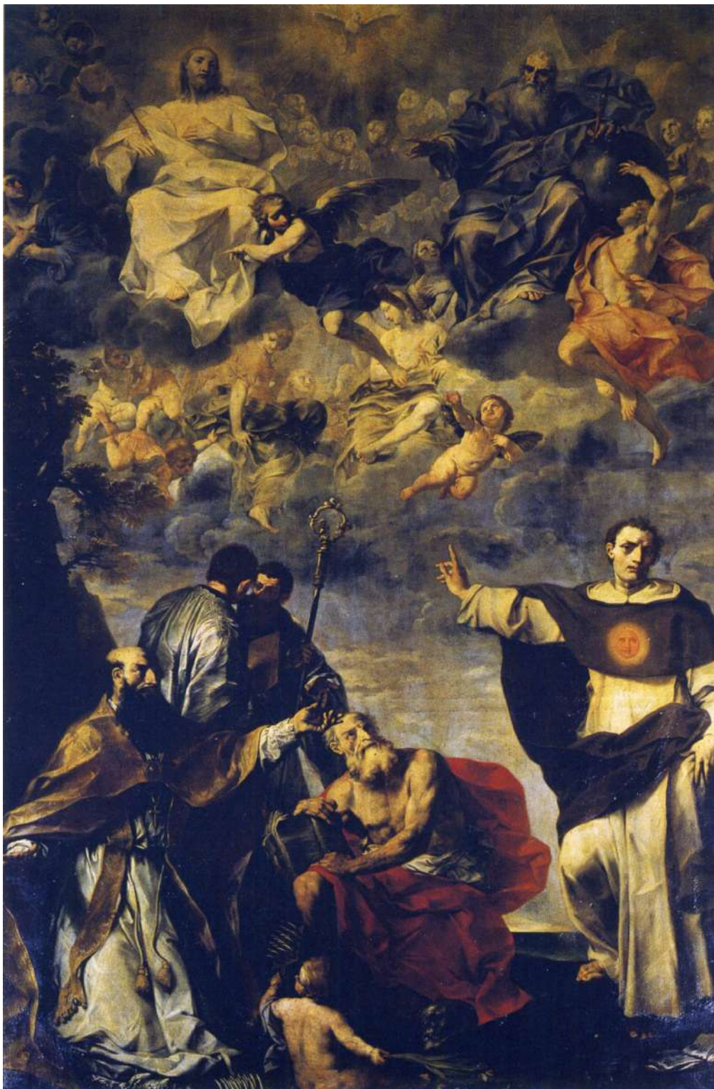
18. Felice Torelli: Trinità adorata da sant'Agostino (poi san Biagio), san Girolamo e dal beato Giovanni Colombini Bologna, chiesa della Santissima Trinità