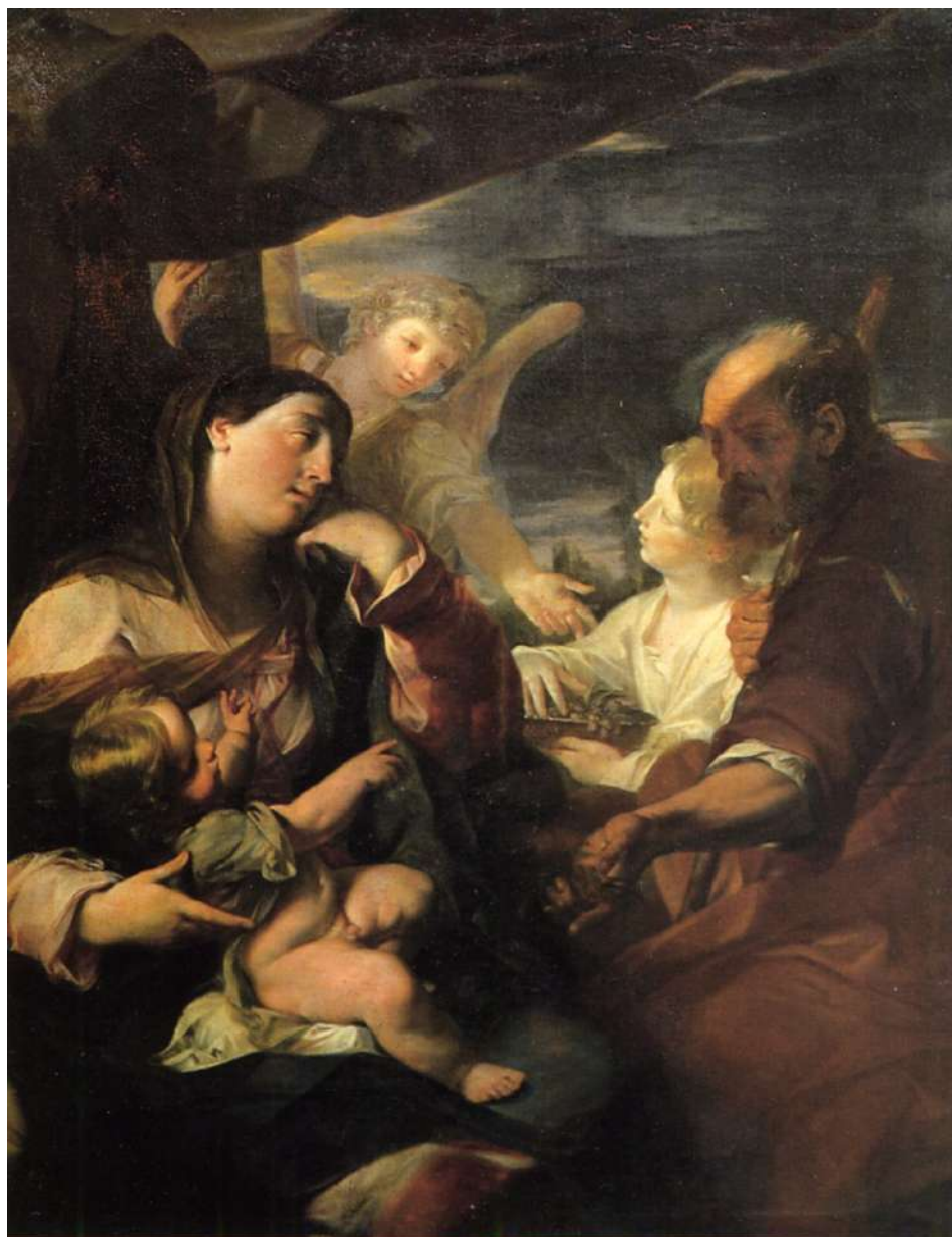
8. Felice Torelli: Riposo durante la fuga in Egitto Busto Arsizio (Varese), collezione privata