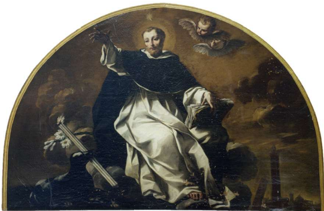
17. Lucia Casalini Torelli: Cristo e l'adultera Bologna, chiesa di Santa Maria delle Grazie