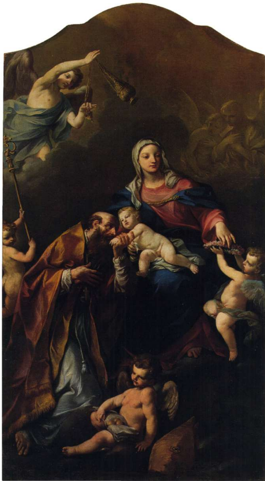
12. Felice Torelli: Madonna col Bambino e san Nicola di Bari Verona, chiesa di Santa Maria in Organo