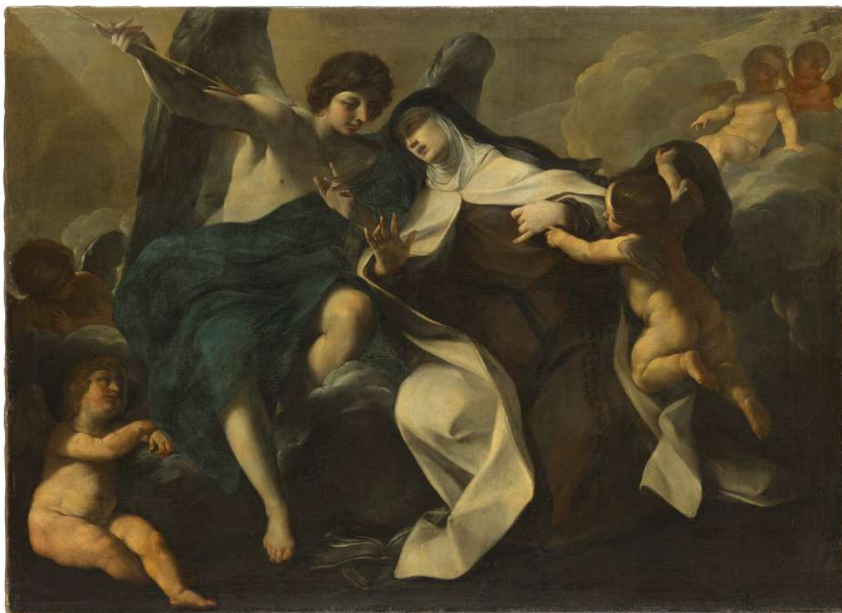
7. Felice Torelli: Transverberazione di santa Teresa Monaco, Bayerische Staatsgemäldesammlungen, Alte Pinakothek