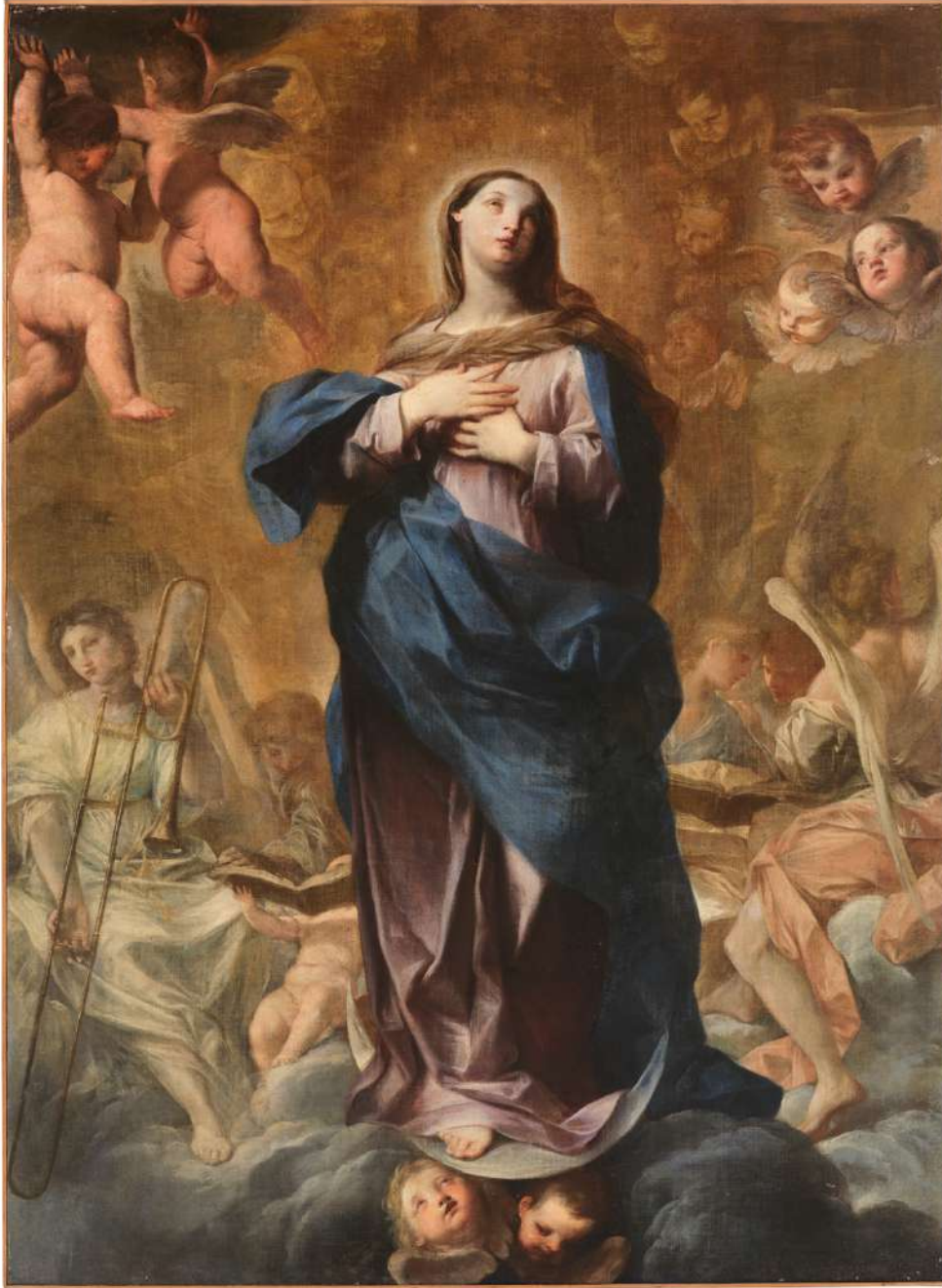
6. Felice Torelli: Immacolata Concezione Verona, Museo di Castelvechio