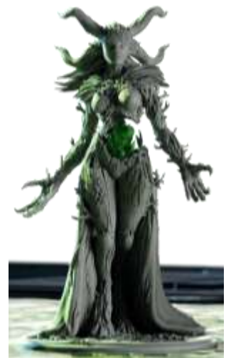
Gaea – Magnus Gallery