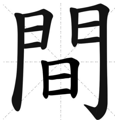
Figura 1: Ideogramma di MA

“intervallo”, qualcosa di non ancora completo che apre una distanza e fa apparire qualcosa di sconosciuto, uno spazio che frammenta la linearità, che interrompe un continuum (Tollini, 1992).