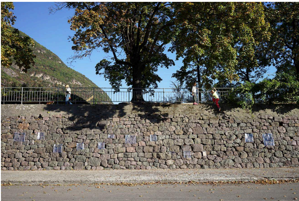
Foto 5. Piazza Alexander Langer. "Raccogliere e onorare". Bolzano 2015