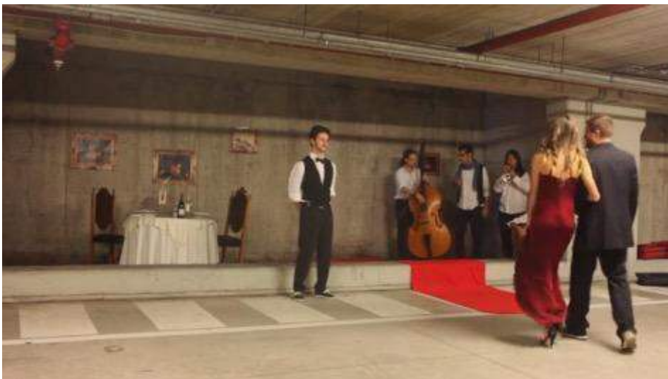
Foto 3. Underground Dinner. Parcheggio sotterraneo. Bolzano 2015