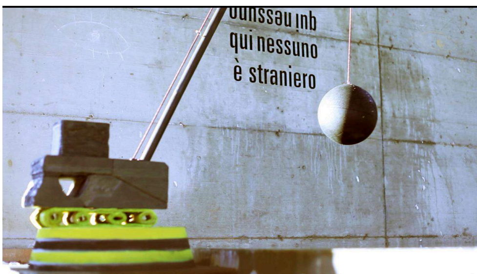
Foto 4. Performance artistica "Qui nessuno è straniero". Bolzano 2015