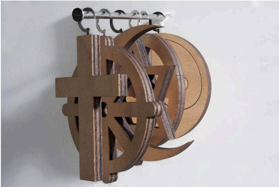
Foto 7. Veronica Spano. "Simboli religiosi al chiodo". Bolzano 2015