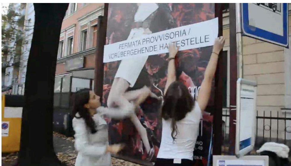
Foto 2. Fermata provvisoria. Bolzano 2015