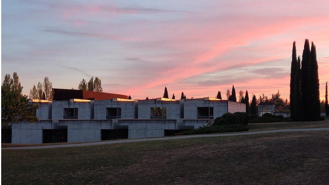
Figura 1 — Et lux perpetua, luce at eis. Cementerio Piratello, Ímola