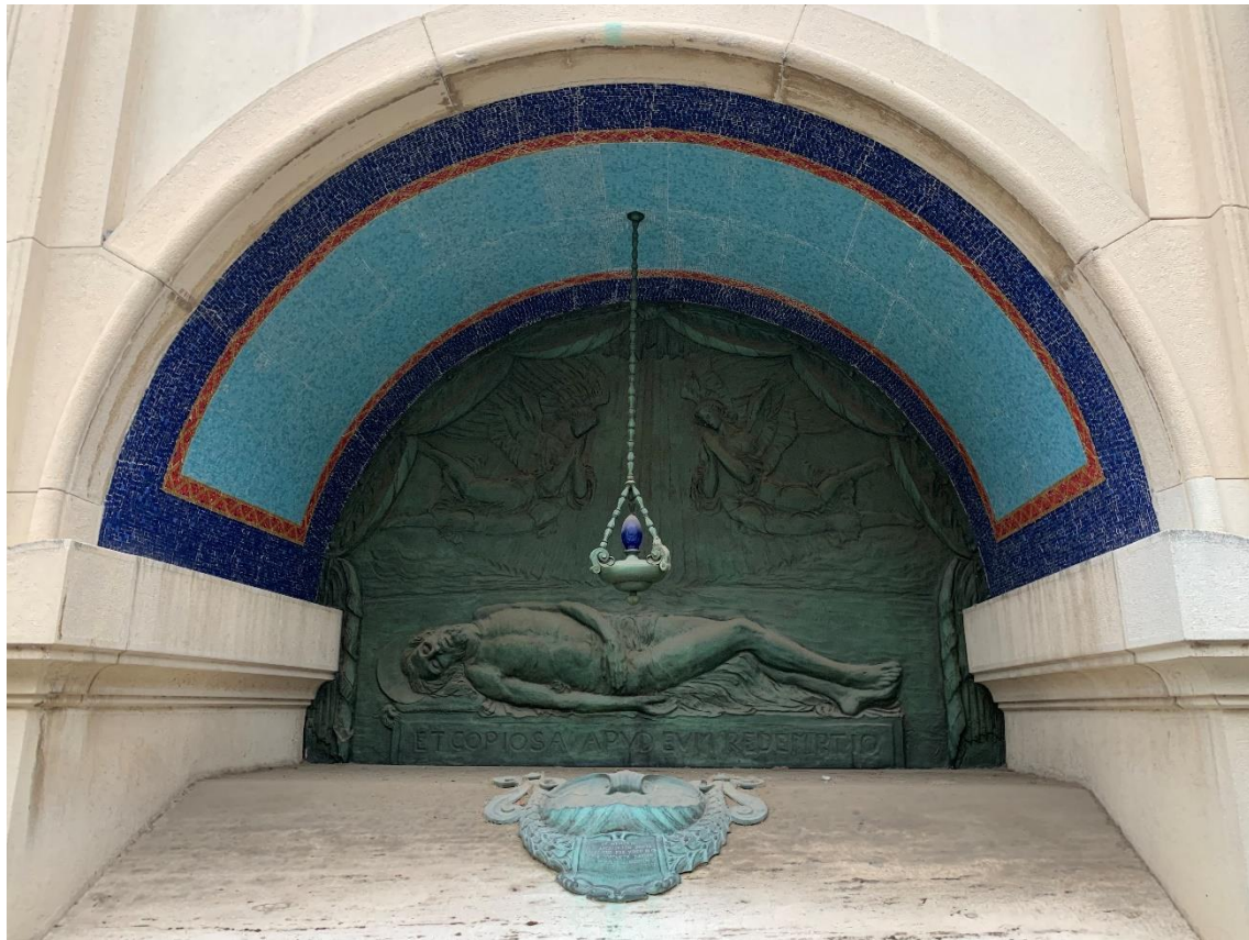
Figura 5 — Sufrir en colores . Cementerio de La Certosa, Bolonia