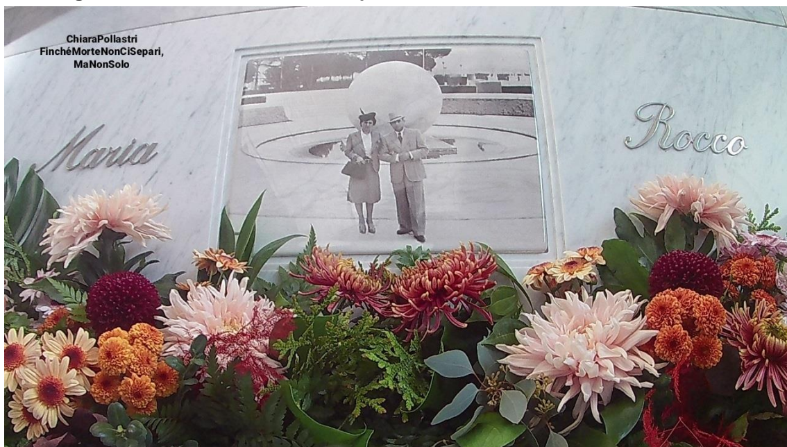
Figura 2 — Finché morte non ci separi, ma non solo. Cementerio de Tobbiana

discusión con la intención de generar un debate dialogado sobre cuestiones específicas que luego se registra en forma de discurso. Con estos grupos se busca poner en común opiniones, pensamientos y vivencias. Se trata de estimular la comunicación en las comunidades de práctica a través de la reflexión sobre temas específicos y poder así compartir lo que se piensa, se cree y se siente (Vallejos Silva; Redon Pantoja; Del Prete, 2022).