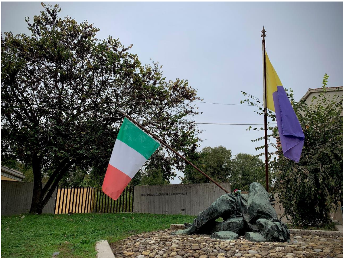
Figura 7— A los caídos por la Resistencia. Cementerio de Mirandola

nos ayudan a determinar qué elementos provocan situaciones de arraigo patrimonial. En ocasiones, el desajuste entre los espacios tradicionales y las urgencias formativas actuales se observa también cuando comprobamos la falta de lugares permeables que realmente logran integrar las apuestas más atrevidas y atractivas. El potencial de los cementerios como entornos educativos se basa sobre todo en que se trata de espacios patrimoniales, con una fuerte carga de memoria colectiva. Por eso es necesario aprovechar este potencial, para difundir el aprecio hacia el patrimonio y, al mismo tiempo, conseguir un mayor respeto hacia las generaciones que han hecho posible la realidad actual.