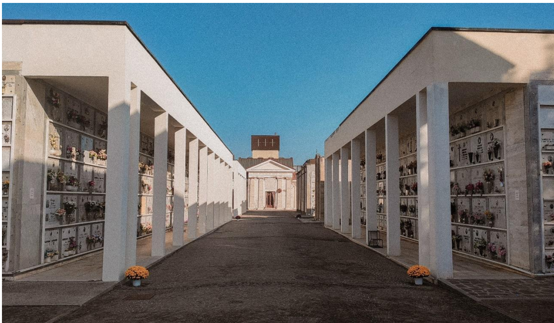
Figura 6 — Entre el orden y la confusión. Cementerio Codigoro.

cementerio porque había estado allí antes y me sorprendió su belleza y su riqueza de estatuas y monumentos. Inmediatamente me llamó la atención esta escultura coronada por un arco de mosaico: sus colores vivos me recuerdan al agua del mar y contrastan enormemente con la atmósfera lúgubre del entorno del cementerio”. Por su parte, Federica Leanza (Figura 6) plantea una cuestión de orden compositivo y de efectos visuales: “La foto representa la fachada principal inmediatamente frente a la entrada al cementerio de Codigoro. Es interesante cómo el esquema arquitectónico repetido de pilares y nichos da una sensación de orden, pero al mismo tiempo de desconcierto. Agregué un efecto de grano en la postproducción para resaltar cómo, poco claro y nítido, el ser humano percibe la muerte.”