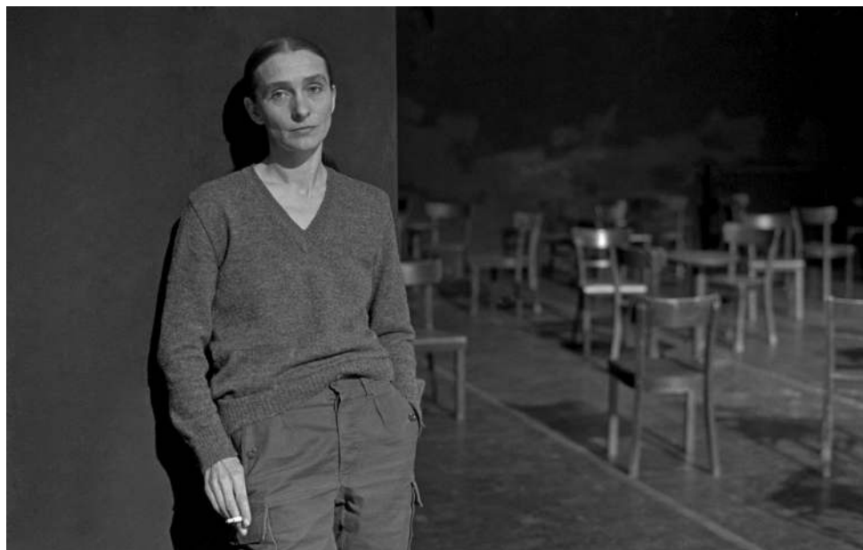
Figura 4. Pina Bausch al Teatro Due di Parma in occasione della prima apparizione del Tanztheater Wuppertal in Italia (15-18 gennaio 1981), foto di Alberto Roveri/Rosebud2 (copyright assolto).