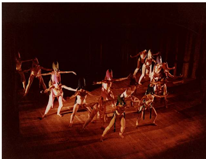
Figura 2: Gruppo Ritmico Contemporaneo in Un mito , coreografia di Fiorella De Pierantoni (Bologna, Teatro Duse, 1980).