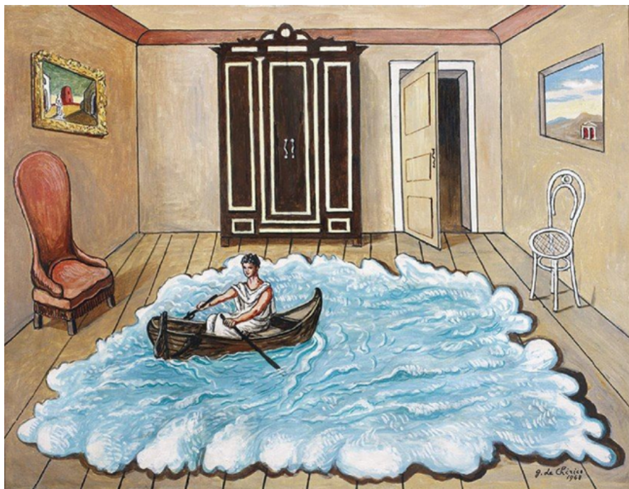
Fig. 1 – Giorgio de Chirico, Ritorno di Ulisse , 1968, 80 x 60 cm, Acrilico su tela; Roma, Fondazione Giorgio e Isa de Chirico.

Prendiamo dunque la celebre opera di Giorgio de Chirico Il ritorno di Ulisse (1968, Fig. 1). Qui, il discorso figurativo articola con profonda immediatezza tutto quello che cercheremo di spiegare in seguito ricorrendo al testo omerico.