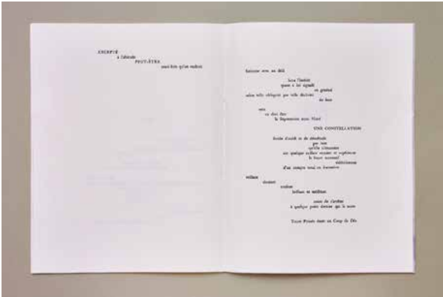
Figura 1. Mallarmé 1914 (1993)

il sentimento di libertà estetica, generato dall'avvertire nella rarefazione verbale lineare la stabilità, la fatalità contingente della combinazione dei possibili. Un trasferimento marcato dall'esecuzione-interpretazione dell'opera che si trasferisce in modo intertestuale dalla poesia alla musica: non è un caso che la poesia di Mallarmé venga espressamente citata dai teorici dell'apertura indeterminista come Pierre Boulez ( Don, 3 Improvisation sur Mallarmé e soprattutto la Piano sonata n. 3 ), Karlheinz Stockhausen ( Klavierstück XI e Zyklus ) e Luciano Berio ( Epifania e Circles ) 37 .