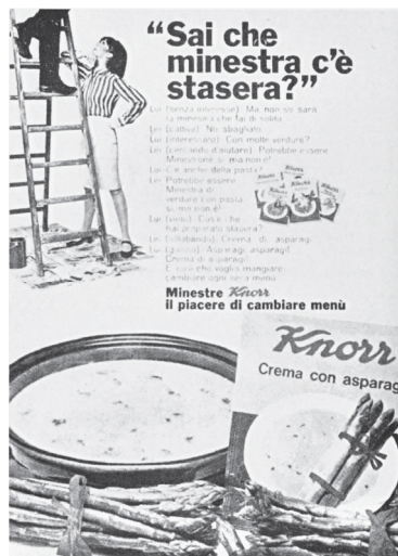
Figura 5. Pubblicità Knorr (in ibid. , p. 260).

Chiude la disamina echiana un ultimo caso (Fig. 5), la pubblicità di una crema Knorr, che fornisce un esempio di comunicazione puramente fatica, che non aggiunge nulla sul piano comunicativo, né in termini di codici espressivi né in termini di messaggio. Tutto, in questo annuncio, è secondo Eco estremamente riconoscibile, iper–codificato a livello iconico, verbale e ideologico: non c’è sorpresa, non c’è sforzo interpretativo, non c’è novità alcuna: la comunicazione serve solo a mantenere e rafforzare il rapporto marca–consumatore.