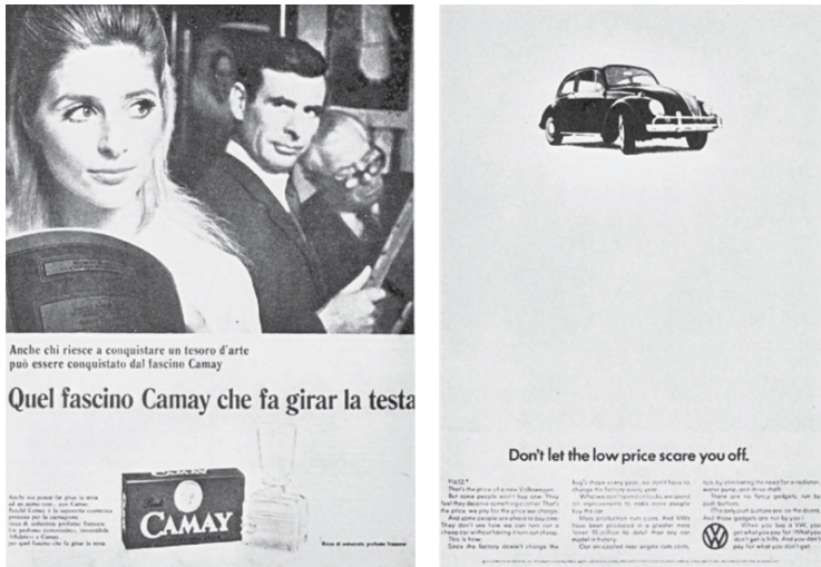
Figure 2 e 3. A sinistra, l'annuncio Camay (in ibid. , p. 245). A destra, pubblicità americana della Volkswagen 1200 (in ibid. , p. 252).

Abbiamo poi una terza pubblicità, una pubblicità Volkswagen (Fig. 3). Qui il gioco è l'opposto del precedente: nessuna originalità segnica (un'automobile classica e riconoscibile per la pubblicità di un'automobile); alta originalità ideologica.