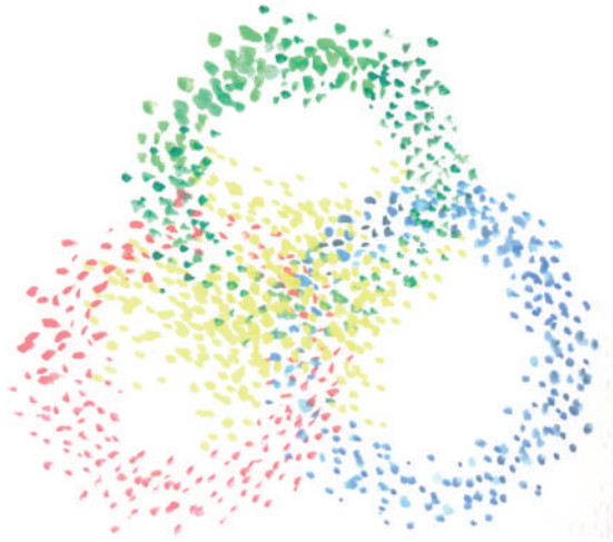
Fig. 1 - A ogni sfera – pubblica, privata e del Terzo settore – la propria definizione d’interesse generale, rappresentato da un’area di convergenza al centro