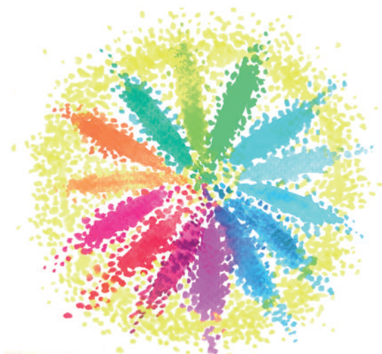
Fig. 2 - L'interesse generale come cerchio esterno, dove i molti e variegati soggetti attivi nella cura dei beni comuni dimostrano "interesse al disinteresse"

Costituzione italiana, in ricerche ormai antiche, e nei patti con i cittadini; (iii) che la proposta di un settore pubblico che faciliti l'empowerment e l'autonomia iniziativa non deve essere vista come sostitutiva dei servizi pubblici, che consideriamo standard novecenteschi che vanno sia assicurati e difesi che ibridati e innovati. Quando i servizi standard si intrecciano ai servizi ibridi e condivisi, in accezione sussidiaria, ecco un valore aggiunto comunitario che, per così dire, li aumenta (Ciaffi, 2024).