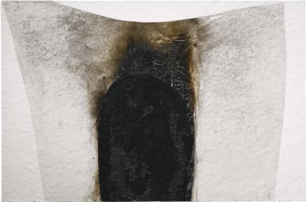
4. Alberto Burri: Bianco plastica Collezione privata