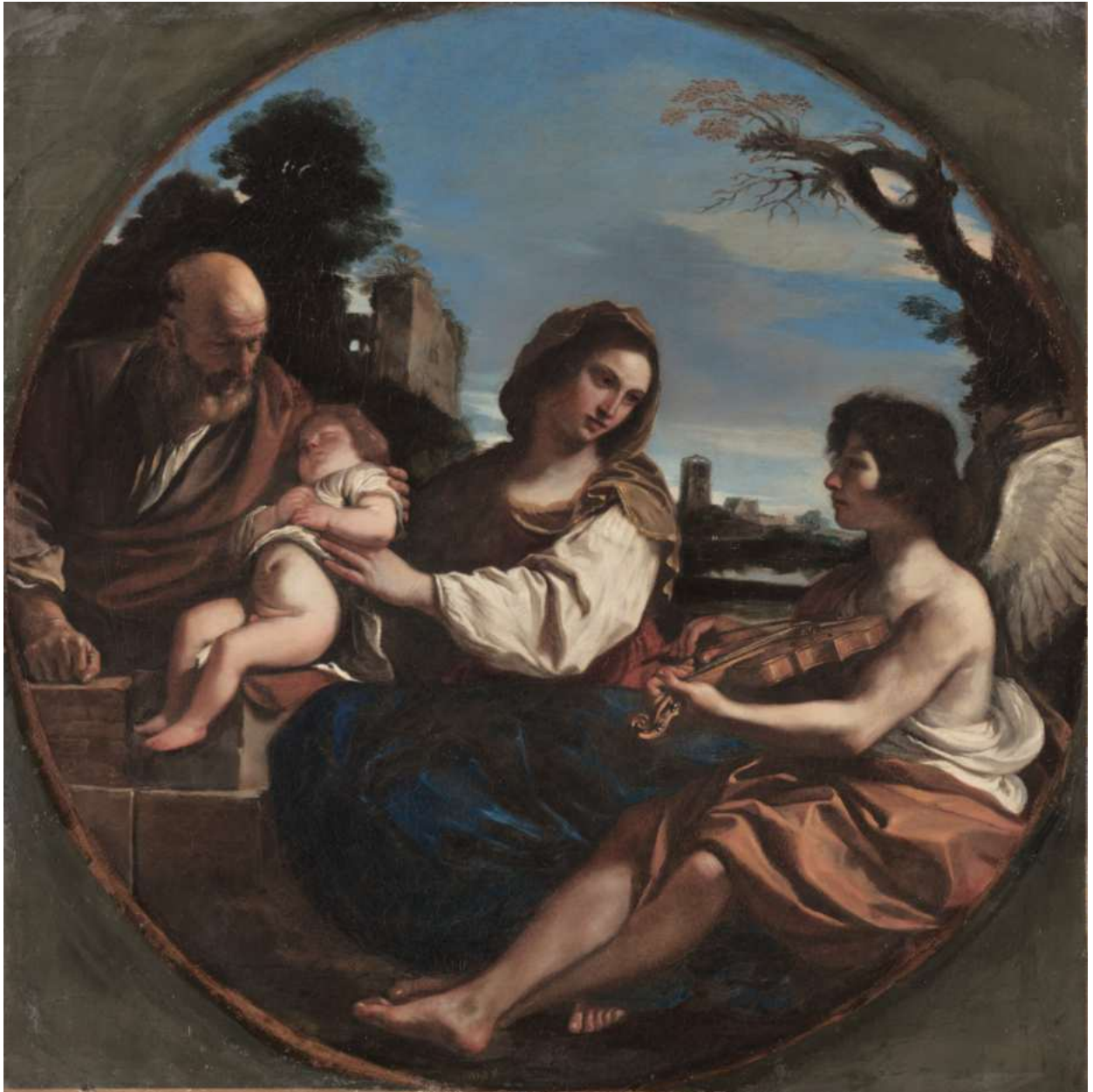
3. Guercino: Riposo nella fuga in Egitto Cleveland, Museum of Art