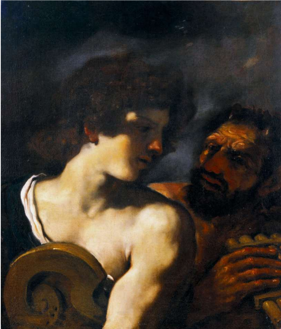
2. Guercino: Apollo e Marsia BPER - Banca Popolare dell'Emilia-Romagna