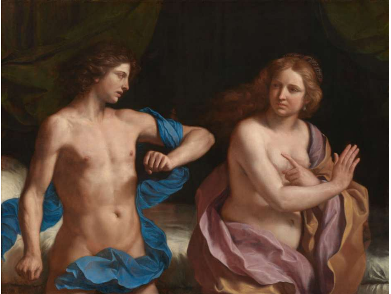
5. Guercino: Ammon e Tamar Washington, The National Gallery of Art