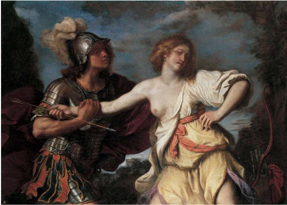
6. Guercino: Rinaldo e Armida Collezione privata