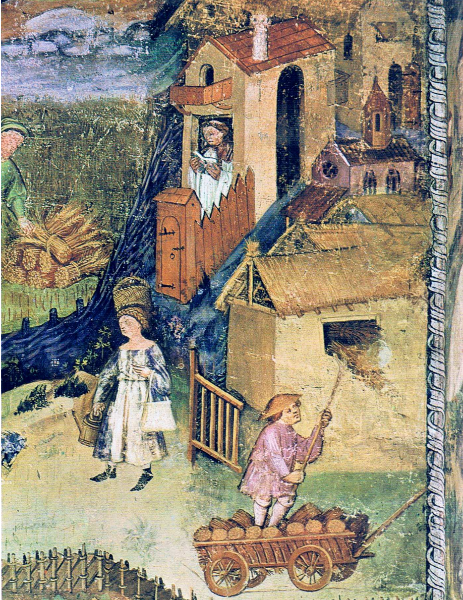
Fig. 9 - Maestro Venceslao, mese di agosto (particolare), affresco fine XIV - inizio XV secolo. Trento, Castello del Buonconsiglio, Torre Aquila (pubblico dominio).