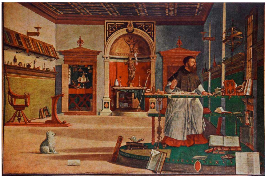
Fig. 13 - Vittore Carpaccio, Sant'Agostino nello studio o Visione di sant'Agostino , tempera su tela, 1502. Venezia, Scuola di San Giorgio degli Schiavoni (pubblico dominio).