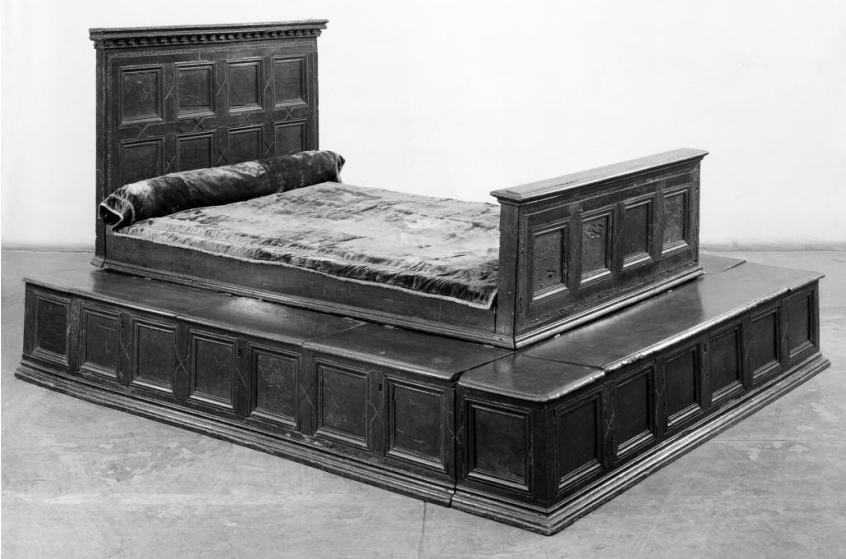
Fig. 1 - Letto da Palazzo Davanzati, Firenze, seconda metà del secolo XV. New York, Metropolitan Museum of Art (pubblico dominio).