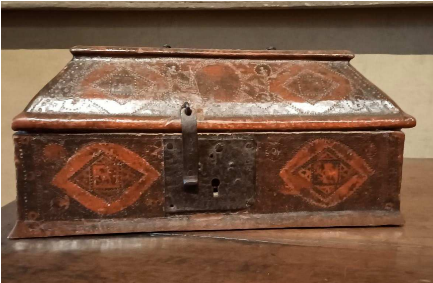
Fig. 4 - Scrigno, legno, gesso, ferro, manifattura italiana, secolo XV. Firenze, Museo di Palazzo Davanzati (pubblico dominio).