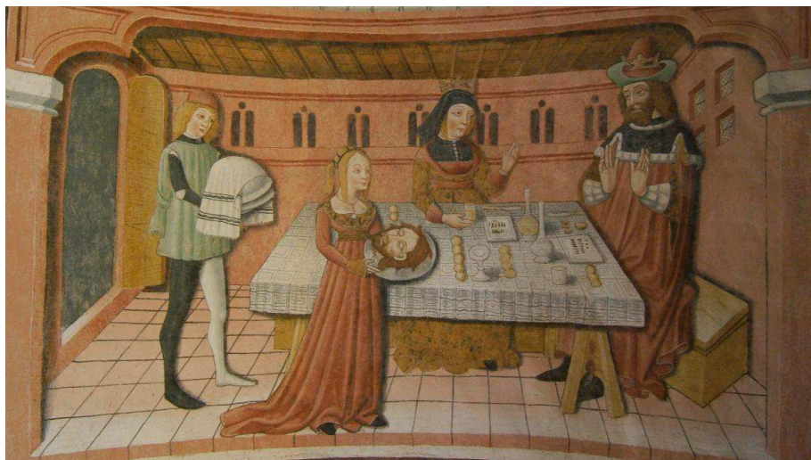
Fig. 11 - Tommaso e Matteo Biazaci da Busca, Banchetto di Erode , affresco 1483. Montegrazie (Imperia), Santuario di Nostra Signora delle Grazie, abside settentrionale.