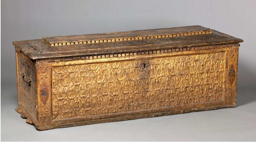
Fig. 3 - Cassapanca, legno di pino e pioppo, gesso, parzialmente dorato, modellato e dipinto, 1425-50, Italia (Toscana, Firenze o Siena). New York, Metropolitan Museum of Art (pubblico dominio).