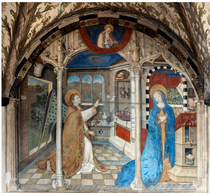
Fig. 10 - Giusto di Ravensburg, Annunciazione , affresco 1451. Genova, convento di Santa Maria di Castello, chiostrino.