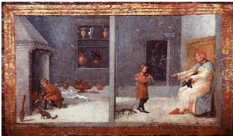
Fig. 8 - Interno di cucina con figure e suppellettili, cassone di manifattura umbra, legno, intaglio, pittura, 1450 - 1510. Firenze, Museo di Palazzo Davanzati (pubblico dominio).