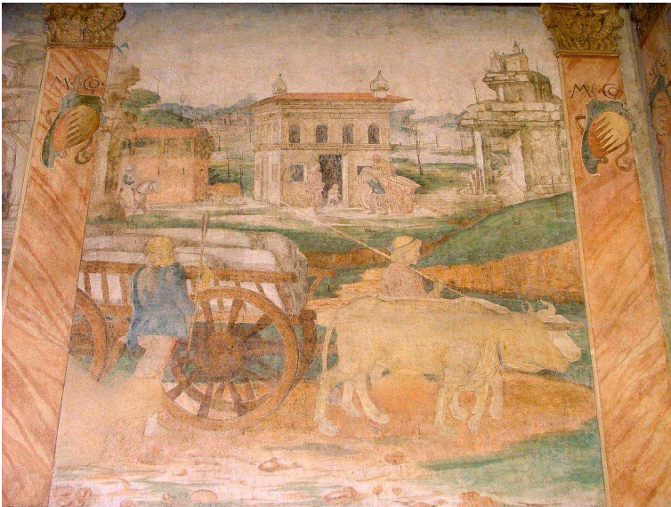
Fig. 6 - Maestro delle Storie del pane, case coloniche e carri. Bentivoglio (BO), Castello di Ponte Poledrano, Sala del Pane, ottavo riquadro, 1475-1481.