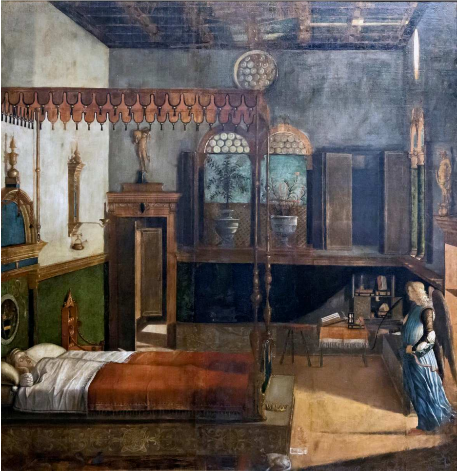
Fig. 12 - Vittore Carpaccio, Sogno di sant'Orsola , tempera su tela, 1595. Venezia, Gallerie dell'Accademia (pubblico dominio).