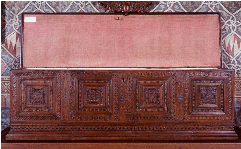
Fig. 2 - Cassapanca/Cassone, manifattura emiliana, legno pioppo, intarsio, secolo XV. Firenze, Museo di Palazzo Davanzati (pubblico dominio).