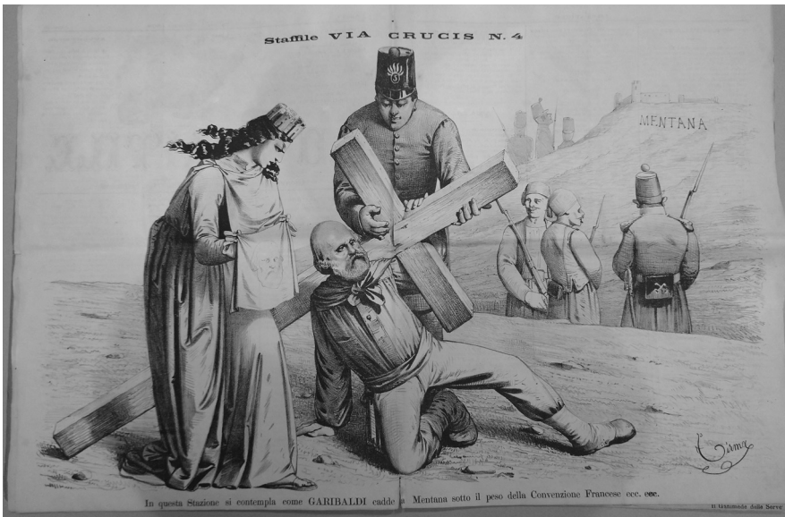
FIG. 2 «Lo Staffile», I, 4, 1 febbraio 1868, pp. 2-3.

È nel numero d'apertura di febbraio però che si evidenzia il ruolo che sotto l'evidente regia stecchettiana si intende dare a una illustrazione per così dire narrante e del tutto d'avanguardia sul piano mediatico, rappresentata da una straordinaria Via Crucis di Garibaldi che si allontana da Mentana stremato dal peso della croce di legno, mentre l'Italia con corona turrita, novella Veronica, reca in mano il panno usato per detergere il sudore, sul quale rimane stampata l'effigie dell'eroe. 17