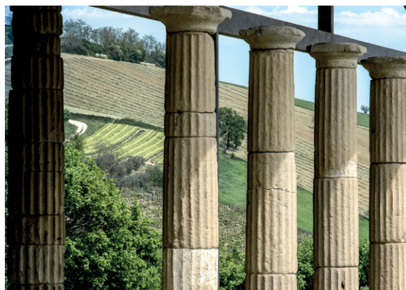
Fig. 2. Dettaglio del colonnato del portico settentrionale del Santuario Ellenistico-Romano di Monte Rinaldo.

Il Santuario Ellenistico-Romano di Monte Rinaldo (La Cuma), situato nel cuore dell'antico