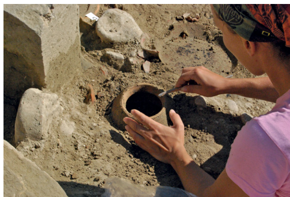
Fig. 7. Operazioni di scavo presso la Necropoli orientale della città romana di Suasa .

La scoperta di fasi precoci di occupazione stabile, con edifici costruiti con tecniche edilizie semplici, con fondazioni in ciottoli e alzato in argilla cruda, costituisce uno dei contributi più significativi che le ricerche suasane hanno dato al filone di studio dedicato alla "pre-colonizzazione", una temati-