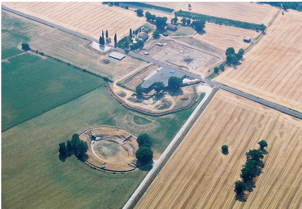
Fig. 6. Foto aerea del Parco Archeologico della città romana di Suasa .

completo dell'evoluzione della città di Suasa e del suo territorio.