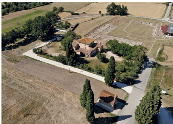
Fig. 9. Area del casolare detto “Tappatino” di Suasa .

sulla quale si affacciava un monumentale edificio su podio, con ogni probabilità destinato a funzioni pubbliche e forse riconducibile a un tempio. Nel XV secolo, i resti di queste strutture furono riutilizzati per la costruzione di un edificio a pianta quadrangolare, interpretato come casa-torre. In età rinascimentale, la struttura venne ampliata da Ottaviano Volpelli, giureconsulto presso la corte dei Della Rovere, che sfruttò sia le preesistenze imperiali sia quelle medievali per realizzare il suo palagio . Infine, a partire dalla fine del XVII secolo, furono aggiunti i vari corpi di fabbrica già menzionati, che si svilupparono tra il XVIII e il XX secolo.