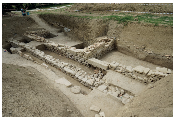
Fig. 4. Area di scavo della campagna del 2023 presso il Santuario Ellenistico-Romano di Monte Rinaldo.

ticata con tempio e sacello, riflette modelli culturali greco-orientali e laziali tipici dell'epoca ellenistica.