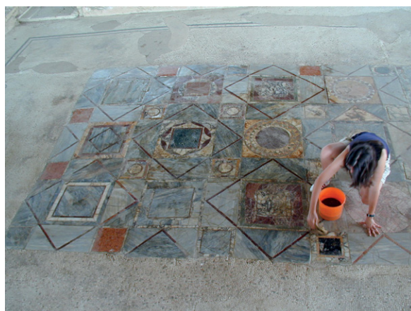
Fig. 8. Pulizia del pavimento in opus sectile dell' Oecus G della Domus dei Coiedii a Suasa .

In età alto e medio-imperiale, Suasa si dotò di edifici per spettacolo (l'anfiteatro e il teatro) e di un grande Foro Commerciale, situato di fronte a una lussuosa dimora con pavimenti musivi e marmorei nota come Domus dei Coiedii (II sec. d.C.) (Mazzeo Saracino 2014: 29-43) 7 . Tuttavia, la sua