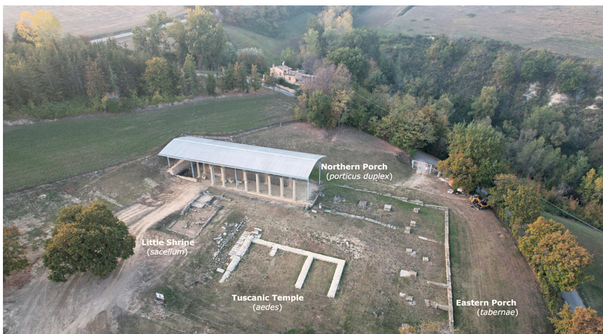
Fig. 1. Foto area del Santuario di Monte Rinaldo, Area archeologica La Cuma (Belfiori, Giorgi 2024: 205).

e proximal sensing alla geognostica, fino allo scavo stratigrafico. Questo approccio multidisciplinare consente di affrontare problematiche di ampio respiro, sia nel contesto dell'archeologia urbana che nello studio delle città abbandonate. In linea con le tendenze più attuali dell'archeologia, le ricerche recenti hanno visto un crescente utilizzo di tecniche di archeologia preventiva, volte a ridurre il consumo del deposito stratigrafico e a favorire un'analisi contestuale più approfondita di manufatti e ecofatti, con un'integrazione sempre più marcata con lo studio paleo-ambientale.