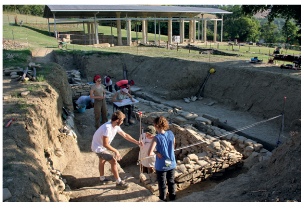
Fig. 3. Studenti impegnati nelle operazioni di rilievo topografico delle strutture a Monte Rinaldo.