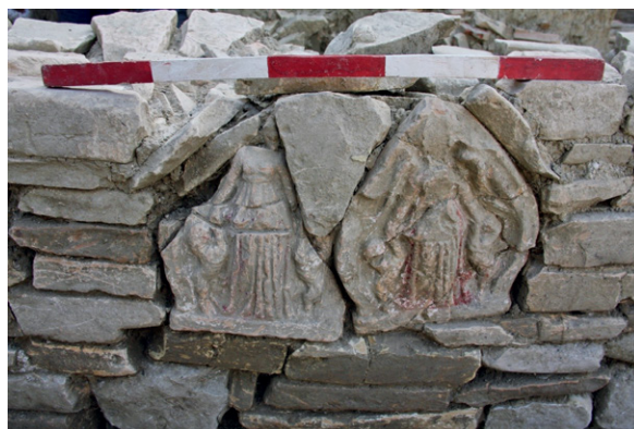
Fig. 5. Antefisse raffiguranti Potnia theròn reimpiegate nel prospetto Est dell'edificio triumvirale-augusteo di Monte Rinaldo (Belfiori, Cossentino, Pizzimenti 2020: 85).

Nel periodo di massimo splendore dell'architettura ellenistica in Italia, il santuario si sviluppò in un complesso monumentale, verosimilmente promosso da personalità influenti radicate nel territorio. Prima della municipalizzazione di epoca triumvirale-augustea, questo sito parrebbe accen-