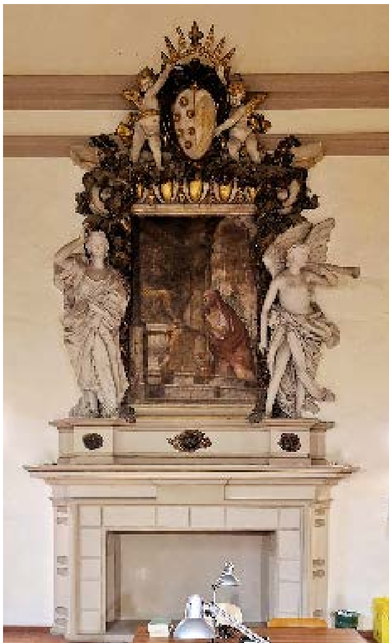
Fig. 6 – Bologna, Palazzo Bentivoglio, camino, metà del secolo XVII.

tra le due parti del camino, così come la ripresa di modelli serliani di primo Cinquecento, potrebbe adombrare un'esecuzione in due tempi, ad esempio una ridipintura della fuga su un camino preesistente.