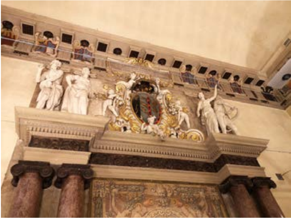
Fig. 3 – Bologna, Palazzo Lucchini-Angelelli-Zambeccari, sala 'dei Quaranta', fastigio terminale del camino monumentale, 1619.

sopra le colonne. 41 L'impaginato generale ricorda, anche nel trattamento coloristico, il grandioso altare del Rosario costruito da Ambrosini nel 1589 a S. Domenico, più ricco tuttavia di dettagli (colonne corinzie su differenti piani ribattute da lesene). Sopra gli aggetti della trabeazione sono poi le due statue di Venere e Marte, di Tedeschi. 42 Altro camino di grandissimo impatto è quello del Palazzo Lucchini-Angelelli (piazza Calderini, 4), del 1619 (fig. 3): si colloca nella sala detta (impropriamente) 'dei Quaranta', che si conclude in alto con un fregio dorico, del tutto insolito a Bologna in questa posizione. Il camino, invece, è affiancato da ben quattro colonne ioniche con basi vitruviane. Forse anche in questo caso il progettista va individuato in Floriano Ambrosini, l'unico architetto bolognese dell'epoca capace di un tale dispiegamento di conoscenza del linguaggio all'antica. 43