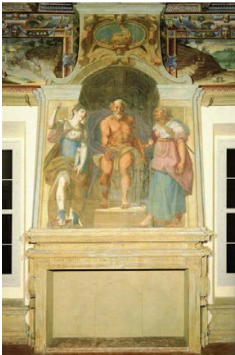
Fig. 4 – Bologna, Villa Guastavillani, sala del Cardinale, camino, 1580 ca. (da RIGHINI 2001, p. 110).

Il rogo dei libri eretici sulla fuga. 51 La bocca da fuoco è inquadrata da due volute che reggono un inconsueto architrave decorato nel fregio (sovradiimensionato) da bugne quadrate a diamante. La scena superiore è invece in-