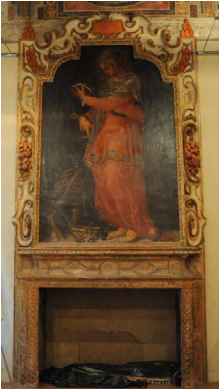
Fig. 5 – Bologna, Palazzo Paleotti, camino, seconda metà del secolo XVI.