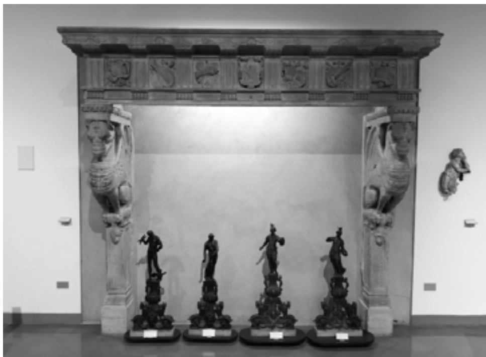
Fig. 2 – Bologna, Museo Civico Medievale, mostra di camino proveniente da casa Berò, inizio sec. XVI.