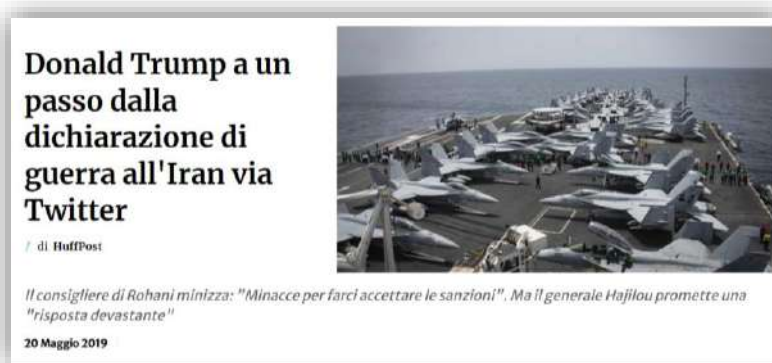
Figura 2. La notizia del tweet con cui Donald Trump aveva annunciato la sua 'dichiarazione di guerra'

Anche nel recente passato l'utilizzo dei social media per veicolare le intenzioni dei capi politici e di Stato ha avuto ampia diffusione: perfino le dichiarazioni di guerra che nel passato sarebbero state comunicate attraverso documenti ufficiali, oggi vengono comunicate a tutto il mondo mediante un tweet o un post (cfr. Figura 2)