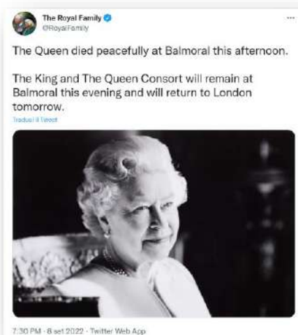
Figura 3. Il tweet con cui è stata comunicata la morte della regina Elisabetta II il giorno 8 settembre 2022

Questi sono solo alcuni esempi, ma sono utili a comprendere la portata del fenomeno. Il web e i social media stanno diventando fonti insostituibili per la ricostruzione della storia e la storiografia non potrà fare a meno di essi. La domanda che ci si pone quindi è la seguente: come potranno gli storici del futuro ricostruire il periodo storico che stiamo vivendo o le vicende belliche che stiamo vivendo se le istituzioni della memoria non saranno in grado di archiviare e conservare le risorse sul web e i social media? Ancora: come sarà possibile, in futuro, studiare gli aspetti della vita quotidiana attuale – come la cultura popolare, gli usi ed i costumi, l'alimentazione, la salute e il benessere o i viaggi – per ricostruire la civiltà presente prescindendo dalla conservazione dei social media, da Facebook a Twitter ad Instagram, che costituiscono una 'finestra' aperta sulla vita di tutti i giorni? È per questo motivo che negli ultimi vent'anni si è molto sviluppato il web archiving, cioè: [5]