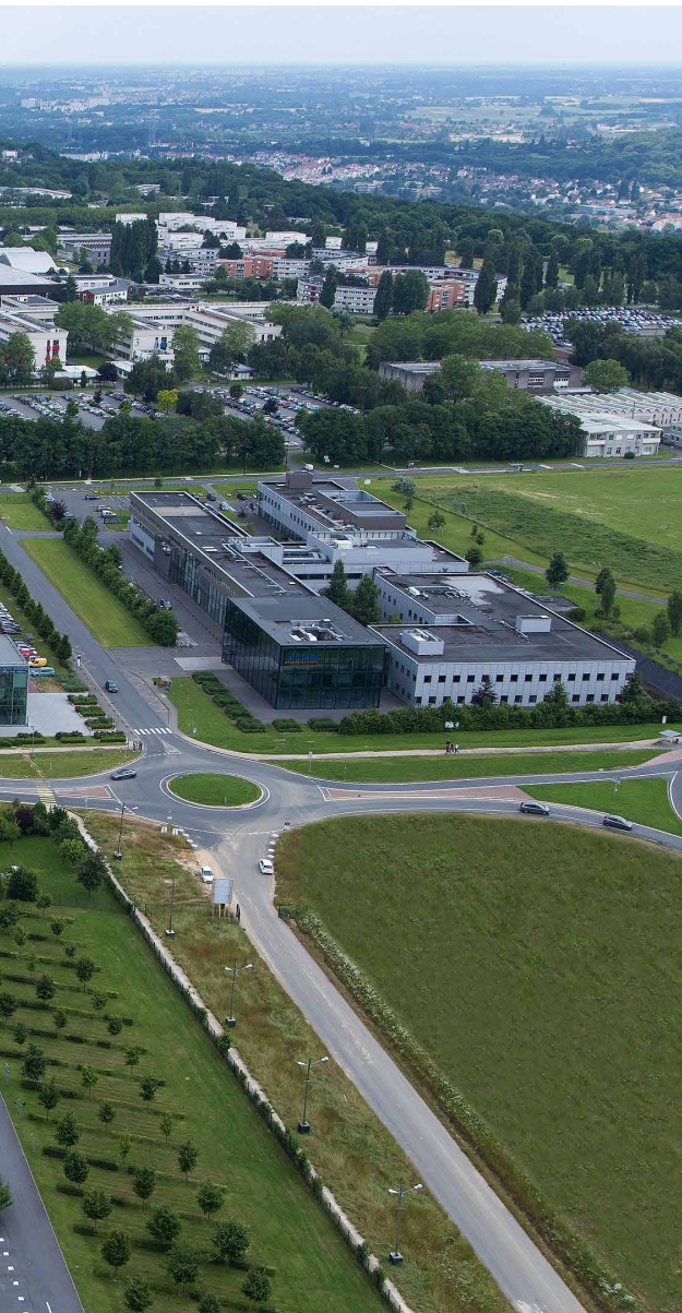
Fig. 2 – Campus dell'École polytechnique di Palaiseau nella piana di Paris-Saclay, Francia: commistione di aree antropizzate, naturali e agricole (fotografia: Jérémy Barande, Collections École Polytechnique).

complessivo, anche le strutture tecnologiche al servizio delle attività di ricerca e innovazione acquisiscono l'identità autonoma di un sistema emergente, guidato da una forma di intelligenza collettiva di rete (Desvigne, 2020a). In questo terzo spazio non può non risuonare la poetica clementiana del 'terzo paesaggio' che ha influenzato il dibattito e la pratica delle disci-